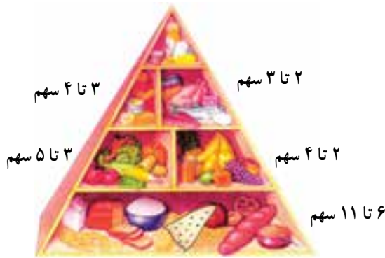
هرم غذایی نوجوان

نمونه‌ی رژیم غذایی برای افراد در دوره‌ی بلوغ