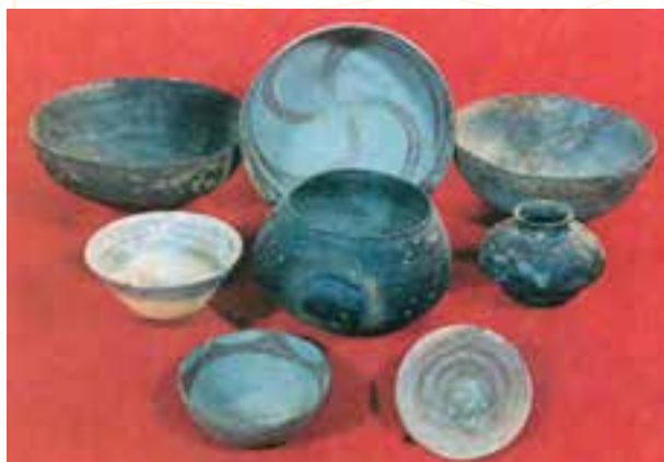
اشیای به‌دست آمده از یک قبر در شهر سوخته (۲ تا ۳ هزار سال پیش از میلاد)

در سال «۱۲۹۵ ه.ش ۱ » باستان‌شناسان محوطه‌ی وسیعی را در ۵۷ کیلومتری جاده‌ی زابل به زاهدان کشف کردند که شهر سوخته نام دارد و قدمتش به هزاره‌های چهارم و سوم پیش از میلاد می‌رسد. در کشفیات شهر سوخته بیش‌تر مَهرهای گِلی، بیکره‌های کوچک گِلی حیوانات، اشیای زینتی از سنگ لاجورد، فیروزه و عقیق و قطعات چوبی که به یک نوع بازی شطرنج شباهت دارد به‌دست آمده است. از مهم‌ترین آثار کشف شده، لوحی به زبان ایلامی است، بنابراین شهر سوخته مرکز ارتباطی غرب و شرق فلات بوده است.