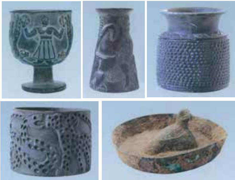
نمونه‌هایی از آثار یافت شده در ۳۰ کیلومتری جیرفت

همان گونه که در تصاویر می‌بینید، نبرد پلنگ با مار، مار با عقاب و اشتغال برخی حیوانات به گیاه‌خواری از جمله‌ی این نقوش است که با هنرمندی تمام ساخته شده‌اند. برخی از این صحنه‌ها برگرفته از مضامین اسطوره‌ای هستند. بر روی ظروف سفالی نیز تصاویر مختلفی وجود دارد. یکی از مهم‌ترین بناهای کشف شده، بقایای ساختمانی است که برخی باستان‌شناسان معتقدند کاخ پادشاه بوده است.