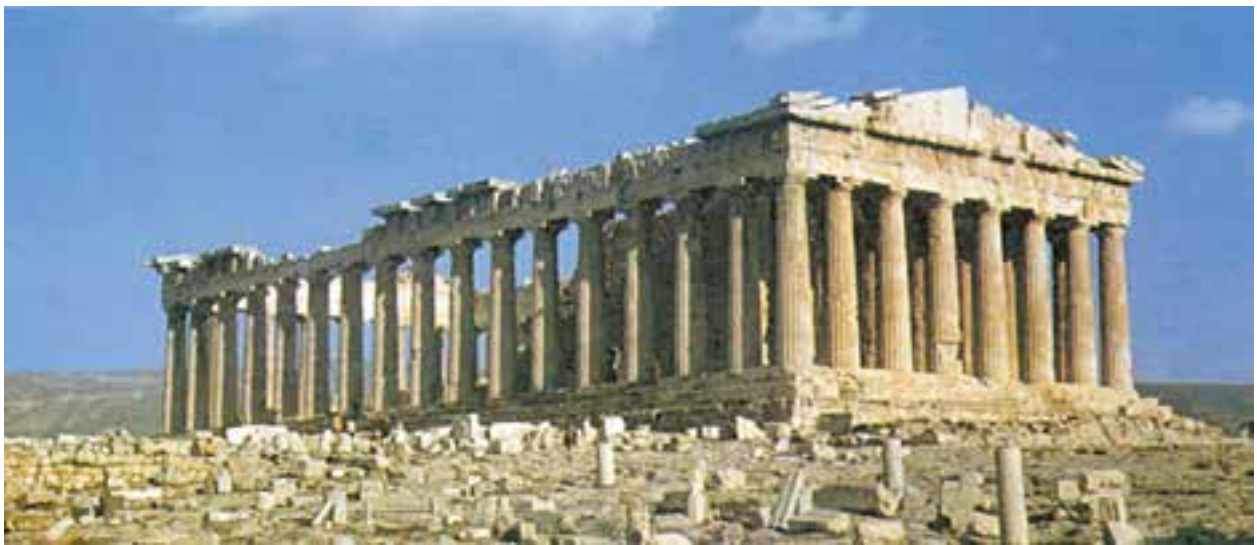
بنای پارتون یکی از آثار تاریخی مشهور که از یونان باستان به جامانده است.

رشد و رونق به سزایی یافت. یونانیان اغلب ساختمان‌های خود را از چوب و آجر می‌ساختند، بعدها برای بنای معابد بزرگ و کاخ‌ها از سنگ استفاده کردند. موسیقی و تئاتر نیز در میان یونانیان رواج زیادی داشت. علم و فلسفه: علم و فلسفه در یونان باستان پیشرفت زیادی کرد؛ زیرا: