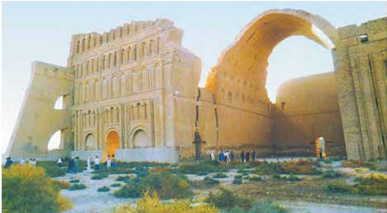
طاق کسری یا ایوان مداین مشهورترین اثر به‌جامانده از عصر ساسانی است که در کشور عراق امروزی قرار دارد. این بنا در فرهنگ و ادبیات ایرانیان به‌عنوان مظهر ناپایداری اوضاع جهان شناخته شده است.

در چنین شرایطی مزدک ظهور کرد. او خود از اشراف بود اما اندیشه‌های تازه‌ای درباره‌ی شیوه‌ی اداره‌ی کشور مطرح کرد؛ از جمله، خواهان توزیع آذوقه در میان مردم قحطی‌زده و کاهش قدرت بزرگان (فرماندهان نظامی، زمینداران و...) بود. قباد، مزدک را وسیله‌ای برای کاهش قدرت بزرگان دید؛ بنابراین، او را به خود نزدیک کرد اما گروهی از بزرگان که وجود مزدک را به زیان خود می‌دیدند با طرح این شعار که مزدک از اصول دین زردشتی منحرف شده است، علیه او و