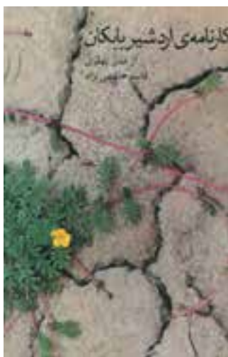
کتابنامه‌ی اردشیر بابکان، کتابی است که سرگذشت اردشیر را بیان می‌کند.

اردشیر بابکان بنیان‌گذار حکومت ساسانیان است. او نزد مورّخانی که در قرن‌های نخستین هجری می‌زیستند، پادشاهی خوش‌نام است. جدّ او، ساسان، موبدی زردشتی بود که ریاست معبد آنها را در پارس به عهده داشت. از این رو، خاندان ساسان در پارس از نفوذ و احترام لازم