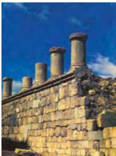
تصویری از معبد آناهیتا در کنگاور

همان گونه که گفته شد، از دوره‌ی اشکانی هم سنگ نوشته و هم پوست نوشته‌ها و نیز نوشته‌هایی بر روی ظروف سفالین باقی مانده که نشان‌دهنده‌ی خطّ رایج در آن زمان است. این نوشته‌ها هم به خطّ یونانی و هم به خطّ پهلوی اشکانی است. منشأ خطّ پهلوی اشکانی، خطّ آرامی بود که توسط دبیران نگاشته می‌شد. ظروف سفالی که به ویژه در نسا در نزدیکی عشق‌آباد کنونی، یافت شده، کمک ارزشمندی به شناخت تاریخ و فرهنگ عصر اشکانی کرده است.