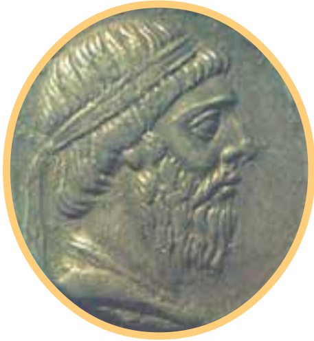
سکه‌ی نقره مربوط به زمان مهرداد اول یکی از پادشاهان معروف اشکانی

از آن پس، پارت‌ها بر متصرفات خود افزودند و به تدریج به سوی غرب پیشروی کردند. تیرداد، برادر و جانشین اشک، در تثبیت حکومت اشکانی نقش زیادی داشت.