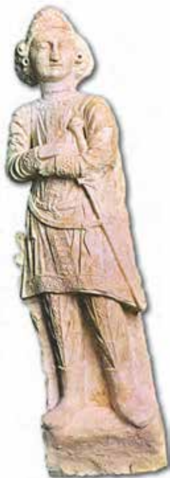
مجسمه‌ای از سنگ آهک مربوط به دوره‌ی اشکانی (قرن دوم میلادی)

از آثار هنری دوره‌ی اشکانی سلاح‌ها، ظرف‌های شیشه‌ای، کوزه‌ها، نقش برجسته‌ها، مجسمه‌های کوچک و هم‌چنین کارهای زیبایی بر روی عاج یافت شده است. در کوه خواجه در سیستان، آثار نقاشی‌های دیواری اشکانی پیدا شده است. به‌علاوه، در خرابه‌هایی چون نسا و دورا نقاشی‌هایی باقی مانده است که یادگار هنر آن عصرند. پژوهشگران با بررسی آثار باقی مانده از روم و ایران باستان دریافته‌اند که این دو بر یک‌دیگر تأثیر متقابل داشته‌اند. بدین ترتیب، روابط ایران و روم فقط به جنگ‌های دو کشور محدود نمی‌شد و جنبه‌های فرهنگی نیز داشت.