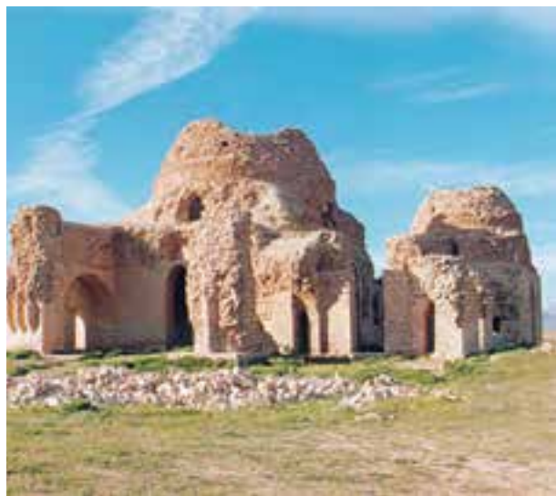
بقایای یک کاخ مربوط به دوره‌ی ساسانیان در سروستان فارس

برپا کرد و به جنگ رومیان رفت؛ زیرا دولت روم که خبر سقوط اشکانیان را شنیده بود، فرصت را مغتنم شمرده و در امور ارمنستان دخالت می‌کرد. او قصد داشت در آن جا حکومتی دست‌نشانده ایجاد کند. (سرنوشت جنگ ایران و روم در زمان جانشین اردشیر، شاپور اول، روشن شد.)