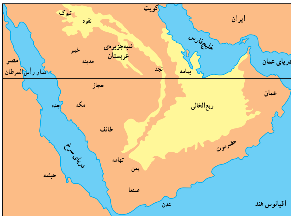
شبه جزیره‌ی عربستان

عربستان بزرگترین شبه جزیره‌ی دنیاست که در جنوب غربی آسیا قرار دارد. اطراف آن را آب‌های خلیج فارس، دریای عمان، اقیانوس هند و دریای سرخ فراگرفته و شمال آن به وسیله‌ی ریگ‌زارهای وسیعی که به عراق و اردن محدود می‌شود، پوشیده شده است.