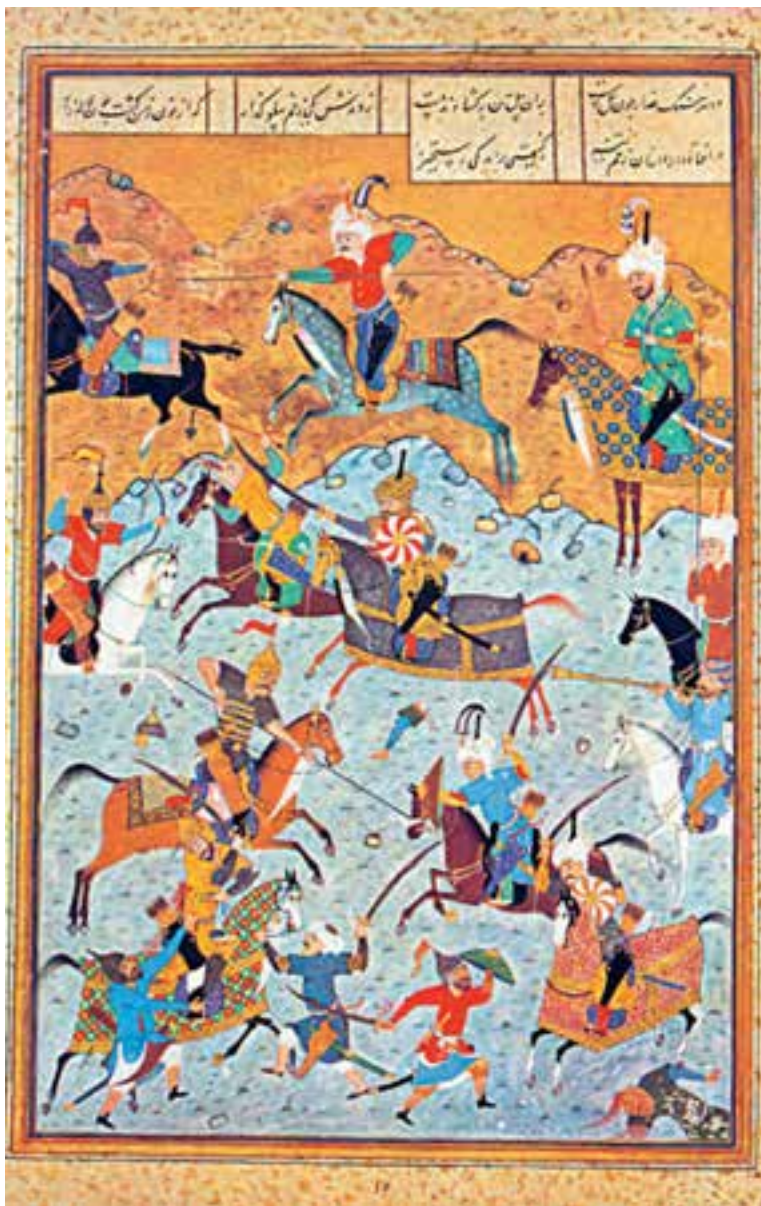
جنگ دارا با اسکندر (مینیا توری از اسکندرنامه‌ی نظامی)

کاست؛ بلکه، برعکس باید گفت دولت جاویدی که در قلمرو داستان سرایی فارسی برای وی به دست آمده، امروز هم چون گذشته پاینده و شکوهمند مانده است. زندگی این سخن سرای بزرگ سرانجام در تنهایی و گوشه نشینی، به سال ۶۰۸ ه.ق. به سر آمد و او را در شهر گنجه به خاک سپردند. نمونه‌هایی از شعر او را می‌آوریم.