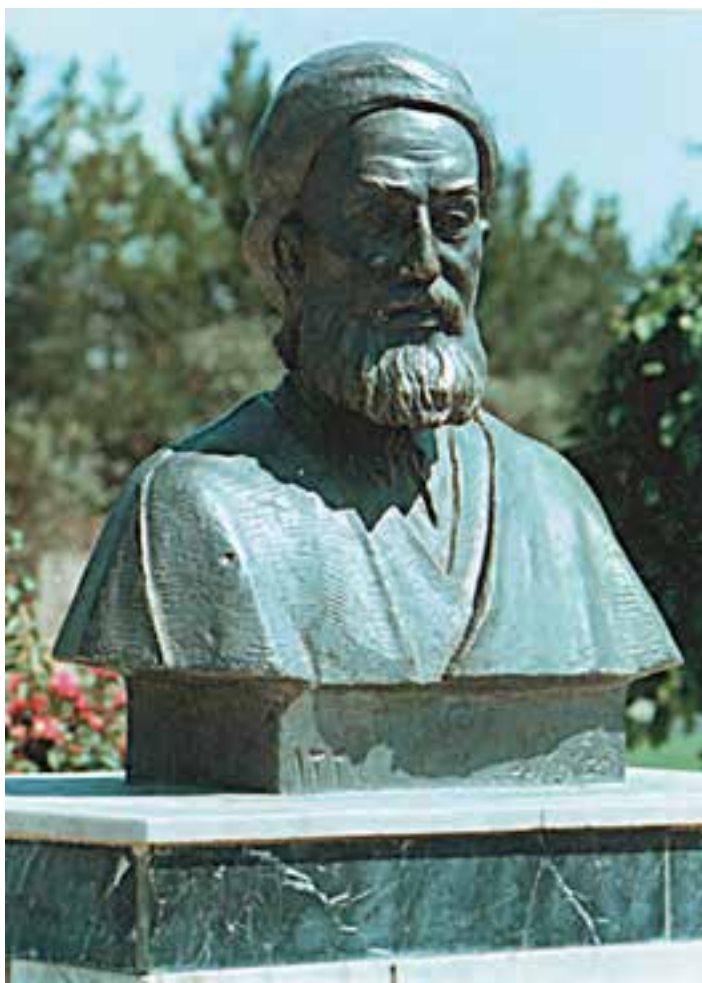
نیم تنه‌ای از خیام نیشابوری

قالب ترانه را خیام ابداع نکرده است اما اگر بگوییم که نام بردارترین ترانه‌ها در ادب فارسی به نام او ثبت شده است، گزافه نگفته‌ایم. تعداد ترانه‌هایی که واقعاً از خیام است نباید چندان زیاد باشد اما بعد از خیام، در مجموعه‌ها و کتاب‌ها، مقدار زیادی رباعی به او نسبت داده شده که بسیاری از آن‌ها قطعاً از شاعر دردمند و کم‌سخن نیشابور نیست. گویی هر کس حرفی اعتراض‌آمیز و تردید برانگیز و غیر قابل تحمل داشته که خود جرئت پذیرفتن عواقب آن را نداشته است، آن را به خیام نسبت داده است. تذکره‌نویسان و شعردوستان هم هر جا چنین ترانه‌هایی را یافته‌اند، بی‌آن که نام سراینده‌گان آن‌ها را بدانند، آن‌ها را به نام خیام ثبت کرده‌اند. رباعیات خیام از دیرباز به زبان‌های خارجی ترجمه شده و او را در ادبیات مغرب‌زمین،