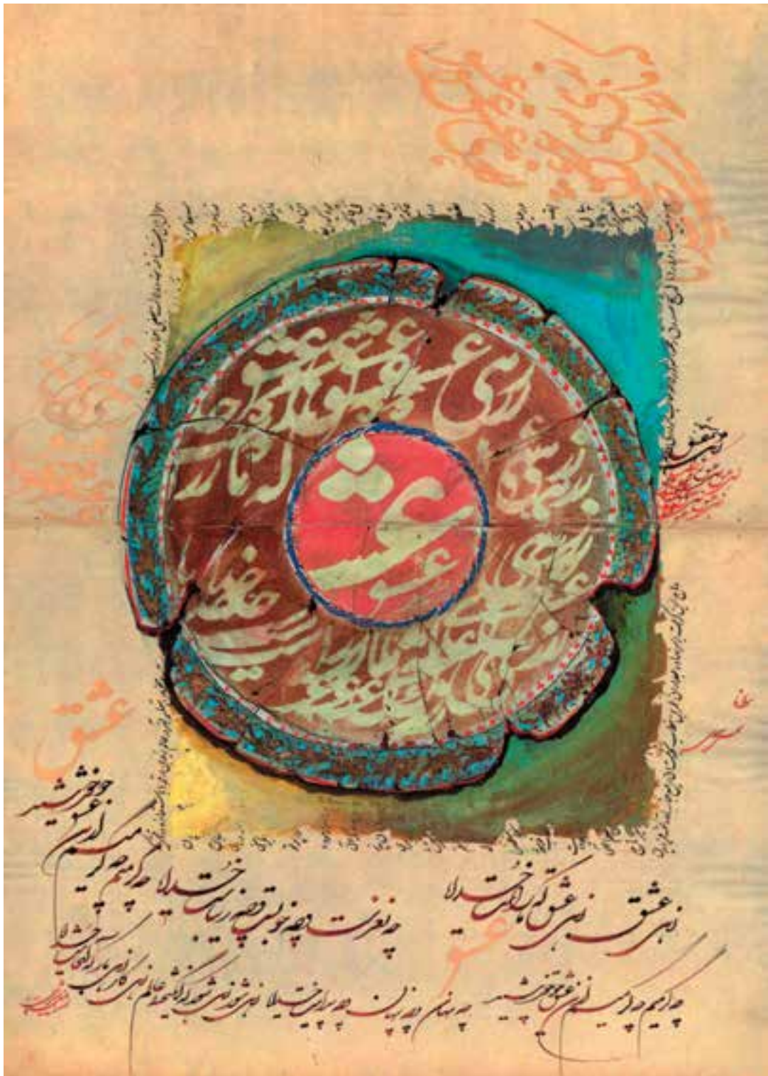
نقاشی خط اثر اسرافیل شیرچی