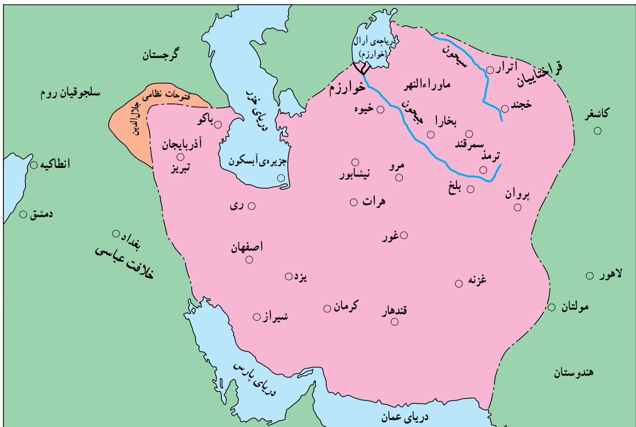
قلمرو خوارزمشاهیان (سلطان محمد خوارزمشاه)

سلطان محمد خوارزمشاه، فرزند و جانشین تکش، راه پدر را در گسترش قلمرو و تثبیت حکومت خوارزمشاهی