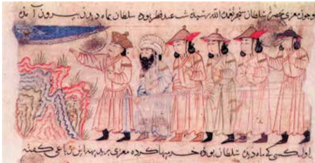
سلطان سنجر و معزی (شاعر) در حال رؤیت ماه در شب عید فطر. این تصویر در زمان حکومت مغولان نقاشی شده است. به این سبک نقاشی «سبک مغول» گفته می‌شود.

تابع خود کردند. ملک‌شاه سلجوقی اداره‌ی خوارزم را به یکی از درباریان خویش به نام انوشتکین واگذار کرد. انوشتکین و پسرش قطب‌الدین محمد - که بعد از او به حکومت خوارزم منصوب شد - در امور داخلی با استقلال رفتار می‌کردند اما هم‌چنان خود را تابع حکومت سلجوقی می‌دانستند. با بروز هرج و مرج در امپراتوری سلجوقی که با ناکامی‌های سنجر در مرزهای شرقی به اوج خود رسید، حکومت خوارزمشاهی که اکنون آتسز، نوه‌ی انوشتکین، در رأس آن بود، در مسیر استقلال کامل و حتی ادعای جانشینی سلجوقیان گام نهاد. سنجر توانست چند بار او را سرکوب کند اما هربار، پس از بازگشت از خوارزم، آتسز بار دیگر بر آن‌جا مسلط می‌شد.