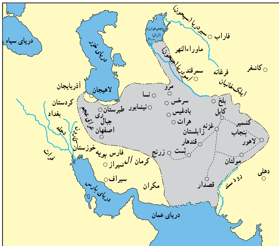
قلمرو غزنویان در زمان سلطان محمود

حملات غزنویان به هند پی آمدهای مختلفی داشت : حکومت غزنوی بود، این زبان به هند نیز راه یافت ؛ سوم نخست آن که موجب شد راه برای گسترش اسلام در آن جا گشوده شود ؛ دوم آن که چون زبان فارسی، زبان رسمی شدن زمینه برای لشکرکشی های بعدی به آن جا شد.