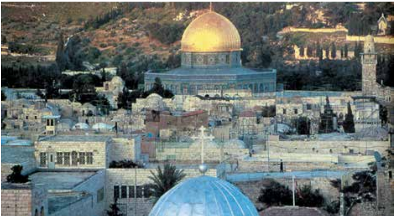
با فرمان پاپ اوربان دوم صلیبی‌ها برای تصرف بیت‌المقدس به حرکت درآمدند.

در سال ۱۰۹۶ م / ۴۹۰ هـ پاپ اوربان دوم ۱ فرمان جنگ علیه مسلمانان را، برای تصرف بیت‌المقدس، صادر کرد. در پی آن جمعیت بزرگی از نواحی غربی و مرکزی اروپا به طرف بیزانس به راه افتادند تا از آن طریق خود را به این شهر کهن برسانند. این عده که اغلب روستاییان و شوالیه‌ها بودند به شکل ارتش بی‌نظم و فاقد یک فرماندهی مشخص در مسیر خود بسیاری از روستاها و مزارع را