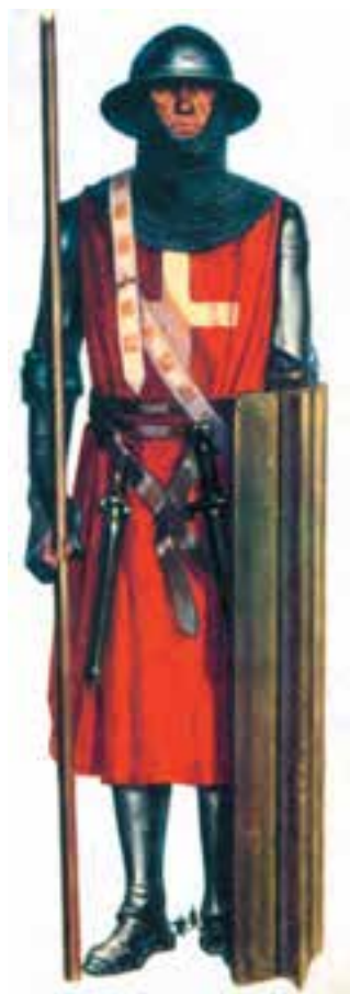
یک جنگ‌جوی صلیبی

۴- نبرد ملازگرد: در چنین شرایطی پیروزی برق‌آسای سلجوقیان بر روم شرقی (بیزانس) در جنگ ملازگرد ۱۰۷۱ م / ۴۶۳ هـ. ق رخ داد. امپراتور بیزانس که قسمت‌های وسیعی از قلمرو خود در آسیای صغیر را از دست داده بود از پاپ علیه مسلمانان کمک خواست و این برای پاپ فرصت مناسبی بود تا کلیسای بیزانس را که از سال ۱۰۵۵ م / ۴۴۷ هـ. ق از کلیسای رم جدا شده بود بار دیگر تحت فرمان خود درآورد. کلیسای بیزانس بر خود نام ارتدوکس ۲ گذاشته بود و کلیسای رم نام کاتولیک ۳ . پاپ به تقاضای کمک امپراتور بیزانس پاسخ مثبت داد و بدین ترتیب جنگ‌های صلیبی آغاز شد.