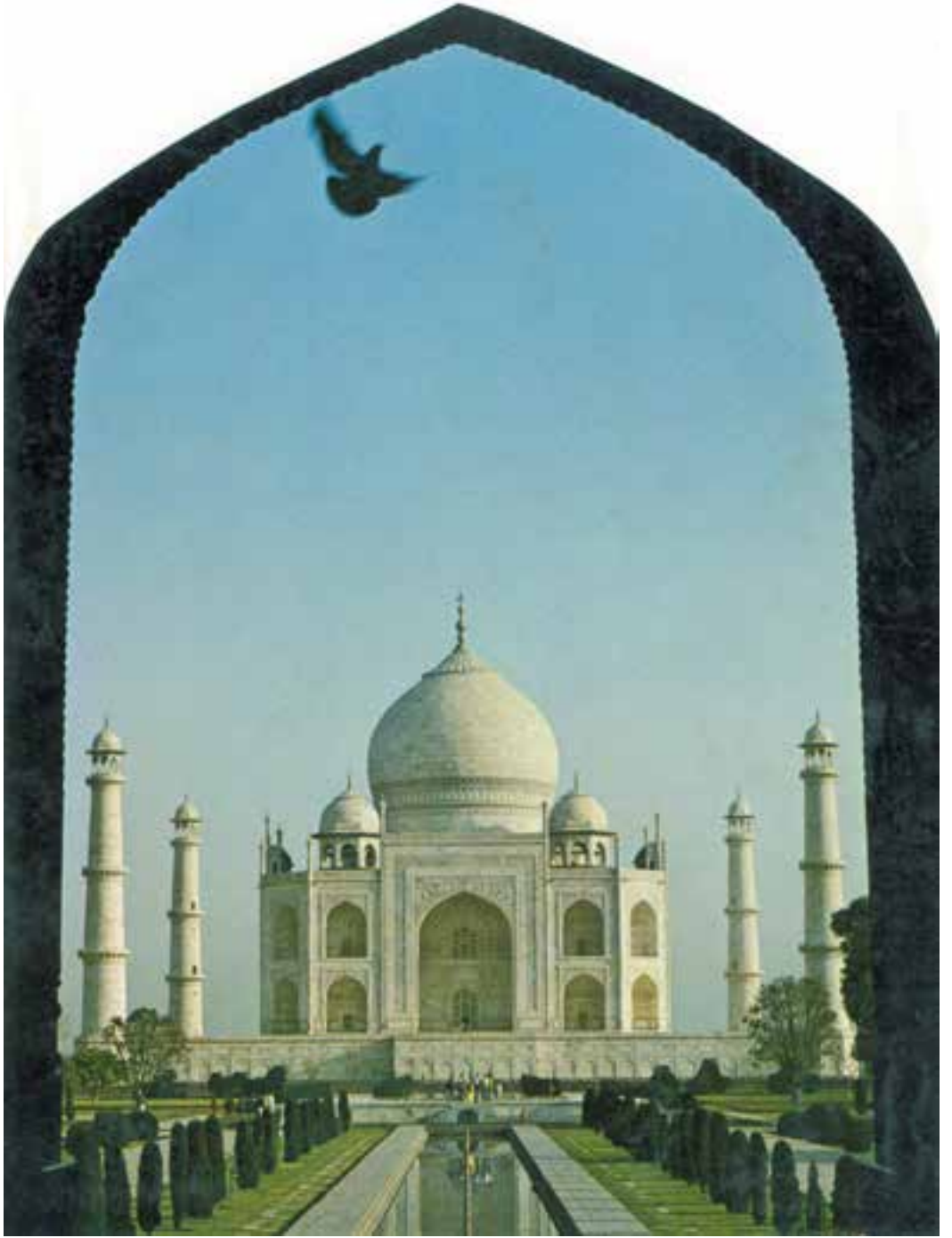
تاج محل — هندوستان