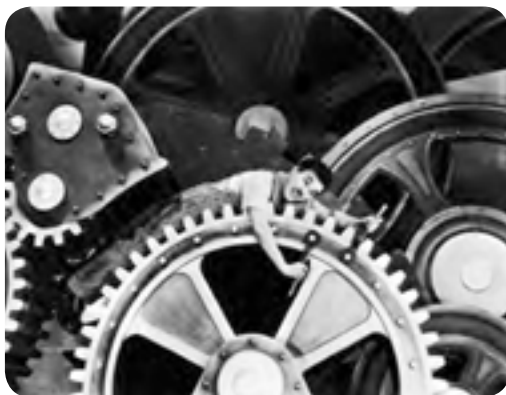
● صحنه‌ای از فیلم عصر جدید چارلی چاپلین

پنجم: زوال عقلانیت ذاتی ؛ منظور از عقلانیت ذاتی، سطحی از عقلانیت است که درباره ارزش‌ها، آرمان‌ها و اهداف زندگی به تأمل می‌پردازد. در جهان متجدد، متافیزیک و علمی که داوری‌های ارزشی می‌کنند از بین می‌روند.