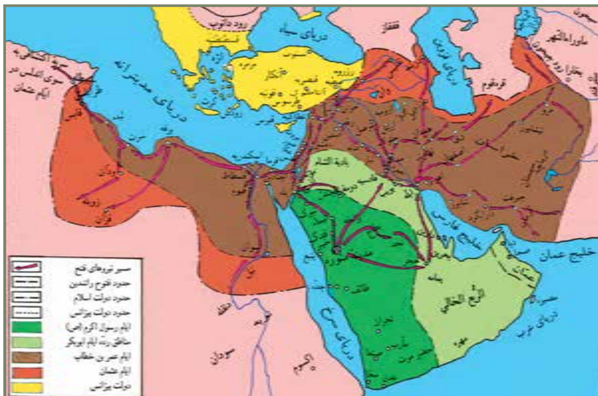
دولت اسلام در عصر پیامبر خدا ﷺ و فتوحات عصر راشدین، مأخذ: اطلس تاریخ اسلام، صادق آئینه‌وند

شدند؛ مشروط بر آنکه شخص خلیفه خود به این شهر بیاید و پیمان صلح را امضا کند. عمر نیز پس از مشورت با اصحاب رسول خدا ﷺ و با تشویق امیر مؤمنان علی علیه السلام در سال شانزدهم یا هفدهم هجری به بیت المقدس رفت و تعهدات متقابلی میان مسلمانان و مسیحیان امضا شد. مسلمانان تعهد کردند افزون بر تأمین مالی و جانی مردم مسیحی، کلیسایی را تخریب نکنند؛ یهودیان را در بیت المقدس ساکن نکنند؛ صلیبی شکسته نشود و اجباری در دینداری نباشد. مسیحیان نیز متعهد شدند مالیاتی همچون مردم مدائن بپردازند؛ در مهاجرت از بیت المقدس یا سکونت در آن شهر مختار باشند و با رومیان همکاری نکنند.