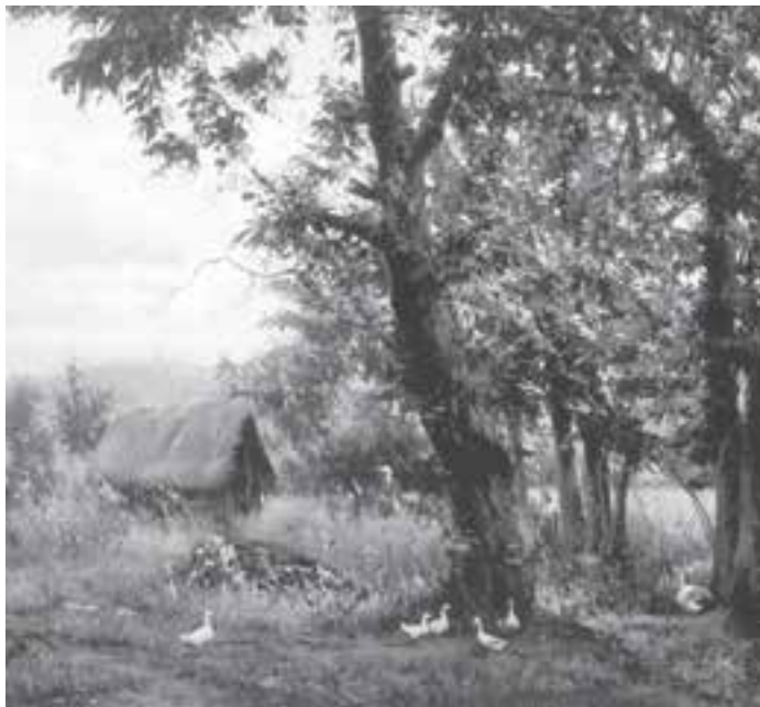
نقاشی آبرنگ اثر: رحیم نوه‌سی