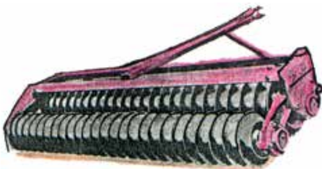
شکل ۵-۴- غلتک پره‌ای دو ردیفه