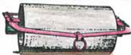
شکل ۵-۳- غلتک معمولی صاف

پره غلتک داخل شیار قرار می گیرد که ضمن فشردن داخل شیارها