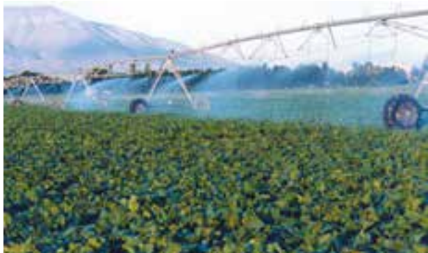
شکل ۶-۶- آبیاری بارانی قرقره‌ای