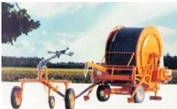
شکل ۷-۶- آبیاری بارانی دوار مرکزی (سنترپیوت)