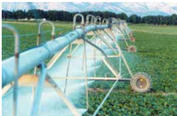
شکل ۸-۶- آبیاری بارانی خطی