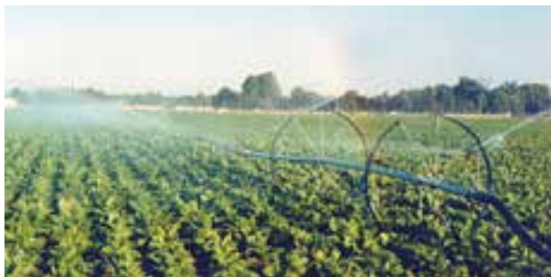
شکل ۵-۶- آبیاری بارانی ویل موو