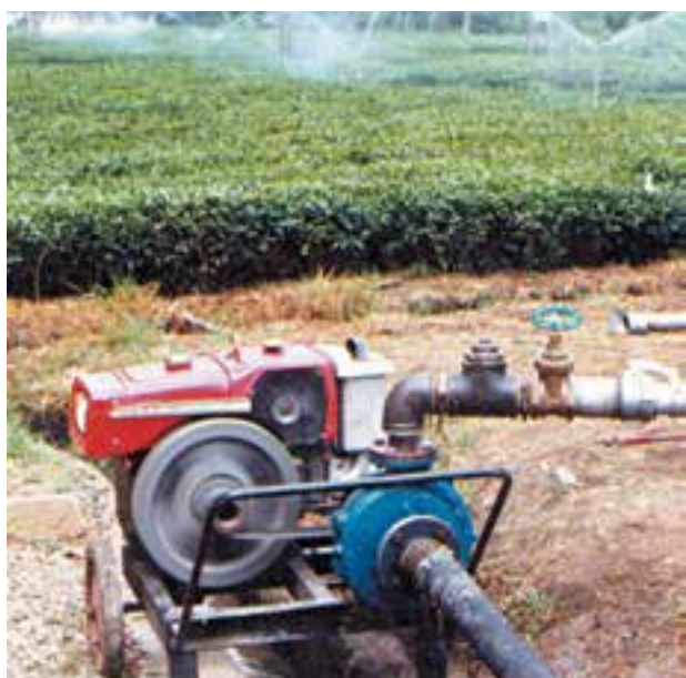
شکل ۴-۶- آبیاری بارانی با سیستم ثابت