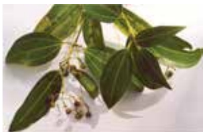
برگ و گل دارچین

گیاهان دارویی، تدخینی، ادویه ای: گیاهانی از تیره های مختلف هستند که به منظور استفاده از برخی مواد و ترکیبات آن ها در تهیه دارو، دخانیات یا استفاده از عطر و رنگ و طعم آن ها به عنوان ادویه کشت می شوند، مانند: توتون، خشخاش، خردل، زعفران، دارچین، زردچوبه، هل، گاوزبان، سنبل الطیب و غیره (شکل ۷-۲).