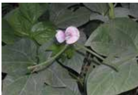
لوبیا چشم بلبلی

حبوبات : گیاهانی از تیره نخود هستند که به منظور تولید دانه کشت می شوند. این نوع گیاهان از نظر پروتئین غنی بوده و به مصرف تغذیه‌ی انسان و دام می‌رسند گونه‌های آن عبارتند از : نخود، لوبیا، ماش، عدس، باقلا، بادام زمینی، سویا، لوبیا چشم بلبلی، نخود فرنگی و... (شکل ۲-۲).