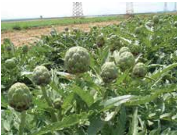
شکل ۹-۲- کنگر فرنگی