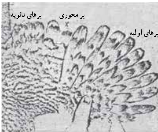
شکل ۳-۴- نمایش انواع پر در بال طیور

— رنگ مرکب : در بعضی نژادها، روی پر، دو یا چند رنگ ساده وجود دارد که به اشکال مختلف پهلوئی یکدیگر قرار گرفته‌اند و رنگ مشخصی را در طیور نشان می‌دهند ؛ مانند : رنگ راه‌راه، نقطه‌ای، موازی و ... (شکل ۳-۳).