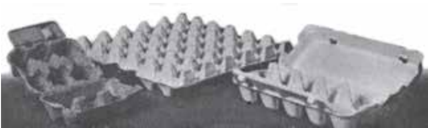
شکل ۴-۱۱- نمونه‌هایی از شان‌های حمل تخم مرغ

برای این که، جعبه و کارتن‌های مخصوص حمل تخم مرغ اغلب دارای قالب استاندارد هستند و قرار دادن تخم مرغ‌های زیاد درشت در آن‌ها سبب به هم خوردن یکنواختی و در نتیجه شکستن تخم مرغ می‌شود.