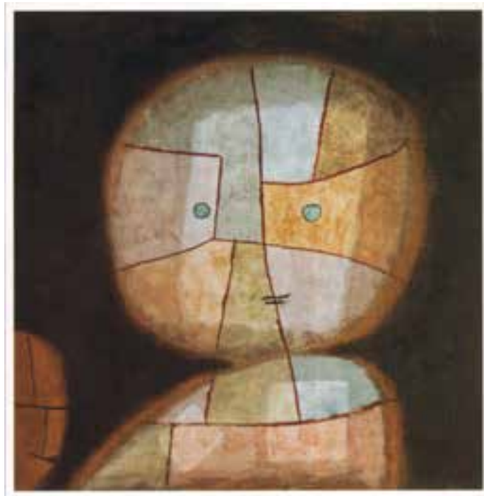
شکل ۱-۳- موانع خلاقیت

همان‌طور که در مورد عوامل مؤثر بر خلاقیت گفتیم موانع نیز می‌توانند درونی یا بیرونی باشند (شکل ۱-۳).