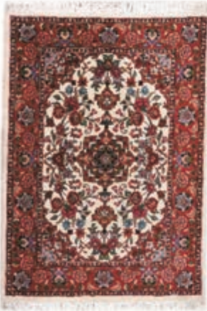
نام طرح: فرش افشار نام نقشه: شکارگاه ابعاد: ۲.۵×۳.۵ ۲×۳ ۱.۷۰×۴۰ بافت: تکاب