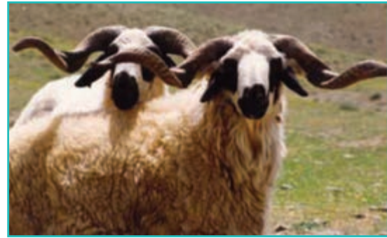
شکل ۴۷-۵- پرورش دام