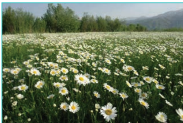
شکل ۵۰-۵- دشت‌های پرگل