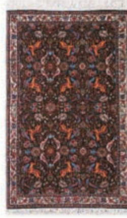
نام طرح: فرش افشار نام نقشه: شکارگاه ابعاد: ۲.۵×۳.۵ ۲×۳ ۱.۷۰×۲.۴۰ بافت: تکاب