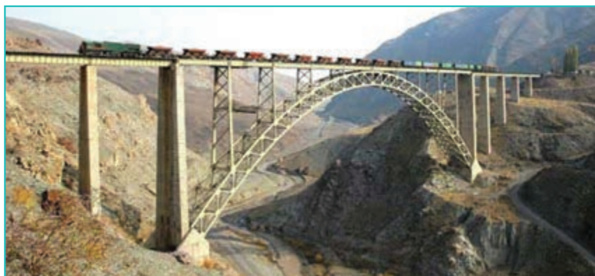
شکل ۶۴-۵- پل هوایی قطور- خوی