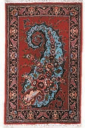
نام طرح: فرش افشار نام نقشه: بته چقه ابعاد: ۳×۴ ۳×۳ بافت: شاهین دژ و بوکان