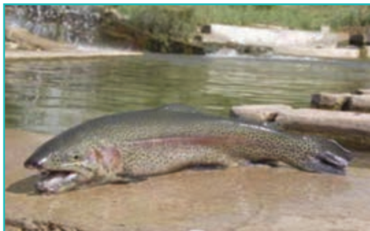
شکل ۴۹-۵- پرورش ماهی