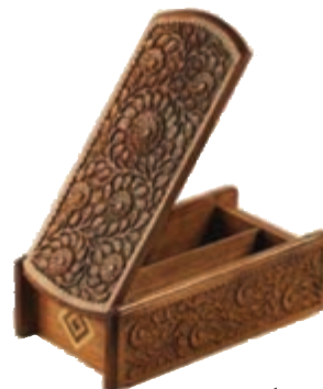
شکل ۵۹-۵- ریزه‌کاری

۲- ریزه‌کاری: هنری بسیار ظریف، زیبا و کاربر است. در این هنر چوب‌هایی بر اساس طرح و نقش از قبل آماده می‌شود و بر قسمت خالی شده چوب روکش می‌شود. ارومیه مرکز اصلی این هنر است. عمده‌ترین تولیدات این صنعت رحل قرآن، جعبه جواهرات، جعبه دستمال کاغذی، قاب عکس، صفحه شطرنج و... است.