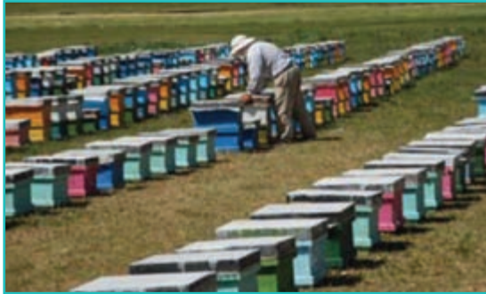
شکل ۴۶-۵- پرورش زنبورعسل