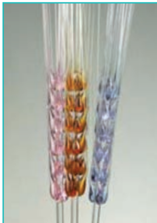
شکل ۵-۶۲- شیشه‌گری

۴- معرق چوب: این هنر ۴۰ سال پیش به شهرستان ارومیه راه پیدا کرد و با منبت تلفیق شد و رشته جدیدی به نام معرق - منبت یا معرق برجسته بوجود آمد.