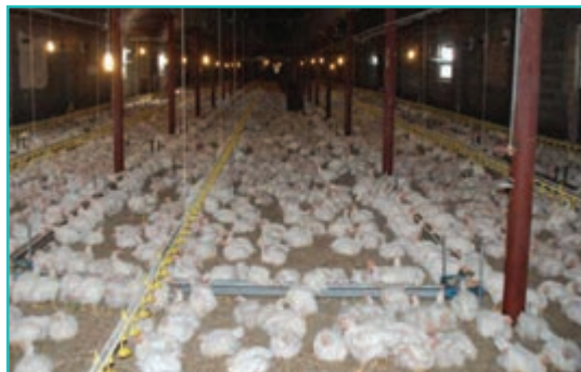
شکل ۴۸-۵- مرغداری صنعتی