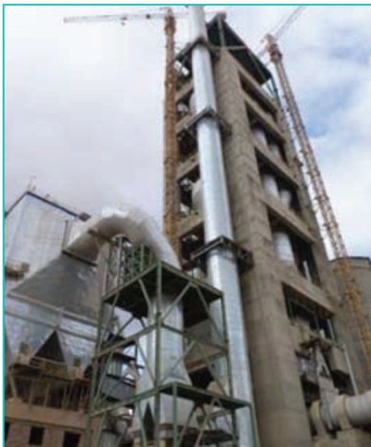
شکل ۵۱-۵- کارخانه سیمان

صنایع تولید مواد غذایی و آشامیدنی پس از صنایع فرآوری و تبدیلی معدنی دومین تخصص صنعتی استان در سال ۱۳۸۵ بود و ۲۱/۶ درصد از کل صنایع استان را شامل می‌شد.