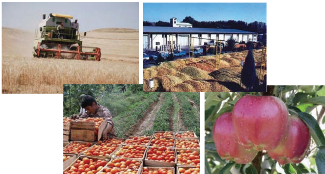
شکل ۴۱-۵- توانمندی های کشاورزی استان

به تصاویر زیر نگاه کنید. به نظر شما مهم ترین توانمندی اقتصادی استان ما چیست؟