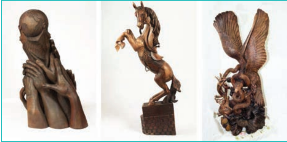
شکل ۵-۶- پیکره تراشی

۳- پیکره تراشی: این هنر به طور گسترده در شهرستان ارومیه کار می‌شود. ماده اصلی پیکره‌ها چوب گردو است.