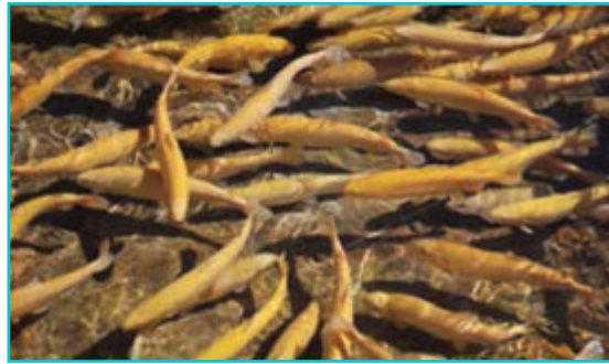
شکل ۴۵-۵- پرورش ماهی