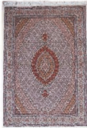
نام طرح: ماهی نام نقشه: شکارگاه ابعاد: ۱.۵×۲ ۲×۳ ۱×۱.۵ ۲.۵×۳.۵ ۲.۵×۵ ۶×۴ بافت: ارومیه - خوی - سلماس - ماکو - چالدران - پلدشت