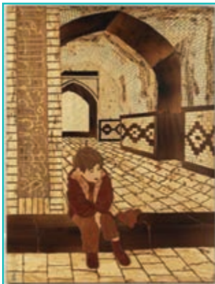
شکل ۵-۶۱- معرق چوب

۴- معرق چوب: این هنر ۴۰ سال پیش به شهرستان ارومیه راه پیدا کرد و با منبت تلفیق شد و رشته جدیدی به نام معرق - منبت یا معرق برجسته بوجود آمد.