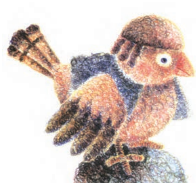
تصویر ۲- د) تصویرسازی با استفاده از مداد رنگی به شیوه تلفیقی و ایجاد بافت جدید، اثر محسن حسن پور