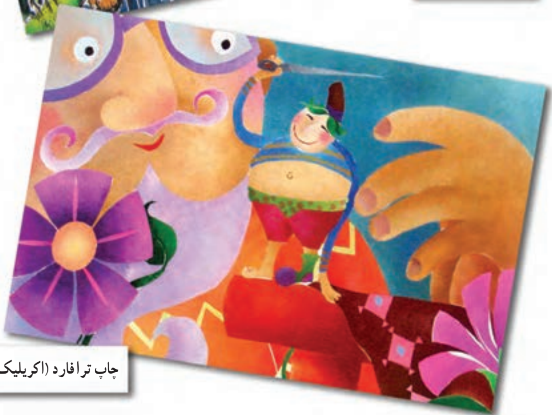
چاپ ترافارد (اکریلیک)