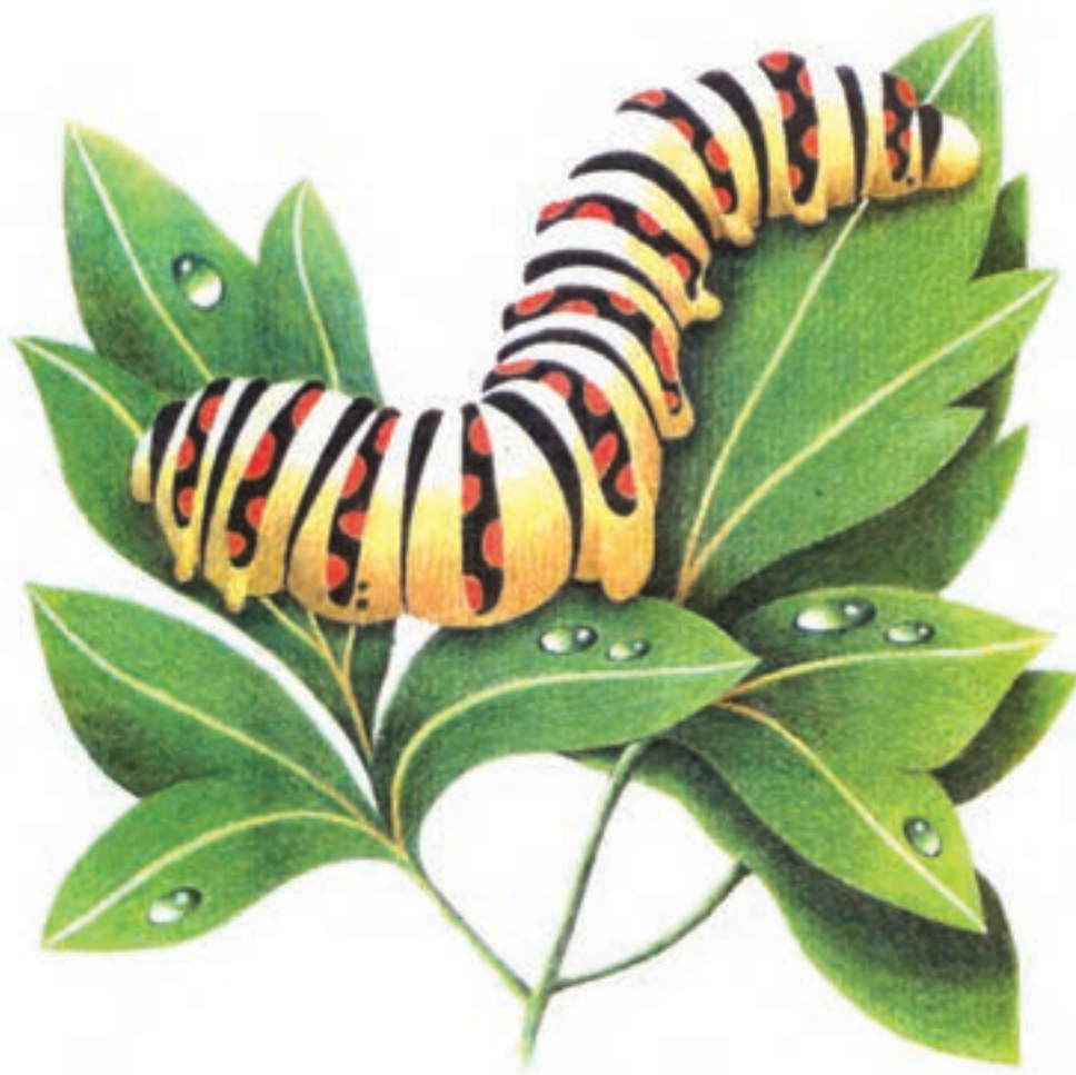
تصویر ۲- الف) تصویرسازی با استفاده از مدادرنگی شیوه سایشی یا محو کردن رنگ‌ها