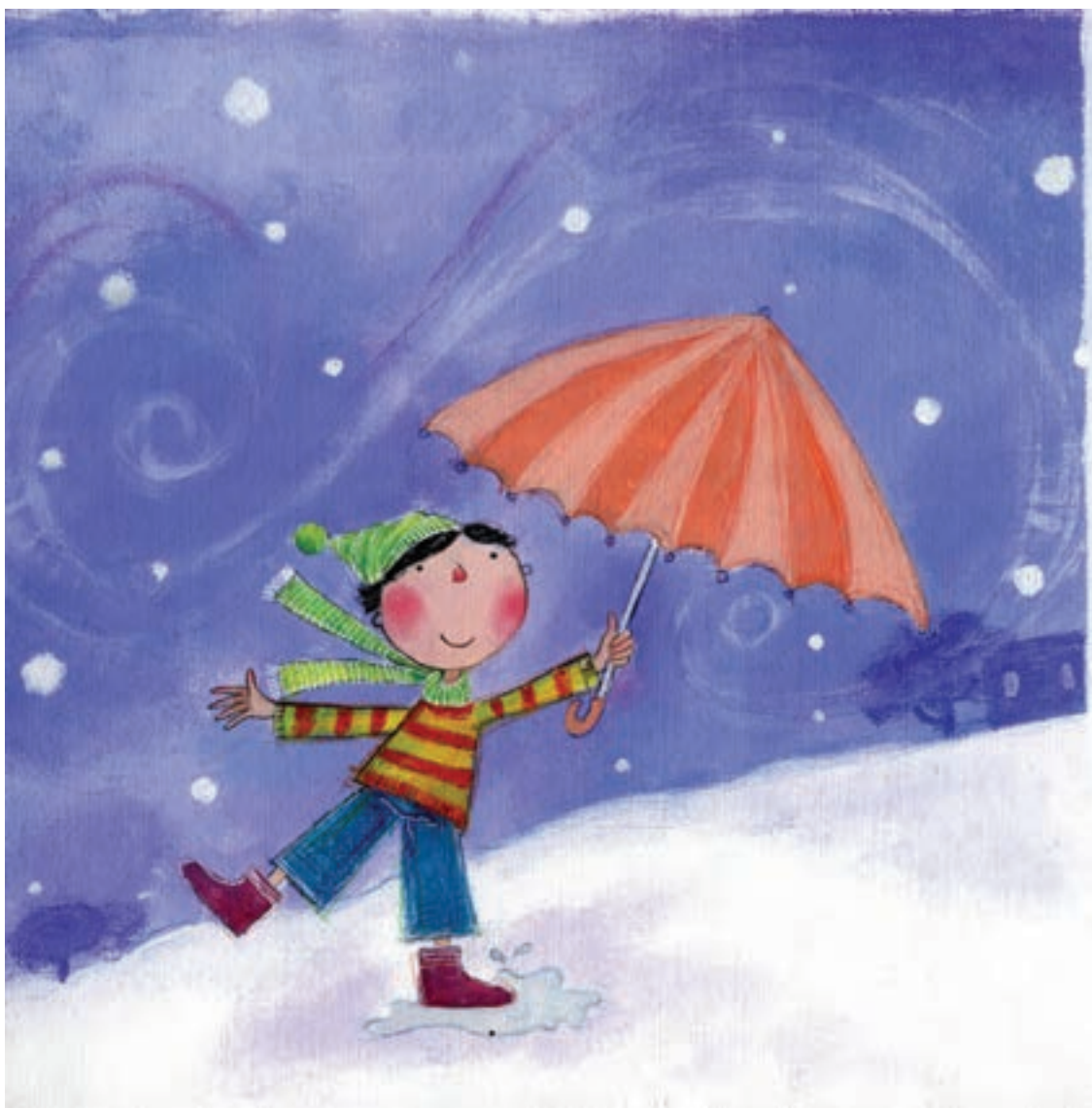
گلناز ثروتیان — تصویرسازی