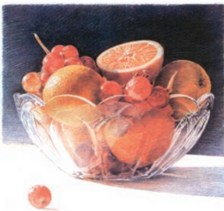
تصویر ۲- ج) تصویرسازی با استفاده از مدادرنگی به شیوه هاشور، اثر لیندا فنیپور