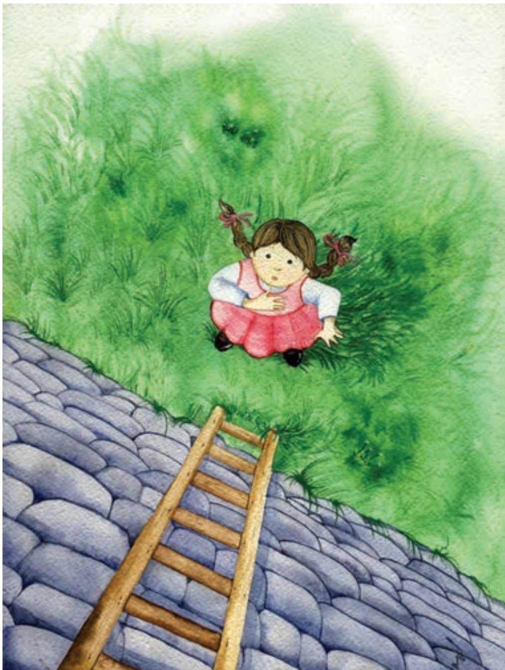
گلناز نروتيان — تصويرسازى