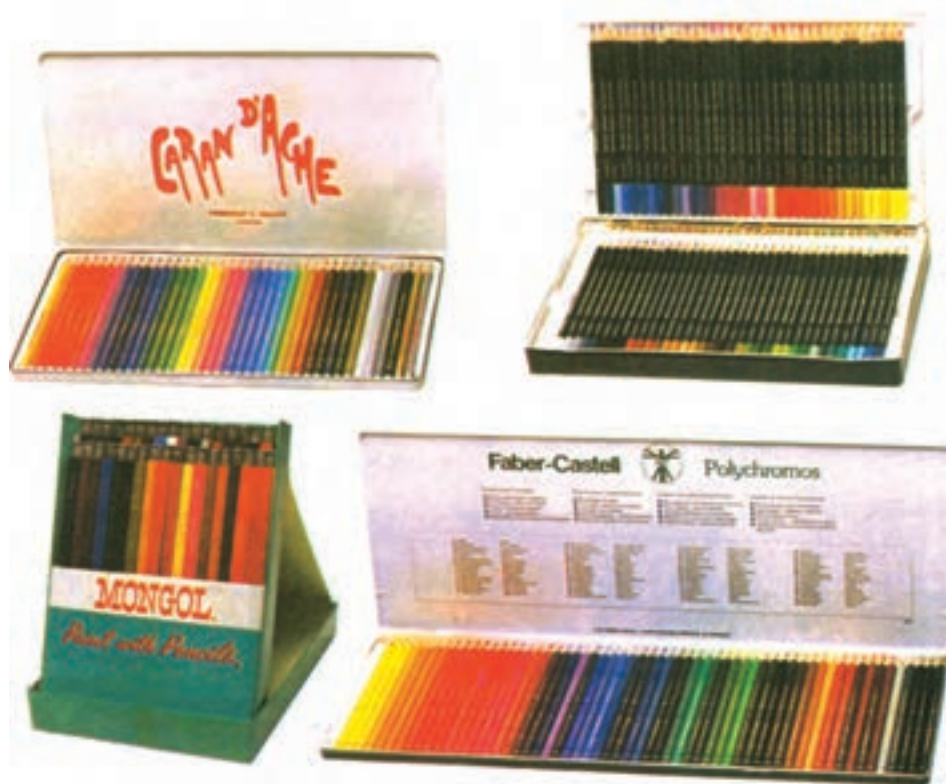
تصویر ۱- انواع مدادرنگی با علائم تجاری مختلف

مدادرنگی از گروه رنگ‌های نیمه شفاف است که به راحتی با یکدیگر مخلوط می‌شوند و می‌توان رنگ‌ها را به صورتی با یکدیگر مخلوط کرد که در عین آنکه هر دو رنگ خاصیت رنگی خود را حفظ می‌نمایند، موجب پیدایش رنگ تازه‌ای نیز بشوند. مغزی مدادرنگی، بخش استوانه‌ای شکل و باریک آن است که از رنگدانه (ماده رنگی) فشرده، نوعی موم و کائولین (یک نوع خاک رس) ترکیب شده است و در بازار با انواع علائم تجاری یافت می‌شود (تصویر ۱). مدادهای طراحی به لحاظ نرمی و سختی دسته‌بندی می‌شوند. مدادهای سخت در سری H، F و HB، مدادهای متوسط در سری HB و مدادهایی با مغز نرم در سری B قرار دارند.