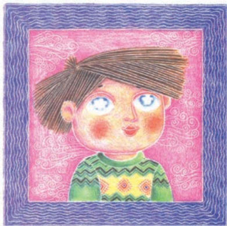
تصویر ۲- ب) تصویرسازی با استفاده از مدادرنگی به شیوه شیپاراندازی، چه کسی خدا را دیده است، اثر شهزاد شوشتریان