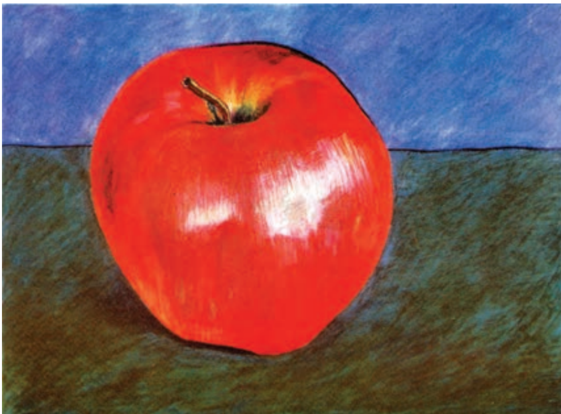
تصویر ۲- ه) تصویرسازی با استفاده از مداد رنگی به شیوه صیقل دادن