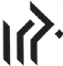
جامعه‌ی مشاوران ایران، طراح: مرتضی ممیز