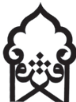
دانشکده‌ی علوم قرآنی طراح: محمدحسین حلیمی