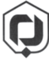
بنیاد مسکن انقلاب اسلامی، طراح: مرتضی ممیز