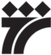
شرکت تهران خیره، طراح: فتح‌الله مرزبان