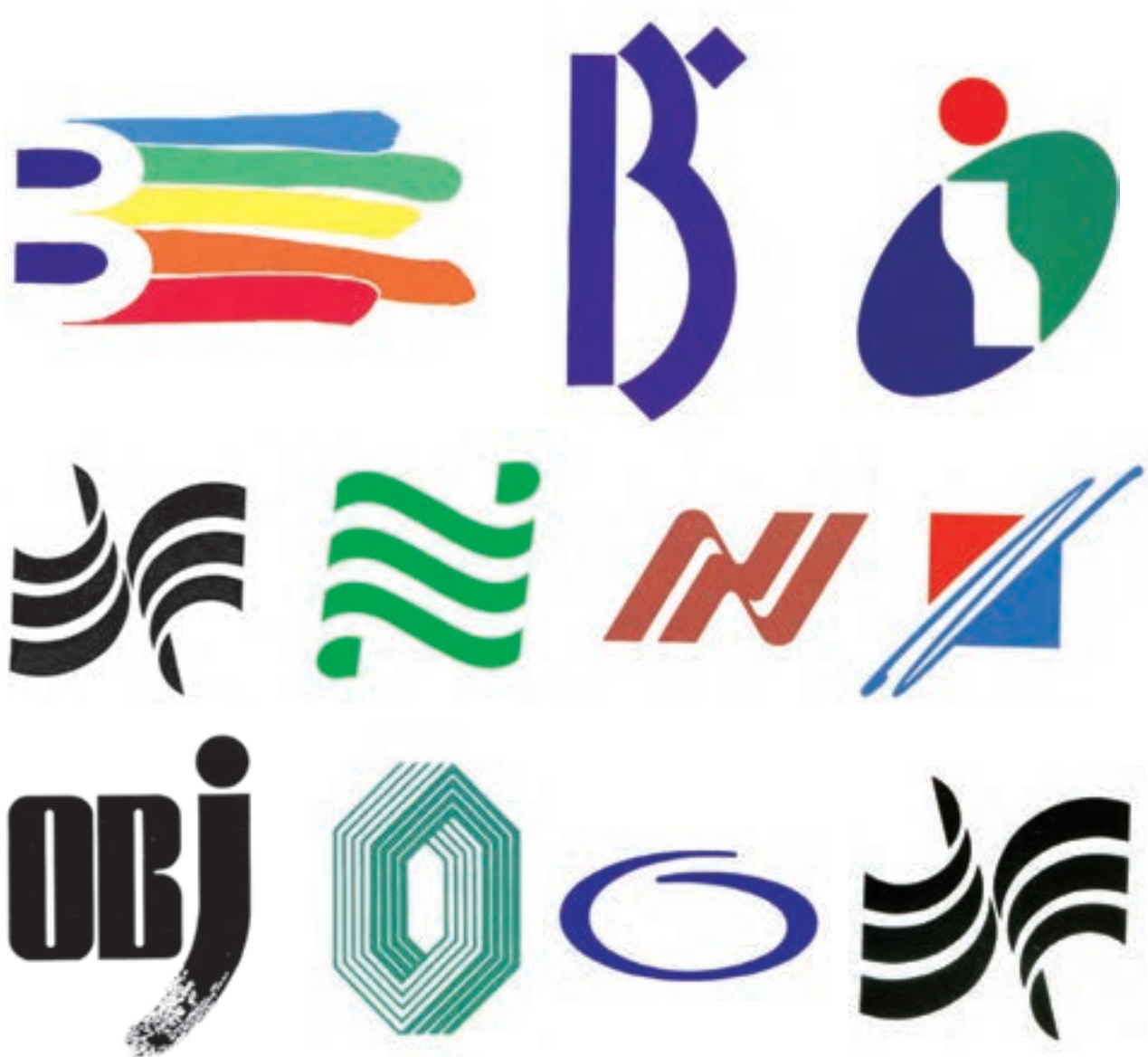
شکل ۴۰-۱-ب- نشانه‌های نوشتاری با استفاده از حروف B، I، N، O.