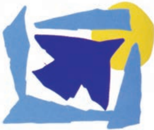
شکل ۱-۵۱- نشان فروشگاه‌های واقع در فرودگاه

با توجه به خصوصیات بارز رنگ‌ها (تضادها، روان‌شناسی رنگ‌ها، مقاطع سنی مخاطبین، شناخت از فرهنگ بومی و سایر خصوصیات رنگ‌ها) طراحان توانسته‌اند از آن به خوبی سود جویند (شکل‌های ۱-۵۱ تا ۱-۵۳).