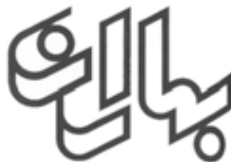
عنوان نشریه‌ی بهاران طراح: حمیدرضا رحمانی