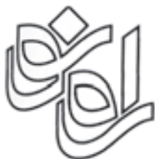
عنوان نشریه‌ی راه نو طراح: حمیدرضا رحمانی