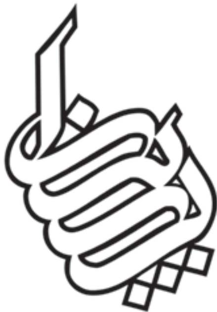
شرکت درب ایران طراح: ایرج میرزا علیخانی