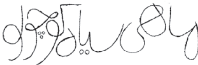
عنوان کتاب ماهی سیاه کوچولو، طراح: فرشید مثقالی