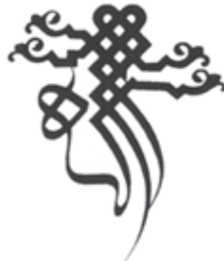
طراحی بسم الله طراح: عبدالرضا چارئی