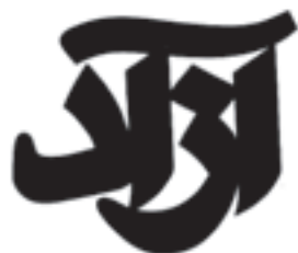
سرفصل برای کتاب طراح: بیژن صیفوری