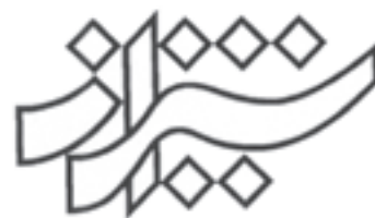
عنوان نشریه‌ی شیراز طراح: حمیدرضا رحمانی