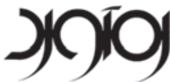
عنوان نشریه‌ی راه آورد طراح: بیژن صیفوری