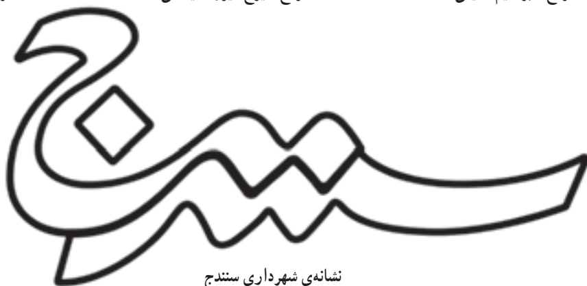
نشانه‌ی شهرداری سنج طراح: حمیدرضا زری