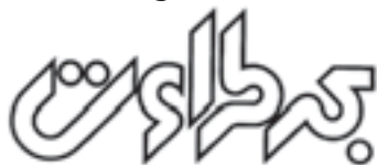
شرکت شیمیایی بحر طراوت، طراح: حمیدرضا رحمانی