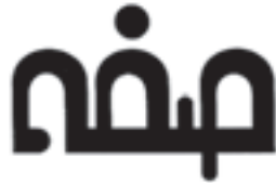
شرکت تولیدی ساختمانی اصفهان طراح: مسعود سپهر و سیما مشتاقی