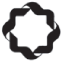
شبکه‌ی چهار صدا و سیما

۱- نشانه‌های نوشتاری حاوی یک یا چند حرف (مونوگرام): به نوعی از نشانه‌های نوشتاری که با استفاده از حرف و یا حروف اول اسم (اعم از خاص و عام) طراحی می‌گردد، «مونوگرام» گویند. این نوع از نشانه‌ها در کشور ما کمتر مرسوم بوده است ولی در کشورهای اروپایی فراوان استفاده می‌شود که شاید به دلیل شکل هندسی حروف لاتین باشد که کاربرد ساده‌تری در شکل دادن به نشانه دارند. البته در دو دهه‌ی اخیر در جامعه‌ی ما نیز طراحان گرافیک با این شیوه توانسته‌اند آثار زیبایی به وجود آورند (شکل ۳۹-۱).