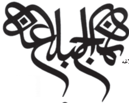
طراحی و خطاطی نشانه‌ی بنیاد نهج البلاغه طراح: محمد احصائی