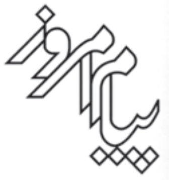
عنوان نشریه‌ی پیام امروز طراح: مرتضی ممیز