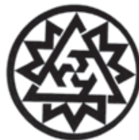
مرکز فرهنگی امیرالمؤمنین طراح: محمدحسین حلیمی