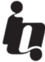
مرکز تجاری و بازرگانی ایران و قطر، طراح: فتح‌الله مرزبان