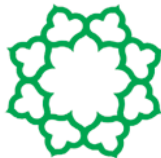
شکل ۱-۵۲- شهرداری تهران، طراح: مرتضی ممیز

در این نشان تصویری، طراح با استفاده از رنگ آبی به خوبی توانسته است نوع خدمات‌رسانی شرکت را بیان کند.