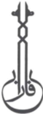
بزرگداشت هزاره‌ی تولد فارابی خوشنویس محمد احصائی — طراح: مرتضی ممیز