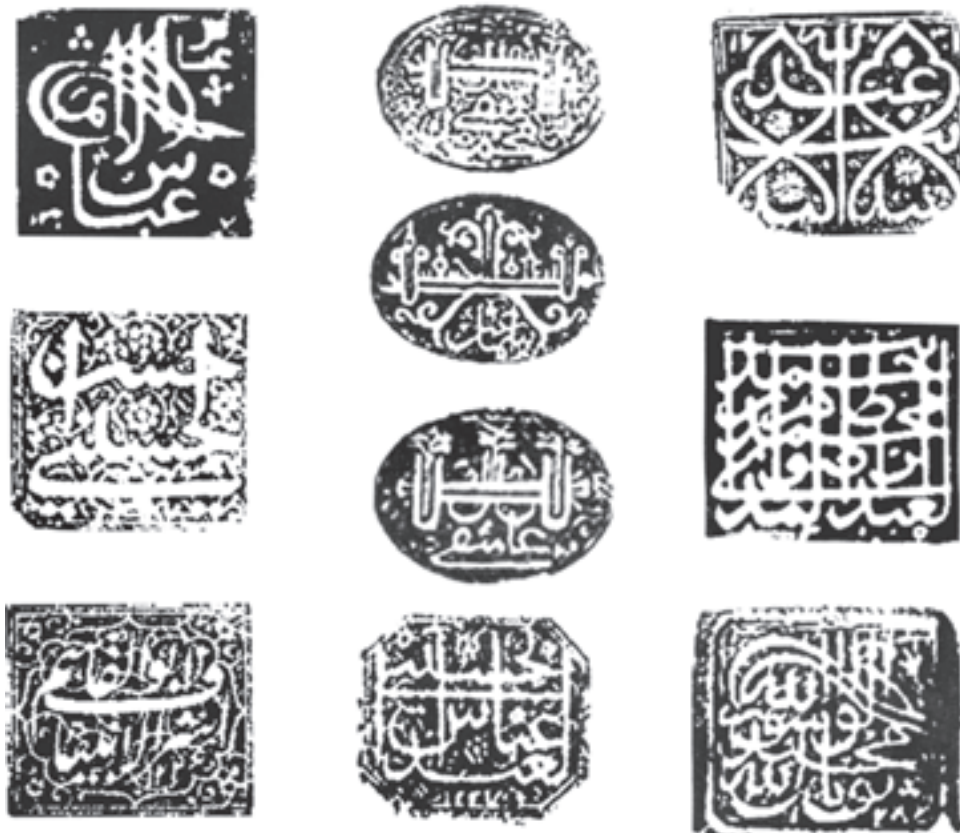
شکل ۱-۴۲- نمونه‌هایی از مهرهای نوشتاری (حک شده بر روی فلز برنج) که به صورت نشانه‌های شخصی با الهام از خطوط سنتی کوفی، ثلث، طغری و نستعلیق طراحی شده‌اند.

۲- نشانه‌های نوشتاری با استفاده از یک یا چند کلمه (لوگوتایپ): به نشانه‌های نوشتاری که با استفاده از اسم (یک یا چند کلمه) کامل طراحی شوند لوگوتایپ گویند. این نوع از نشانه‌ها رابطه‌ای تنگاتنگ با خوشنویسی دارند و در کشور ما از سابقه‌ی طولانی‌تری نسبت به نشانه‌های مونوگرام یا تک‌حرفی برخوردارند (شکل ۱-۴۲). در این نوع از نشانه‌ها هنرمندان ایرانی، عرب و ترک با استفاده از خطوط سنتی کوفی،