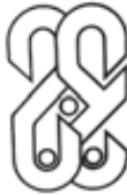
نشانه‌ی طراح، طراح: عبدالرضا چارئی