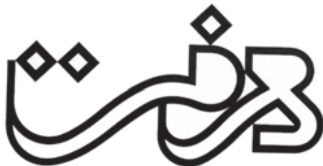
عنوان نشریه‌ی معرفت، طراح: حمیدرضا رحمانی