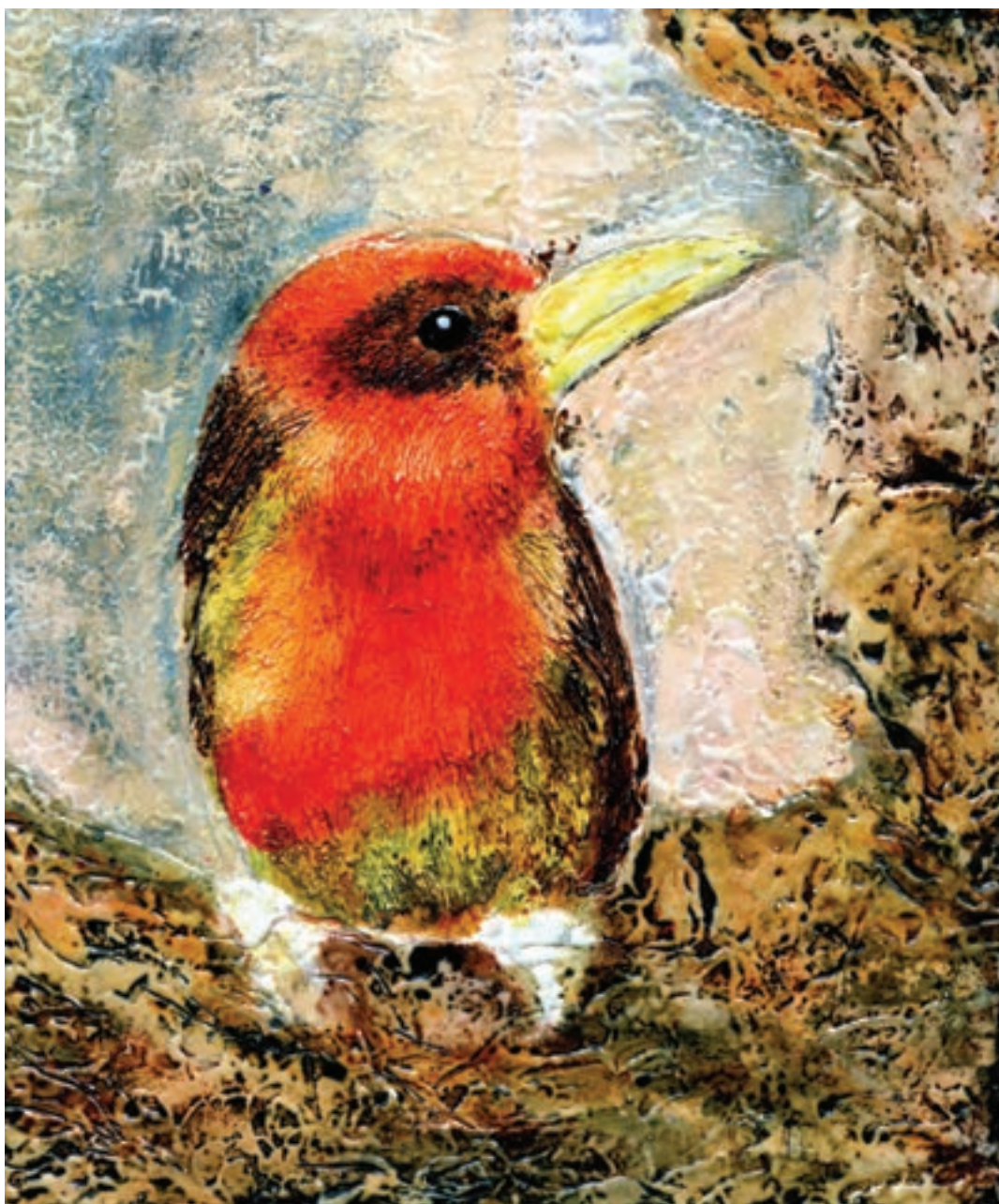
تصویر ۲- تصویری سازی با استفاده از شیوه چسب چوب، اثر شهرزاد شوشتریان. بافت ایجاد شده توسط قلم مو، شانه پلاستیکی و سوزن به وجود آمده و جهت حفظ بافت با سشوار سطح چسب چوب خشک شده است. سپس رنگ آمیزی با استفاده از آبرنگ مایع انجام شده است.