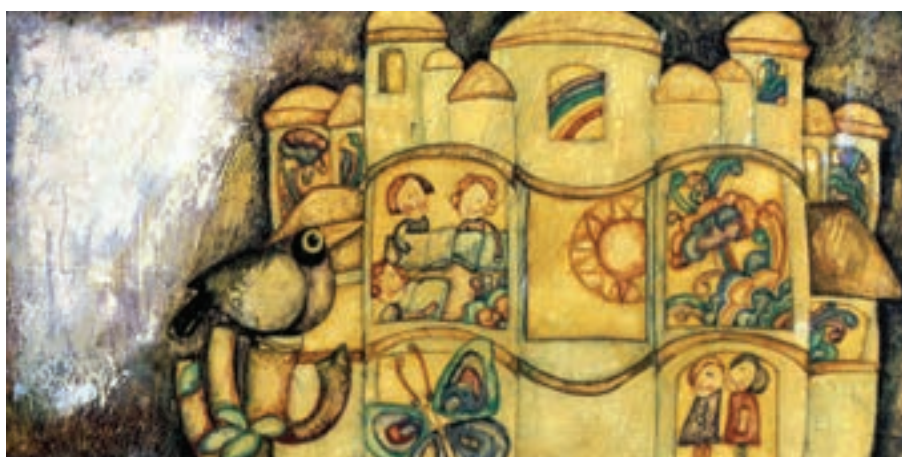
تصویر ۵- تصویرسازی با استفاده از شیوه چسب چوب، کتاب توکا، اثر زنده یاد بهرام خانف