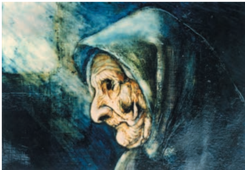
تصویر ۱- تصویرسازی با استفاده از شیوه چسب چوب، اثر دانشجوی گرافیک، ابوالمعمومی، همانگونه که در تصویر مشاهده می کنید شیوه تصویرسازی با استفاده از چسب چوب به شما امکانات بصری و بافت های متفاوت تری نسبت به آنچه تاکنون فراگرفته اید ارائه خواهد کرد.

روش کار : در صورتی که از مقوای سفید و یا کاغذ ضخیم برای کار با چسب چوب استفاده می کنید ابتدا طرح خود را به وسیله مداد بر صفحه طراحی کنید. ولی اگر از فیبر استفاده می کنید بهتر است ابتدا با قلم مو و گواش سفید تمام سطح فیبر را رنگ کنید. سپس طرح را با مداد بر سطح فیبر رنگ آمیزی شده طراحی کنید. بعد از این مرحله، تمام سطح کار را با قلم موی نسبتاً درشت رنگ روغن و یا کاردک نرم به چسب چوب آغشته نمایید، تا سطح کار به صورت یکدست درآید. در این مرحله سعی نمایید تا هیچگونه بافت یا منفذی (روزنه ای) برای عبور رنگ بر سطح کاغذ (یا فیبر) باقی نماند. سپس برای سرعت عمل با استفاده از سشوار و از فاصله ۲۰ سانتی متری سطحی را که چسب زده اید خشک کنید.