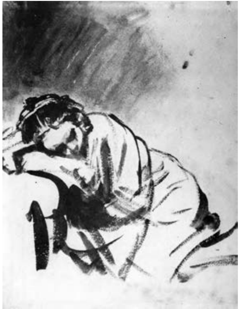
تصویر ۱۱- طراحی با آب‌مِ مرکب و قلم‌مو به شیوه خیس‌درخیس بر روی کاغذ خشک، دختر خفته، اثر رامبراند