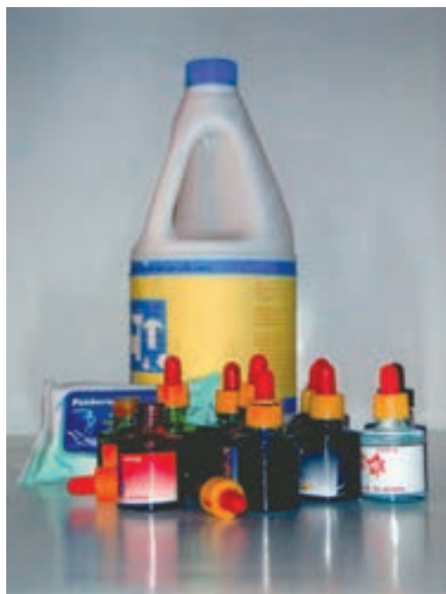
تصویر ۱- وسایل مورد نیاز شیوه آبرنگ مایع (جوهرهای رنگی) و پاک کننده (سفیدکننده) از قبیل مایع پاک کننده، دستمال کاغذی و آبرنگ مایع را نشان می دهد.