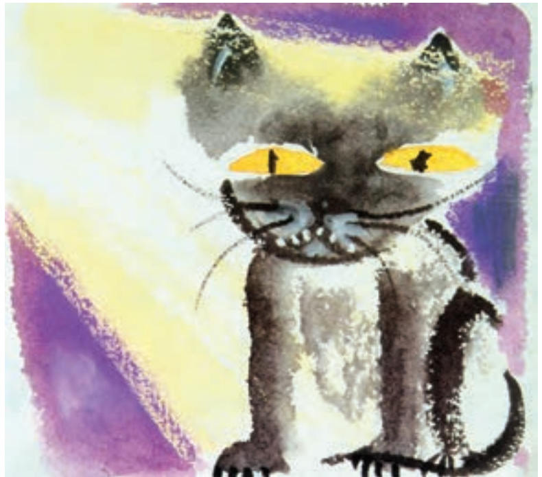
تصویر ۱۲- تصویرسازی به شیوه خیس‌درخیس بر روی کاغذ خشک، در تاریکی، اثر شون ویسایا