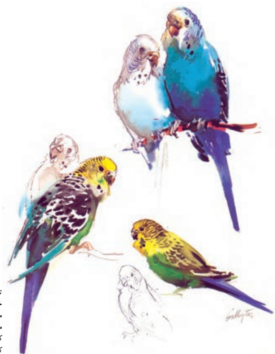
تصویر ۹- نمونه‌ای دیگر از نقاشی به شیوه خیس درخیس بر روی کاغذ خشک را نشان می‌دهد. مشخص بودن نقشه مسیر حرکت می‌تواند در جلوگیری از اشتباه و خطا در هنگام کار به شما کمک کند. در این اثر هنرمند شروع کار را از سر پرنده‌ها آغاز و به دُم آنها ختم کرده است، اثر وی چنس بالستار

با توجه به این که ترکیب رنگ بیشتر بر سطح کاغذ در این روش اتفاق می‌افتد با استفاده از نقشه مسیر حرکت می‌توانید تا حد بسیاری جلوی خطا و اشتباهات احتمالی را بگیرید. شما می‌توانید هنرجویان را در استفاده از ابزار، شیوه مناسب و چگونگی نقشه مسیر حرکت با توجه به موضوعی که برمی‌گزینید یاری کنید (تصویر ۹).