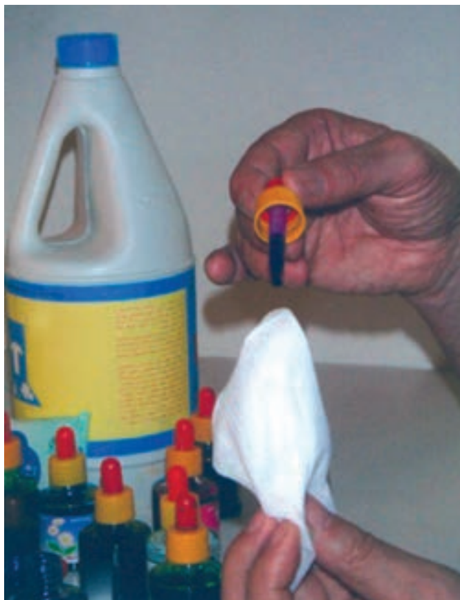
تصویر ۲- مرحله اول شیوه آبرنگ مایع (جوهرهای رنگی) و پاک‌کننده را، که با قطره‌چکان بر دستمال کاغذی مرطوب رنگ می‌چکانیم، نشان می‌دهد.

روش کار : در این شیوه، ابتدا دستمال کاغذی را با آب مرطوب می‌کنیم. سپس با استفاده از قطره چکان آبرنگ مایع، چند قطره از رنگ دلخواه و هماهنگ را، همان گونه که در تصویر مشاهده می‌کنید، بر روی دستمال کاغذی مرطوب که چند تا خورده است می‌چکانیم. با توجه به خیس بودن سطح دستمال، رنگ به راحتی و به صورت اتفاقی بر سطح دستمال پخش می‌شود. با همین شیوه رنگ‌های دیگر را به آن اضافه می‌کنیم. نتیجه حاصله رنگ‌هایی با شکل‌های غیرمنتظره و زیباست (تصاویر ۲ و ۳).