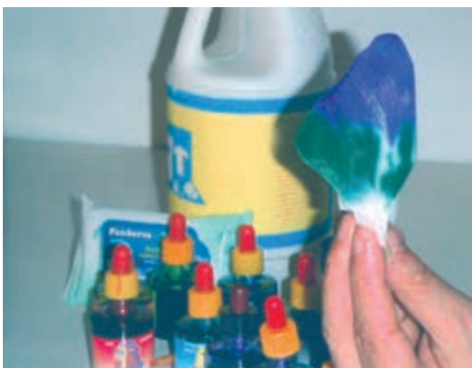
تصویر ۳- مرحله دوم رنگ آمیزی با آبرنگ مایع (جوهرهای رنگی) و پاک‌کننده را نشان می‌دهد.