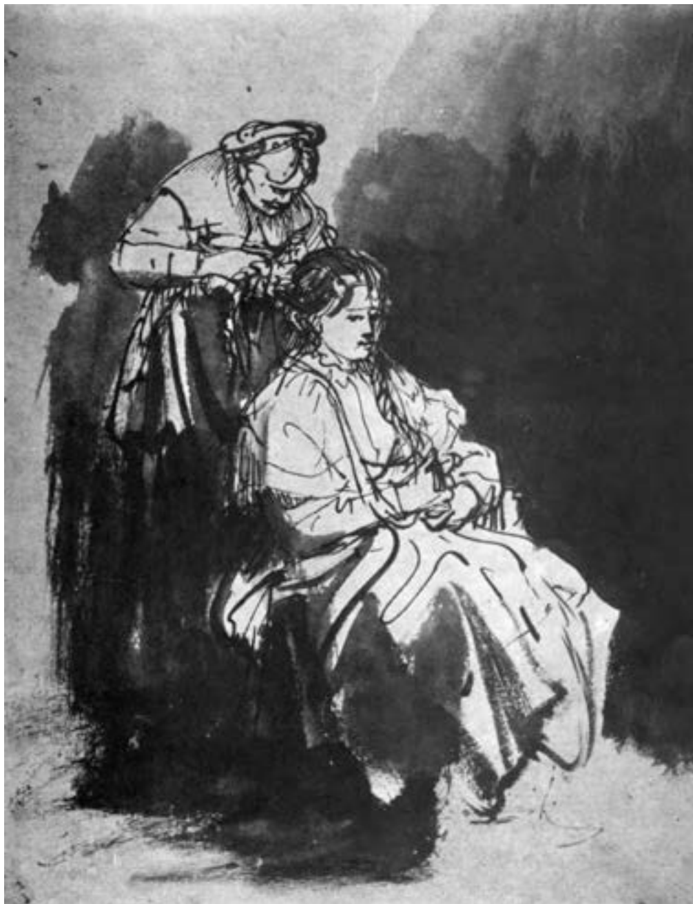
تصویر ۱۰ — طراحی با آب‌مرکب و قلم‌مو به شیوه خیس در خیس بر روی کاغذ خشک، اثر رامبراند

توصیه می‌شود برای کسب مهارت کافی ابتدا تمرین‌هایی را با استفاده از آب مرکب و قلم‌مو و یا تک‌رنگ با آبرنگ انجام دهید و پس از کسب مهارت با ترکیبات رنگی مختلف کار خود را آغاز کنید. هنرمندانی چون رامبراند از این شیوه، با استفاده از آب مرکب، آثار ارزشمندی از خود به یادگار گذاشته‌اند و بسیاری از پیش‌طرح‌ها و طرح‌های سریع برای تابلوهای نقاشی خود را به این روش طراحی کرده‌اند (البته هنرجویان عزیز با این روش در کلاس طراحی آشنا گردیده‌اند و تمرین‌های کافی انجام داده‌اند) (تصاویر ۱۰ تا ۱۲).