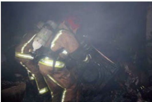
شکل ۱-۵- آتش‌نشانان در حال بررسی سانحه آتش‌سوزی با دستگاه

دستگاه‌های تنفسی: ساخت و به‌کارگیری دستگاه‌های تنفسی، دگرگونی در مسیر مبارزه