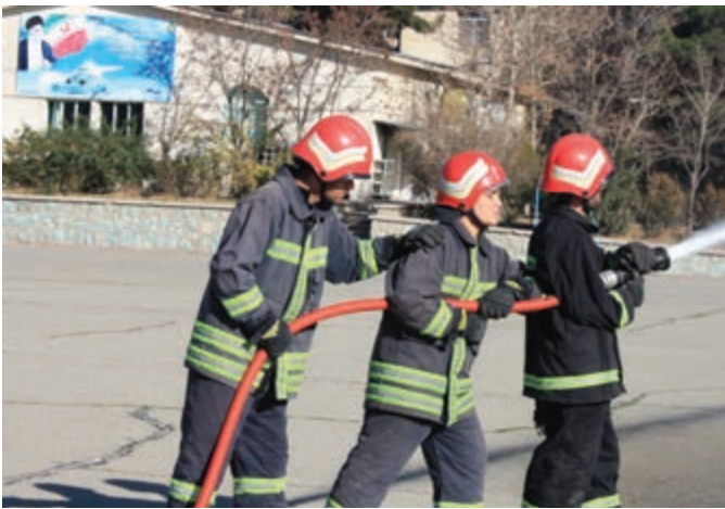
شکل ۵-۴- نحوه گرفتن نازل و لوله حریق

یک روش دیگر برای نگه داشتن لوله، استفاده از دست راست به صورت پشتیبان بر روی بازوی چپ است، به طوری که لوله در انحنا داخلی آرنج قرار گیرد و نفر دیگر به صورت پشتیبان عمل نماید و همزمان با هل دادن لوله به جلو، با فشاری که جت ایجاد می نماید مقابله کند. در صورتی که موارد بالا به علت کمبود نفرات محقق نگردید می توان در محلی مستقر شد که گوشه یا کنار دیوار باشد و بتوان با تکیه دادن لوله به آن فشار را تعدیل و تحمل نمود.