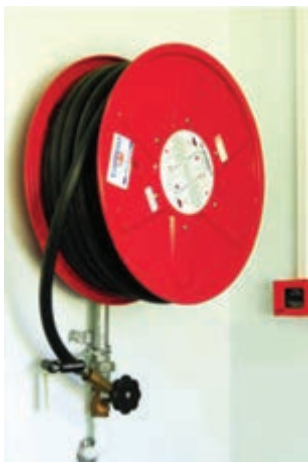
شکل ۴-۲- یک نمونه شیلنگ قرقره آب تحت فشار

۴- استفاده و حمل آن بسیار آسان‌تر و وزن آن سبک‌تر از