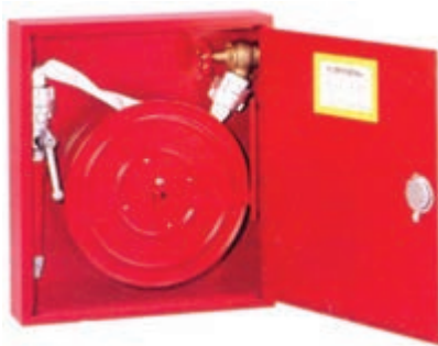
شکل ۴-۱- جعبه آتش‌نشانی

مشخص در نزدیکی شیرهای آتش‌نشانی تعبیه شده است. جعبه‌های آتش‌نشانی حاوی شیلنگ‌ها، قرقره شیلنگ‌های آب تحت فشار و نازل سر شیلنگ‌هاست (شکل ۴-۱).