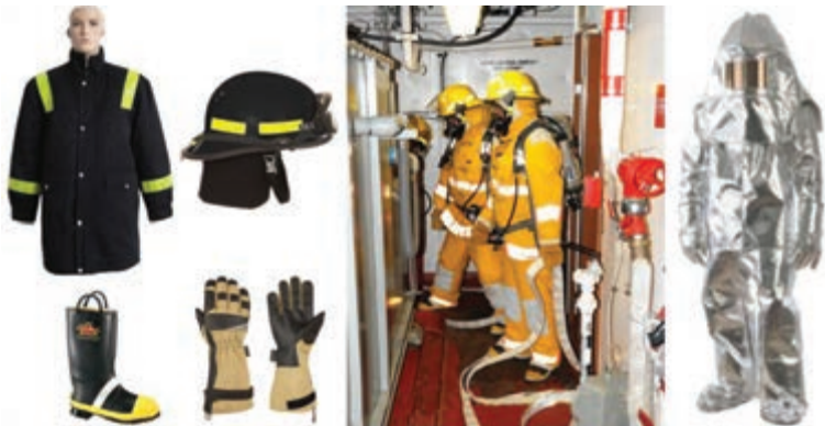
لباس کامل آتش نشانی