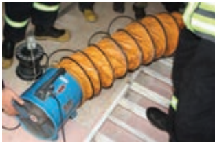
دمنده هوا نصب شده (تهویه با فشار منفی)

دمنده‌های تهویه قابل حمل در اصل وسایلی هستند که معمولاً فاقد راحتی و کفایت سامانه‌های تهویه ثابت‌اند. به هر حال، هنگام وجود گازها و بخارهای قابل انفجار، به کار بردن سامانه‌های تهویه ثابت ممکن است خطرناک باشد. فقط می‌توان از دمنده‌های قابل حمل که به موتورهای ضدانفجار مجهزند استفاده نمود.