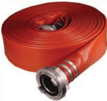
شکل ۳-۴- لوله حریق و اتصالات سر آن در شناورها

وقتی روش‌های ذکر شده اطفای حریق به کمک آب نتوانند مشکل را حل کنند و قادر به تأمین آب کافی نباشند، به‌کارگیری لوله حریق ضرورت پیدا می‌کند.