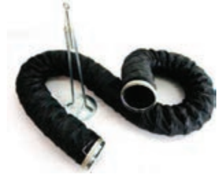
خرطومی دمنده هوا