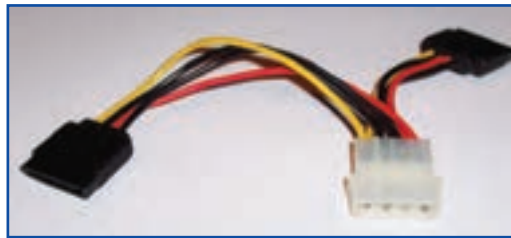
شکل ۴-۷ کابل های منبع تغذیه

منبع تغذیه سطح ولتاژهای متفاوت ۳/۳، ۵ و ۱۲ ولت را تولید می کند که سطح ولتاژ ۳/۳ و ۵ ولت، جهت استفاده مدارهای منطقی و سطح ولتاژ ۱۲ ولت برای راه اندازی موتورهای دیسک گردان ها و یا پروانه های خنک کننده استفاده می شود. با بالا رفتن مصرف برق پردازنده های چند هسته ای و کارت های گرافیک، نیاز سیستم های امروزی به خروجی ۱۲ ولتی بیشتر شده است. به همین دلیل در هنگام تهیه منبع تغذیه باید توجه داشت که خروجی ۱۲ ولت آن بیشترین توان را داشته باشد. استفاده زیاد از خروجی های ۵ و ۳/۳ ولتی در سیستم های مدرن که دارای پردازنده های چند هسته ای و چند کارت گرافیک هستند باعث کاهش توانایی منبع تغذیه در تأمین برق مورد نیاز اجزای اصلی می شود که عموماً از خروجی های ۱۲ ولتی تأمین می شوند.