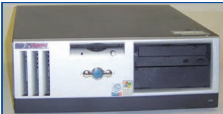
شکل ۷-۱ کیس رومیزی

این نوع کیس به صورت افقی است (شکل ۷-۱) و بر روی میز قرار می گیرد و به طور معمول صفحه نمایش را روی آن قرار می دهند. امروزه از این نوع کیس ها خیلی کم استفاده می شود.