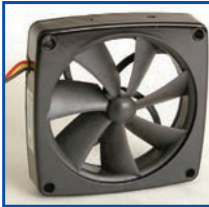
شکل ۷-۷ پروانه خنک‌کننده

برای خنک کردن منبع تغذیه ATX، پروانه خنک‌کننده آن، هوای داخل کیس را به داخل منبع تغذیه کشیده و سپس به خارج از کیس می‌دمد. این عمل پروانه علاوه بر خنک کردن منبع تغذیه باعث گردش هوای داخل کیس و خنک شدن سایر قطعات سیستم نیز می‌شود. برای اطمینان از کنترل مناسب دمای قطعات داخل کیس افزون بر پروانه منبع تغذیه، پروانه‌های خنک‌کننده دیگری را می‌توان در سطوح بالایی یا جانبی کیس نصب کرد. تعداد پروانه‌های خنک‌کننده اضافی و ضرورت آن بستگی به محل نصب و پیکربندی رایانه از نظر نوع پردازنده و اجزای جانبی مانند دیسک گردان‌ها دارد. نمونه‌ای از پروانه خنک‌کننده در شکل ۷-۷ مشاهده می‌شود.