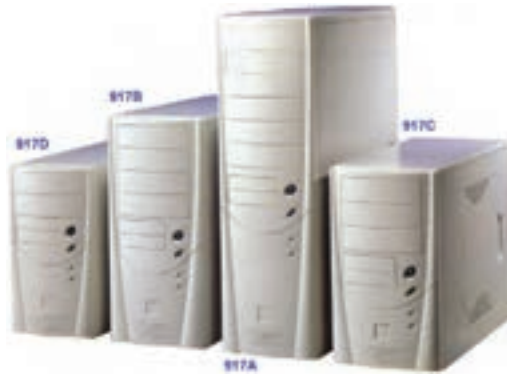
شکل ۲-۷ کیس‌های برجی در اندازه‌های مختلف

- برج کوچک ۱ : برای برد اصلی با فاکتور شکل MicroATX.