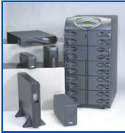
شکل ۶-۷ دستگاه‌های مختلف برای تأمین برق بی‌وقفه