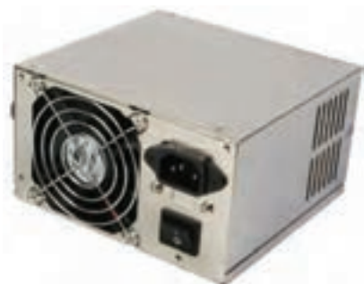
شکل ۳-۷ منبع تغذیه