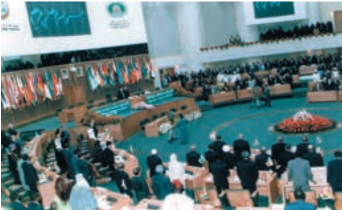
اجلاس سران کشورهای اسلامی - تهران ۱۳۷۶

براساس تحقیقات به عمل آمده، عوامل عدم موفقیت در همکاری‌های اقتصادی کشورهای مسلمان عبارت‌اند از: عدم همکاری‌های سیاسی، بُعد مسافت، رقیب بودن کالاهای تولیدی و بالاخره اختلاف درجه توسعه در کشورهای منطقه.