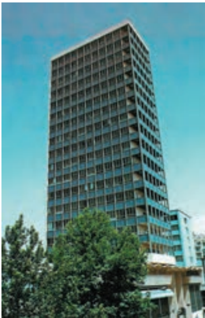
ساختمان بورس اوراق بهادار تهران

اگرچه اندیشهٔ ایجاد بازار بورس در ایران به سال ۱۳۱۵ شمسی برمی‌گردد، اما قانون بورس اوراق بهادار تهران در سال ۱۳۴۵ تصویب شد. بورس اوراق بهادار تهران در سال ۱۳۴۶ با عرضهٔ سهام بانک توسعهٔ صنعتی شروع به کار کرد و تا سال ۱۳۵۷ تعداد ۱۰۲ شرکت به عضویت آن درآمدند. بورس تهران تا سال ۱۳۸۴ براساس قانون مذکور اداره می‌شد. با توجه به ضرورت توسعهٔ بازار سرمایه، قانون جدیدی تدوین شد