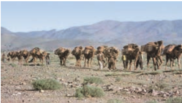
تصویری از کاروان‌های تجاری در گذشته

راه‌های مناسب و مقررات مورد قبول بین‌المللی، هزینه‌های تجارت نه تنها در داخل مرزها بلکه در خارج از آن نیز کاهش یافته است.