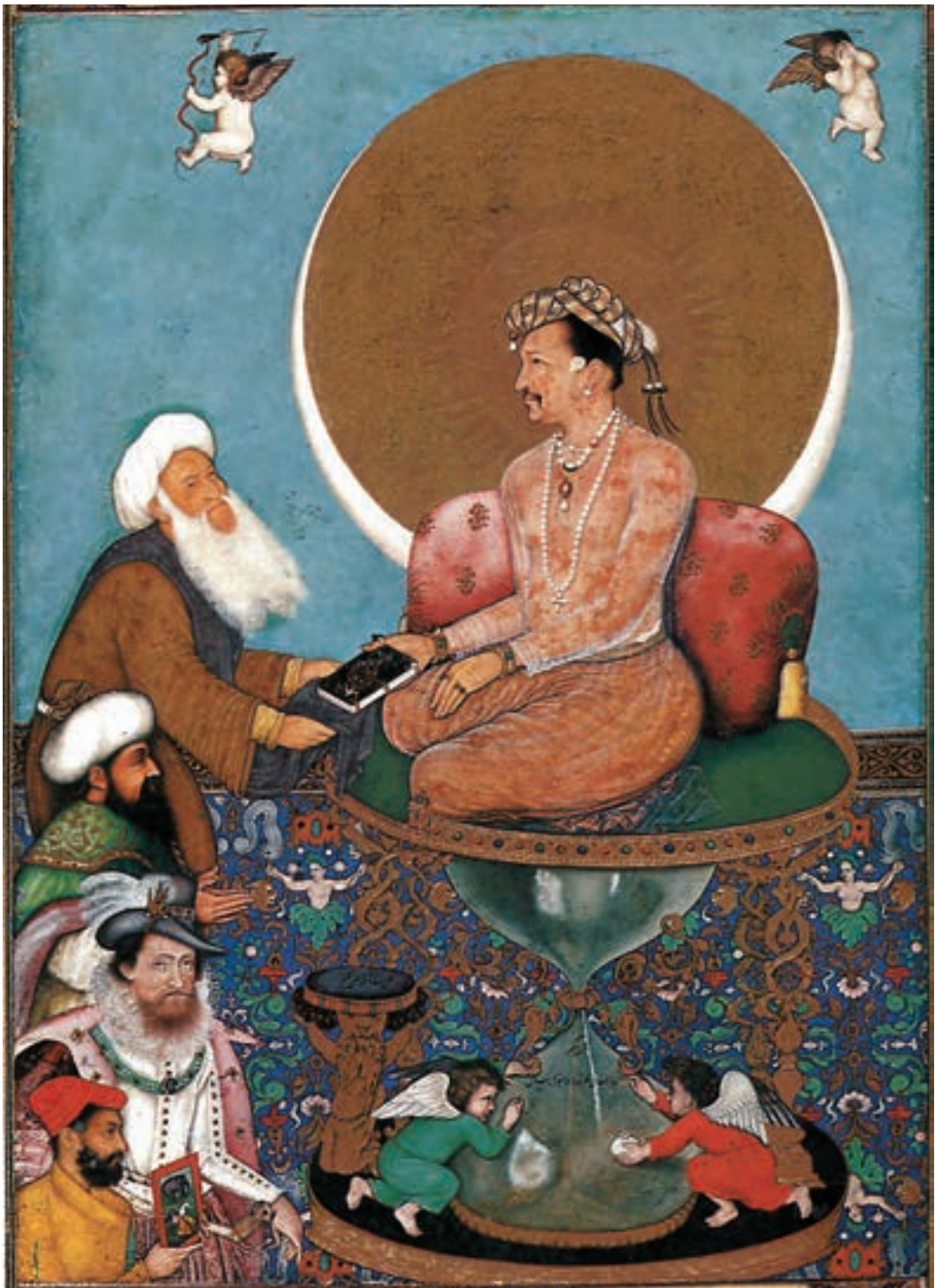
جهاگیر بر مسندی از ساعت نشی، رقم چتر از بیرون ابو الحسن، مکتب مغول