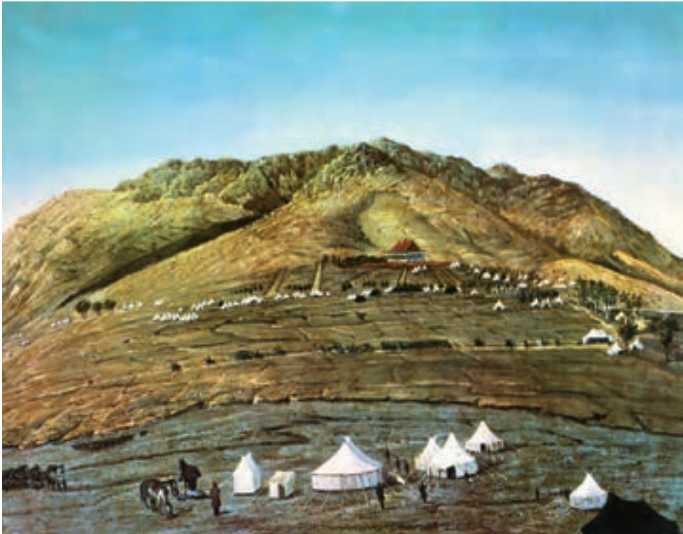
منظره سرخه حصار معماری قصر ناصریه، سال ۱۳۰۳ قمری، رنگ و روغن، اثر استاد کمال الملک