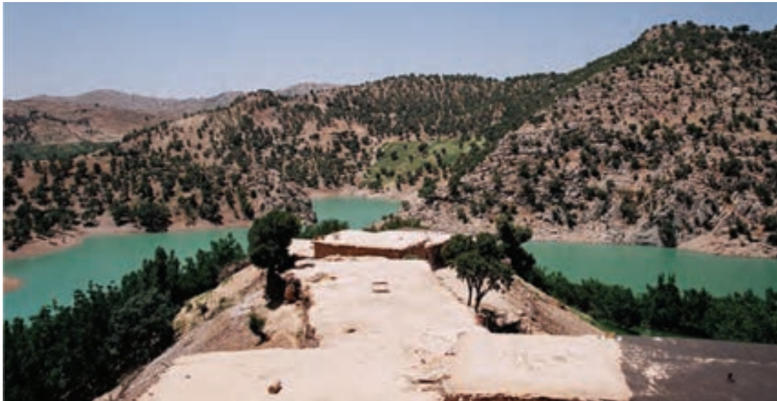
شکل ۲۰-۱- دریاچه (برم) مور زردزیلایی

۲- تالاب برم آلوان : این دریاچه در حدود ۴۰ کیلومتری شهر لیکک، در شهرستان بهمنی دهستان سرآسیاب یوسفی (نام محلی آوالمون) قرار دارد. آب آن دائمی، ارتفاع آن ۱۱۰۰ متر از سطح دریا، مساحت آن در حدود ۱۵ هکتار، حداقل عمق آن ۱۲ و حداکثر ۳۰ متر است. ماهیان این تالاب از نوع کپور معمولی اند. برم های کوچک و فصلی دیگری نیز در سطح استان وجود دارد. آب تالاب از چشمه هایی که در زیر تالاب هستند تأمین می شود و آب آن وابستگی به آب های جاری و سطحی مناطق اطراف ندارد ولی خروجی آن از ضلع شمالی به طرف رود قلات می باشد.