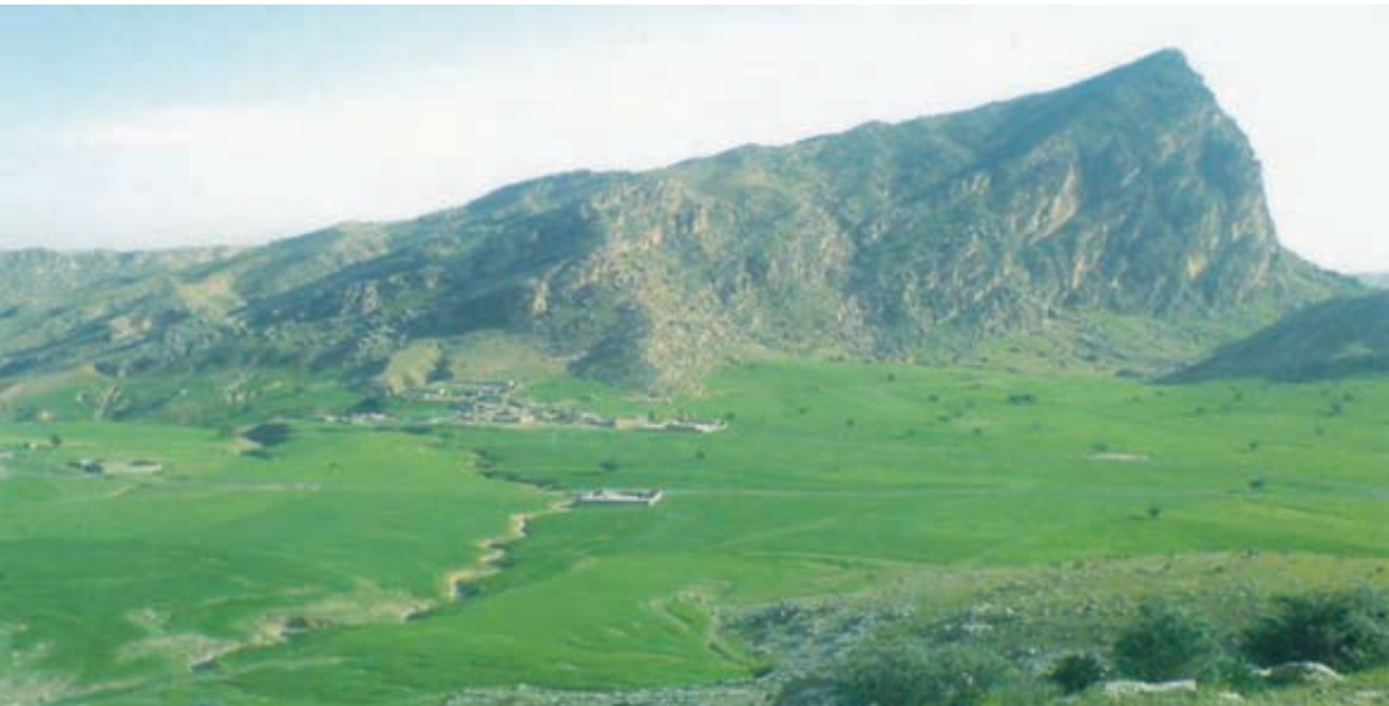
شکل ۱-۸- دشت بن در کهگیلویه