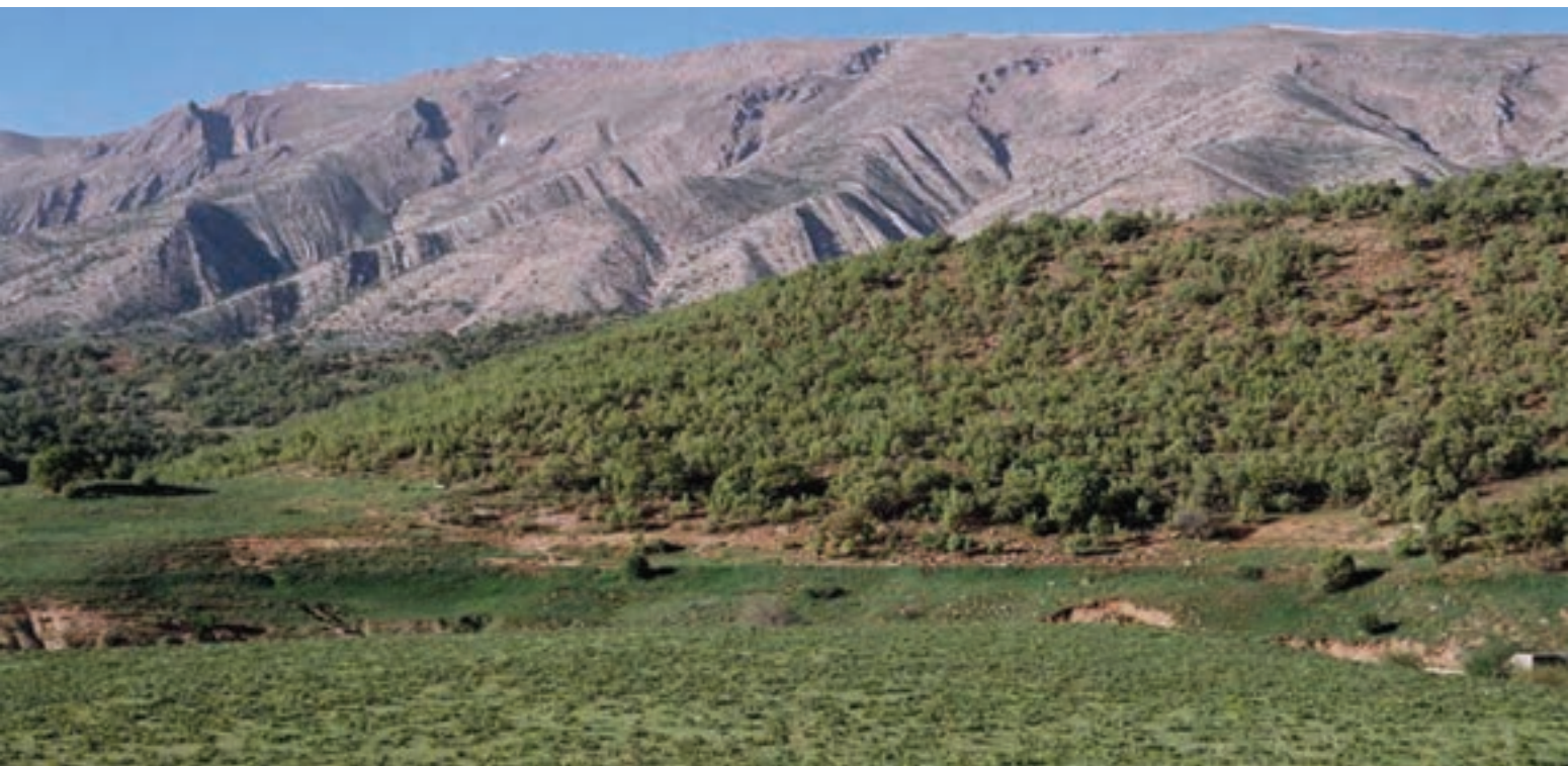
شکل ۵-۱- چشم اندازی از کوه‌های مرتفع استان