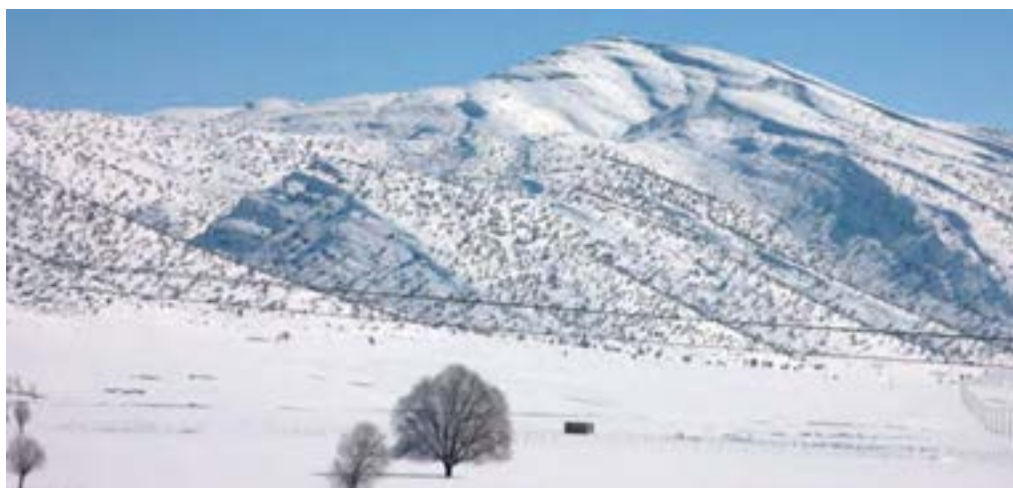
شکل ۶-۱ چشم اندازی از کوه‌های پوشیده از برف استان