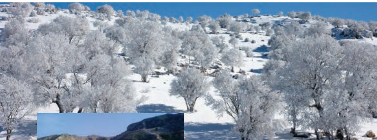
شکل ۱۱- منطقه سردسیر استان