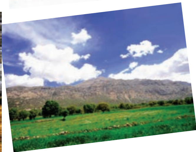
شکل ۹-۱- چشم‌اندازی از مناطق مختلف استان در فصول گوناگون