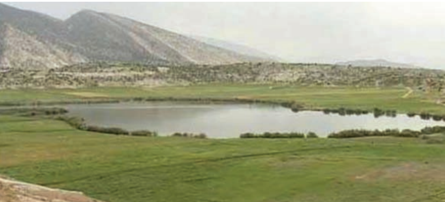
شکل ۲۱-۱- تالاب برم الوان

۲- تالاب برم آلوان : این دریاچه در حدود ۴۰ کیلومتری شهر لیکک، در شهرستان بهمنی دهستان سرآسیاب یوسفی (نام محلی آوالمون) قرار دارد. آب آن دائمی، ارتفاع آن ۱۱۰۰ متر از سطح دریا، مساحت آن در حدود ۱۵ هکتار، حداقل عمق آن ۱۲ و حداکثر ۳۰ متر است. ماهیان این تالاب از نوع کپور معمولی اند. برم های کوچک و فصلی دیگری نیز در سطح استان وجود دارد. آب تالاب از چشمه هایی که در زیر تالاب هستند تأمین می شود و آب آن وابستگی به آب های جاری و سطحی مناطق اطراف ندارد ولی خروجی آن از ضلع شمالی به طرف رود قلات می باشد.