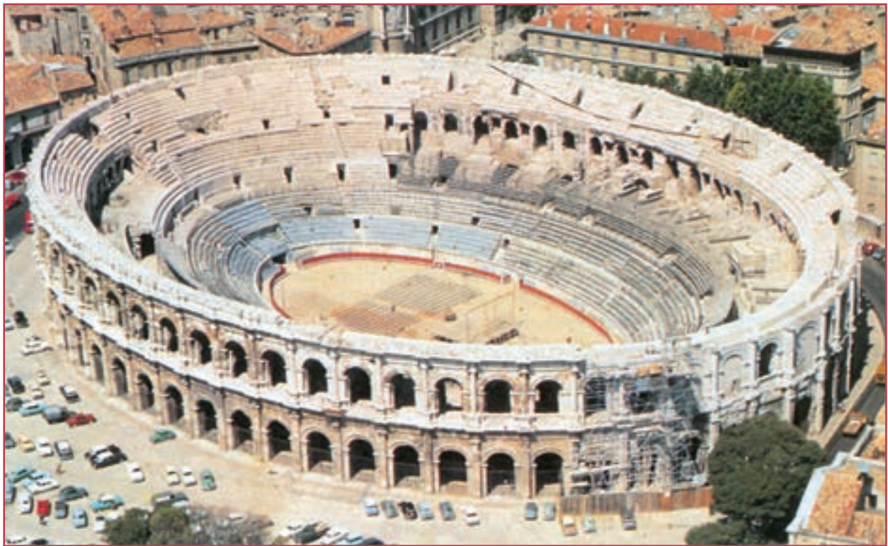
یکی از آمنی تئاترهای رومی‌ها با ظرفیت ۲۵۰۰۰ نفر. دیدن نمایش‌های مختلف از جمله مهم‌ترین تفریحات رومیان — به ویژه طبقات اشراف و بزرگان رومی — بود.

زندگی اجتماعی : در اوایل تشکیل حکومت روم، جامعه رومی از سه گروه اصلی رومی‌های اصیل، مردمان غیر رومی و بردگان تشکیل شده بود. حق مالکیت زمین و شرکت در انتخابات مخصوص گروه اول بود و مقامات بالای کشوری نیز از میان آنها انتخاب می‌شدند؛ اما این وضع با گذشت زمان تغییر کرد و گروه دوم از طریق اعتراضات و اقدامات فراوان به تدریج توانستند از امتیازات گروه نخست برخوردار شوند. بردگان در روم، وضعی اسف‌بار داشتند. از این رو، گاهی شورش می‌کردند. در جامعه رومی، گروه‌های مختلف مردم به