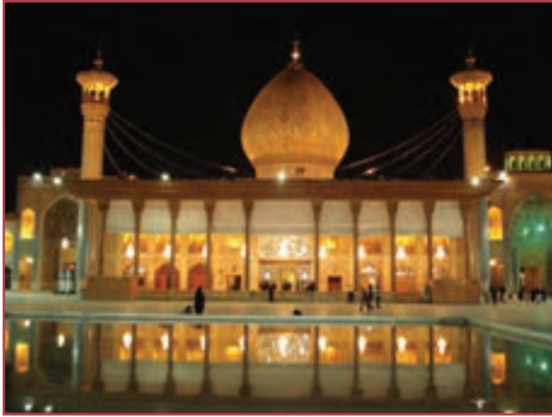
حرم شاه چراغ در شیراز

نکته بسیار جالب در خصوص مسلمان شدن ایرانیان آن است که آنان با پذیرش اسلام، تاریخ و فرهنگ خود را از یاد نبردند و بسیاری از عناصر فرهنگی و تمدنی خود را همچنان حفظ کردند. درباره این موضوع در درس ۱۹ مطالب بیشتری خواهید خواند.