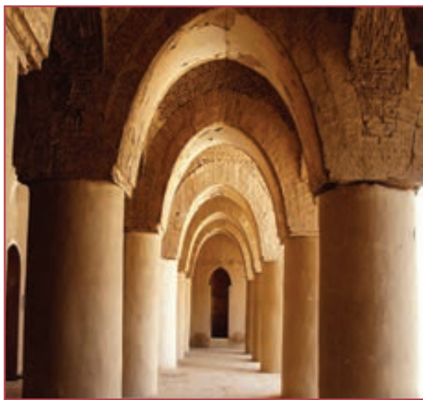
مسجد تاریخانه دامغان از کهن‌ترین مساجد ایران

گروندگان به اسلام ایجاد کرد؛ تحقیر مسلمانان غیرعرب، محرومیت آنان از پاره‌ای حقوق اجتماعی و گرفتن جزیه از نو مسلمانان ۱ ، نمونه‌ای از آن رفتارهاست. البته ایرانیان هیچگاه این رفتارهای غیرانسانی و غیراسلامی را به حساب اسلام نگذاشتند. در زمان خلافت عباسیان و به‌خصوص در عصر حکومت‌های ایرانی، گرایش به دین اسلام در ایران شتاب گرفت و سرانجام اکثریت ایرانیان مسلمان شدند.