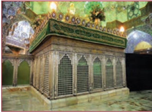
حرم حضرت معصومه علیها السلام در قم

روند آرام و تدریجی اسلام آوردن مردم ایران، شور و حرارت نومسلمانان ایرانی برای تبلیغ اسلام و مشارکت جدی آنان در پایه گذاری و نشر معارف اسلامی، دلالت بر آن دارد که ایرانیان بر اساس شناخت و علاقه به اسلام روی آوردند. بنابراین، اجبار و منفعت جویی، نمی توانسته نقش تعیین کننده و مؤثری در گرایش آنها به اسلام داشته باشد. ایرانیان خواه زردشتی و خواه مسیحی و یهودی، مردمی یکتاپرست و معتقد به معاد، بهشت و جهنم و ظهور منجی بودند. از این رو، درک و پذیرش جهان بینی توحیدی و پیام مکتب اسلام برای آنان، دشوار و ناخوشایند نبود. سابقه آشنایی ایرانیان با اسلام به زمان حیات رسول اکرم صلی الله علیه و آله و سلم باز می گردد. علاوه بر سلمان فارسی، صحابی برجسته پیامبر که نقش مؤثری در گسترش اسلام در ایران داشت، ایرانیان ساکن یمن نیز در زمان حضرت محمد صلی الله علیه و آله و سلم به دین اسلام گرویدند.