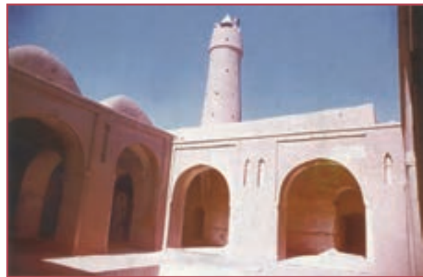
مسجد فهرج یزد از کهن‌ترین مساجد ایران