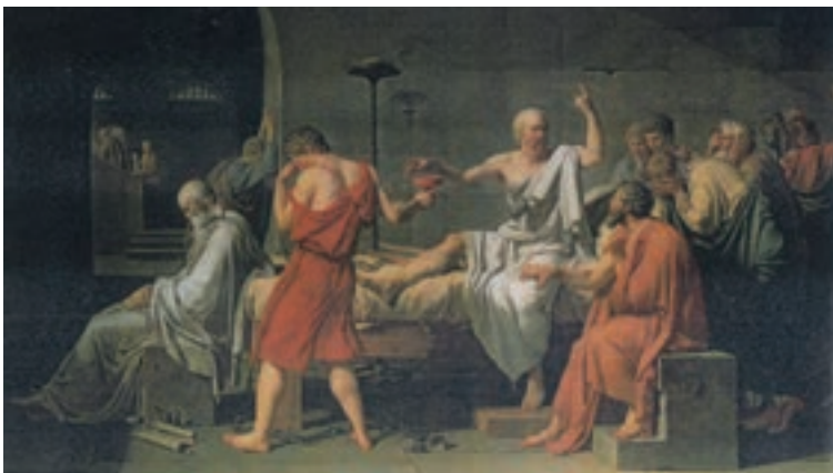
مرگ سقراط اثر نقاش فرانسوی «ژاک دیوید» که در سال ۱۷۸۷ به پایان رسانده است.

سرانجام روز موعود فرارسید، همسر و فرزندان سقراط برای آخرین دیدار به زندان آمدند. سقراط برای آنکه آنها شاهد مرگ او نباشند زودتر از دیگران در میان شیون و زاری با آنها وداع کرد و آنها را به بیرون از محوطه‌ زندان فرستاد. اینک او بود و تنی چند از یاران نزدیک و باوفایش؛ آن لحظه‌ شوم، نزدیک و نزدیک تر می‌شد. سقراط از جابرخواست و برای شست‌وشو به اتاق مجاور رفت. دوستانش هرکدام در گوشه‌ای زانوی غم به بغل گرفته بودند و در سکوتی اندوهبار، افول آفتاب را در افق نظاره می‌کردند. سقراط پس از استحمام به میان یاران بازگشت، بین آنها گفت‌وگوی مختصری گذشت. همان دم زندانبان وارد شد و به سقراط گفت: «من تو را نجیب‌ترین و شریف‌ترین کسی می‌دانم که تاکنون در این زندان با او سروکار داشته‌ام، آنها وقتی حکم نوشیدن زهر را از من می‌شنیدند خشمگین می‌شدند و به من ناسزا می‌گفتند، ولی می‌دانم که تو بر من خشم نمی‌گیری و مرا سرزنش نمی‌کنی، سعی کن این مرحله را نیز با متانت و بردباری تحمل کنی.» این را گفت و در حالی که اشک از دیدگان فرومی‌ریخت از در بیرون رفت. سقراط به دوستان گفت: «چه مرد خوبی است، در تمام مدتی که در زندان بودم به دیدن من می‌آمد و اکنون هم به حال من افسوس می‌خورد. ای کریتون سخن او را می‌پذیریم، بگو تا جام زهر را بیاورند.»