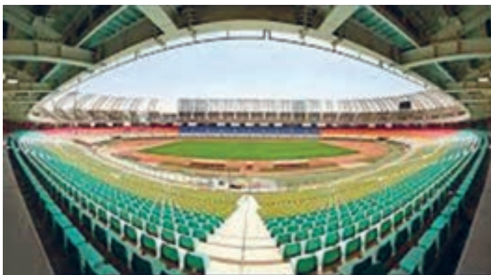
استادیوم نقش جهان اصفهان - ایران

با توجه به ابعاد اماکن و فضاهای ورزشی رسمی، رشته‌ها و تعداد نفرات تیم‌ها در فعالیت‌های آنان، این اماکن دارای ابعاد و اندازه‌های متفاوتی می‌باشند. به‌عنوان مثال، سالن ورزشی سرپوشیده، رشته ورزشی والیبال با ابعاد ۹×۱۸ و با جایگاه تماشاچیان، یا یک زمین فوتبال به ابعاد حداقل ۶۰×۹۰ با جایگاه تماشاچی و ظرفیت بیش از ۳۰ هزار نفر، مطمئناً تفاوت محسوسی در شکل و معماری این استادیوم با آن سالن مشاهده می‌شود. در نتیجه برنامه‌ریزی برای انجام یک مسابقه والیبال برای تماشاچیان کمتر از ۱۲۰۰۰ نفر، با استادیوم ورزشی فوتبال با تماشاچیان کمتر از ۱۰۰ هزار نفر تفاوت‌های آشکاری خواهند داشت. بنابراین اگر مقرر است در یک زمان، همانند بازی‌های آسیایی یا المپیک مسابقات چند رشته ورزشی انجام گردد، نیازمند برنامه‌ریزی گسترده‌تر با امکانات بیشتر خواهیم بود.