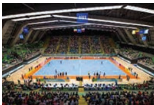
سالن ورزشی والیبال مجموعه ورزشی آزادی تهران

با کمک هم کلاسی خود انواع سالن‌های تک‌منظوره و چندمنظوره‌ای را که تاکنون مشاهده یا از آن استفاده کرده‌اید به کلاس ارائه دهید.