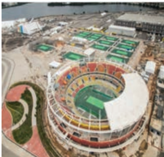
مجموعه ورزشی المپیک ریو - برزیل

منظور از استاندارد فدراسیون‌های ملی و جهانی، استانداردهای داخل زمین (مانند مستطیل سبز در فوتبال، درون مستطیل ۹×۱۸ والیبال، پیست دوومیدانی و...) و مشخصات کالبدی فنی آن است. استانداردهای داخل زمین در فضاها و اماکن ورزشی متفاوت می‌باشد لذا گاهی: بیان مجموعه ورزشی ۱ ، جامع‌ترین واژه برای یک مکان ورزشی را در ذهن تداعی می‌کند چرا که در آن امکانات انواع رشته‌های ورزشی تک‌منظوره، چندمنظوره، میدانی، سوارکاری، شنا، قایقرانی و... را در خود جای می‌دهد. مانند، مجموعه ورزشی آزادی که علاوه بر ورزش‌های توپی، غیرتوپی، اماکن و فضاهای ورزشی روباز و سرپوشیده را با کلیه امکانات جانبی در آن ایجاد نموده‌اند.