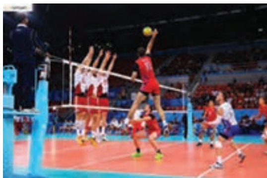
مسابقه تیم ملی والیبال ایران در سالن ۱۲ هزار نفری آزادی