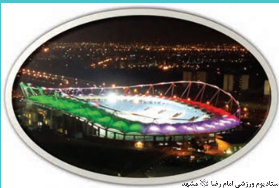
استادیوم ورزشی امام رضا علیه السلام مشهد