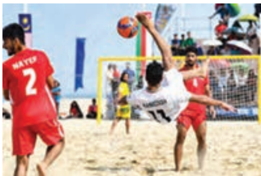
مسابقه تیم فوتبال ساحلی ایران - یزد