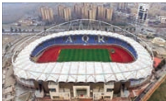
استادیوم امام رضا (ع) مشهد - ایران

و گاهی نیز استانداردها در سالن‌های ورزشی ۲ تک‌منظوره و چندمنظوره تعریف می‌شود. این سالن‌ها مکانی است برای آموزش، تمرین و برگزاری مسابقات مختلف (سالن‌های بسکتبال، والیبال، استخرشنا و...). فضای طراحی شده باید دارای امکانات مختلفی از قبیل رختکن، سرویس بهداشتی، دوش، بوفه و رستوران و غیره باشد.