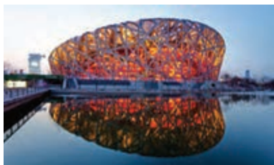
استادیوم آشیانه پرنده پکن - چین

در جایی دیگر مکان ورزشی که استانداردهای فنی را کاملاً رعایت نموده است می‌تواند یک استادیوم ۱ باشد و آن مکانی است که، از یک میدان بازی در ابعاد مختلف و برای انجام رشته‌های گوناگون ورزشی مرتبط درست شده است (مانند فوتبال، دوچرخه‌سواری، دوومیدانی). دورتا دور میدان، جایگاه یا سکوی تماشاگران واقع شده است. این سکوها به صورت پلکانی ساخته شده است و زیر این سکوها، مکان‌های سرپوشیده برای بدن‌سازی، ژیمناستیک، انباری، سرویس‌های بهداشتی، دوش، رختکن و... طراحی و تعبیه شده است. به‌عنوان مثال می‌توان استادیوم لانه پرنده پکن (آشیانه پرنده) و یا در ایران استادیوم امام رضا (ع) در مشهد را نام برد.