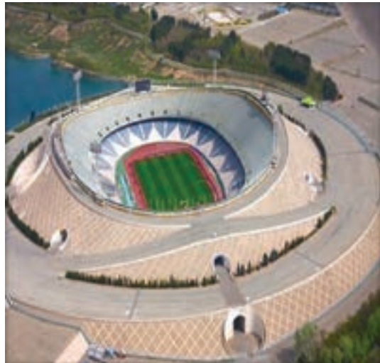
مجموعه ورزشی آزادی تهران - ایران

با توجه به تعریف مجموعه ورزشی، تصویر یک مجموعه ورزشی داخل و خارج از ایران را تهیه و به کلاس ارائه دهید.