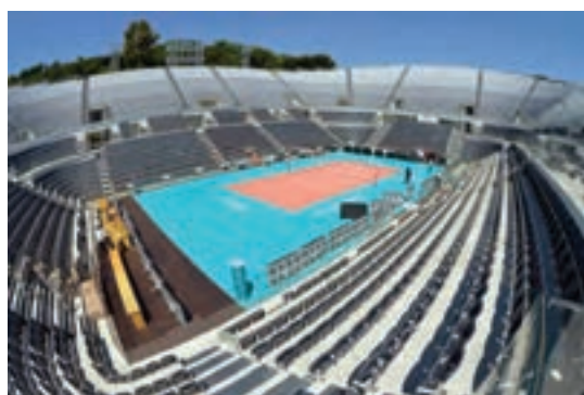
سالن ورزشی روباز والیبال شهر رم - ایتالیا

و گاهی نیز استانداردها در سالن‌های ورزشی ۲ تک‌منظوره و چندمنظوره تعریف می‌شود. این سالن‌ها مکانی است برای آموزش، تمرین و برگزاری مسابقات مختلف (سالن‌های بسکتبال، والیبال، استخرشنا و...). فضای طراحی شده باید دارای امکانات مختلفی از قبیل رختکن، سرویس بهداشتی، دوش، بوفه و رستوران و غیره باشد.