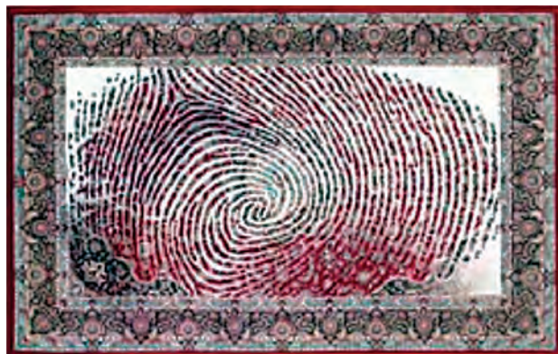
شکل ۱-۲- هویت در فرش

تاکنون برنامه‌های سازمان‌یافته متعددی برای همه‌گیر کردن تولید فرش به همراه شناسنامه به صورت یکسان صورت گرفته است. آیا می‌دانید شناسنامه فرش دارای چه مزایایی است؟ آیا می‌دانید برای ترویج تولید و عرضه فرش به همراه شناسنامه آن چه موانعی وجود دارد؟ اکنون تصویر زیر چه چیزی را در ذهن شما تداعی می‌کند؟