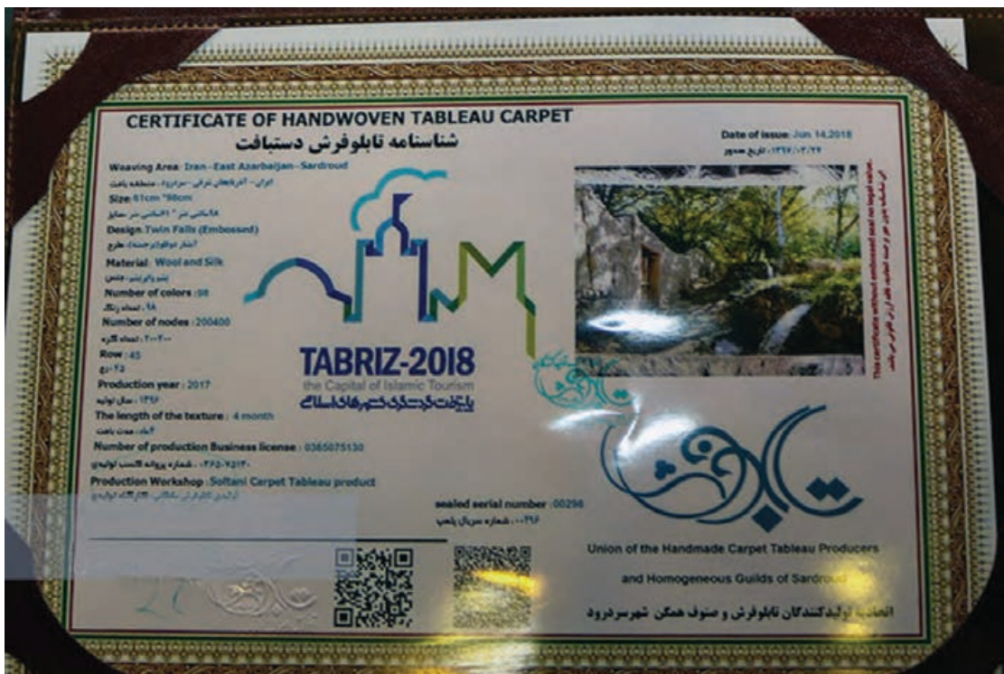
شکل ۲-۳. ثبت شناسنامه به نام یکی از شهرهای قالی‌بافی ایران در سال ۱۳۹۷

در مورد فرش دستیاف، حفظ هویت ایرانی و زمینه‌سازی لازم برای جلوگیری از جعل آن توسط کشورهای رقیب و همچنین اطمینان خاطر دادن به مشتریان در هنگام خرید از اهداف اصلی است. چرا که حق مشتری است که بداند هزینه‌ای که برای خرید کالا پرداخت می‌نماید برای چه کالایی و با چه مشخصاتی است. خصوصاً در مورد فرش، که علاوه بر مصرفی بودن، کالایی هنری و سرمایه‌ای نیز محسوب می‌گردد. بسته به اینکه شناسنامه فرش با چه هدفی تهیه گردد می‌توان محتویات آن را مشخص کرد. از این رو معیارهای فرهنگی و ارزشی، اقتصادی و اجتماعی (مصرفی) برای شناسنامه فرش ایرانی همگی مدنظر هستند. فرایند تهیه شناسنامه برای افراد یا استانداردهای برندسازی الگوهای مناسبی برای تعیین ویژگی‌های مندرج در شناسنامه فرش هستند.