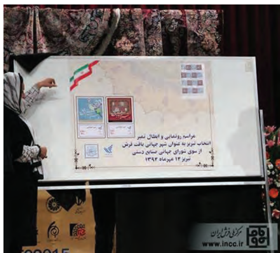
شکل ۳-۳- ثبت تبریز به عنوان شهر جهانی فرش

بسته به اینکه شناسنامه فرش با چه هدفی تهیه گردد می‌توان محتویات آن را مشخص کرد. از این‌رو همه معیارهای فرهنگی، ارزشی، اقتصادی و اجتماعی (مصرفی) برای شناسنامه فرش ایرانی مدنظر است. فرایند تهیه شناسنامه برای افراد یا استانداردهای برندسازی الگوهای مناسبی برای تعیین ویژگی‌های مندرج در شناسنامه فرش است.