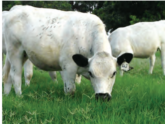
تغذیه دام از مرتع

تغذیه دام در چراگاه و جایگاه، هر کدام دارای چه مزایا و معایبی هستند؟