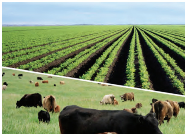
چرای دام در مرتع ارگانیک

چنانچه با وجود معیارهای پیشگیرانه فوق، حیوانی بیمار یا مصدوم شد باید فوراً تحت درمان قرار گیرد و در صورت لزوم در جایگاه مناسب، به‌طور جداگانه نگهداری شود. روش کار باید به‌گونه‌ای باشد که ایجاد وقفه در درمان باعث آزار حیوان نشود، حتی اگر کاربرد روش درمانی سبب از دست‌دادن وضعیت ارگانیک حیوان شود.