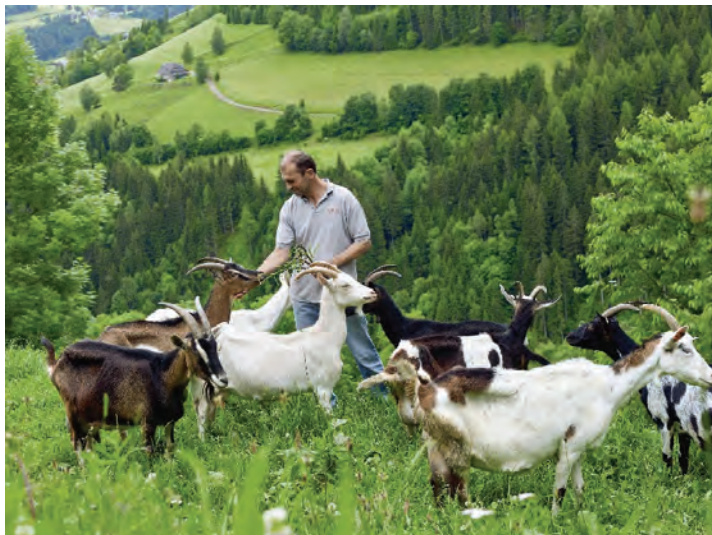
پرورش دام سبک به روش ارگانیک