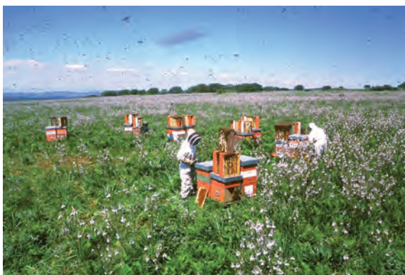
پرورش زنبورعسل به روش ارگانیک

یکی از اهداف اصلی زنبورداری ارگانیک، تولید محصولات مختلف (عسل، موم، گرده، بره‌موم و ژله‌روبال) به صورت ارگانیک است. منظور از محصولات ارگانیک، محصولی است که با توجه به قوانین، دستورالعمل‌ها و استانداردهای موجود، تولید، عمل‌آوری، بسته‌بندی و عرضه گردیده است. لذا روش‌های مدیریتی، منابع غذایی، مواد مصرفی، روش‌های پیشگیری و درمان بیماری‌ها، باید با دقت کامل انتخاب و به کار گرفته شوند.