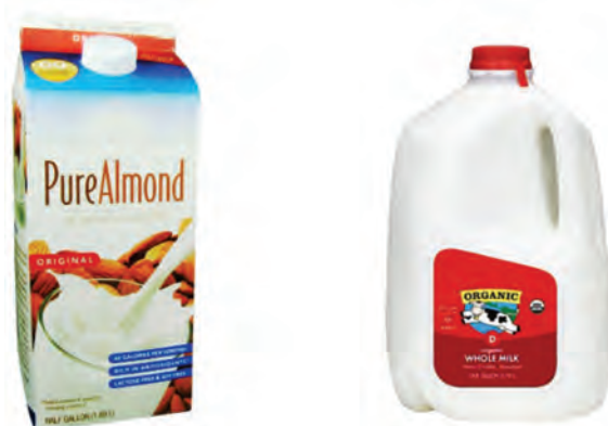
تولید شیر ارگانیک

در صورت لزوم، استفاده از آنتی بیوتیک توسط دامپزشک به صورت کتبی تأیید شده باشد. چنین درمانی باید منجر به دوره زمانی ۳۰ روزه عدم استفاده از شیر به عنوان محصول ارگانیک شود یا مدت زمان فوق می تواند ۲ برابر دوره زمانی قطع داروی توصیه شده باشد (هر کدام طولانی تر بود). استفاده از آنتی بیوتیک ها باید در رکوردهای بهداشتی مزرعه ثبت شود. حیوانات شیرده فقط می توانند ۲ بار در سال تحت درمان با آنتی بیوتیک قرار گیرند. حیواناتی که بیش از ۲ بار درمان در سال نیازمند باشند باید یک دوره گذار ۱۲ ماهه را برای قرار گرفتن در تولید ارگانیک طی نمایند. حیوانات شیرده که دچار بیماری های مزمن (ورم پستان) شده اند و نیازمند تکرار درمان می باشند باید از گله حذف شوند.