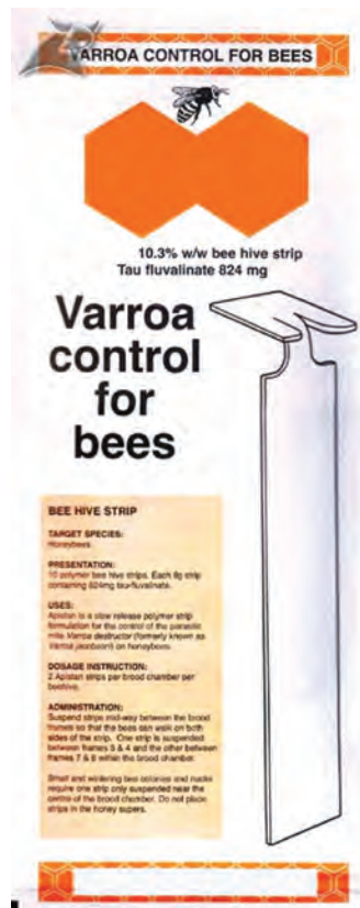
برخی از داروهای ضدکنه زنبور عسل