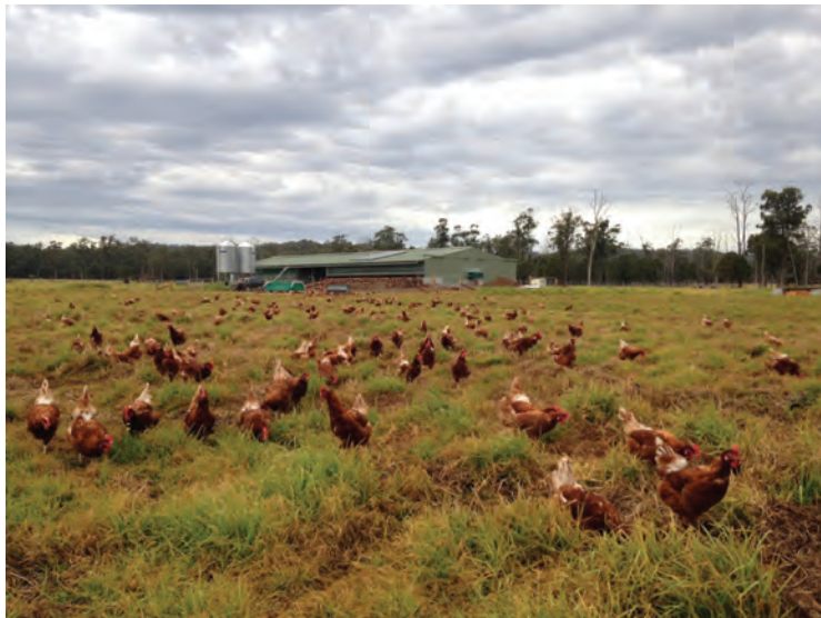
پرورش مرغ ارگانیک

سرعت رشد و افزایش طول دوره پرورش مطابق با قوانین پرورش ارگانیک می‌توان از سویه‌های تجاری گوشتی و تخم‌گذار امروزی در سیستم‌های پرورش ارگانیک استفاده نمود.