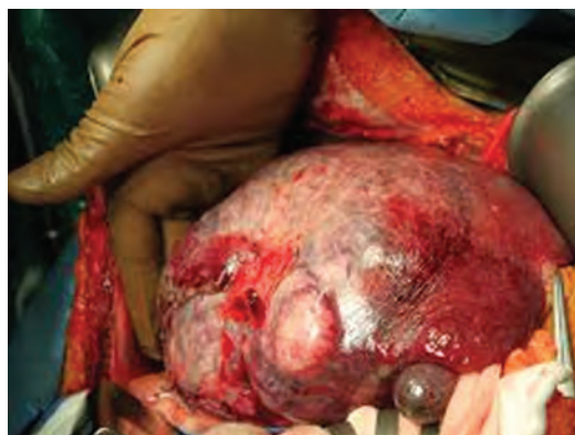
ایجاد انواع سرطان‌ها با استفاده از محصولات کشاورزی آلوده به مواد شیمیایی