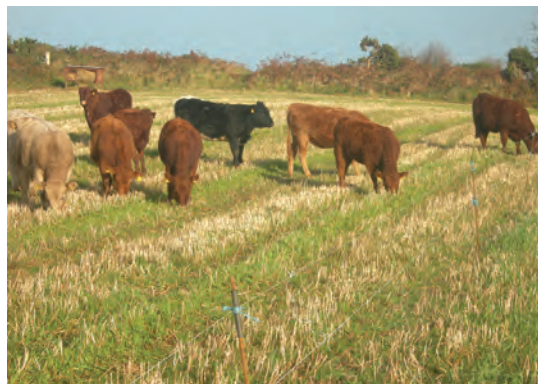
حصارکشی نواحی و چرای گردش مراتع

شدت و مدت زمان چرا بستگی به نوع گیاهی که در مرتع می‌روید و همچنین مدت زمان لازم برای رشد مجدد آن خواهد داشت. اگر علف‌های هرز در مزارع، یک مشکل هستند کشاورزان ارگانیک باید عملیات مدیریتی خود را تغییر دهند و نباید از علف‌کش‌ها استفاده کنند.