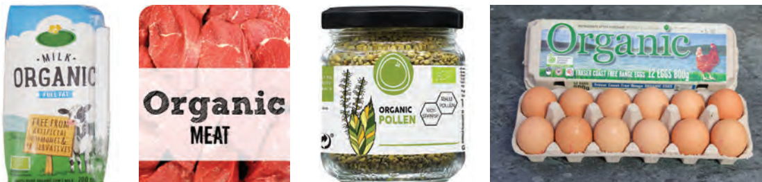
برخی از فراورده‌های تولیدی به روش ارگانیک

رشد، تغییرات ژنتیکی و موارد مشابه، تولید شده باشند، با نام خوراک زیستی (ارگانیک) شناخته می‌شوند. در بسیاری از کشورهای دنیا، محصولات ارگانیک، محصولات لوکس و خاص به‌شمار نمی‌روند و در فروشگاه‌ها، انواع محصولات ارگانیک، از میوه و سبزی گرفته تا مرغ، تخم‌مرغ، شیر، عسل و ماهی را می‌توان یافت. در روش پرورش ارگانیک با احترام گذاشتن به ظرفیت طبیعی خاک، گیاه، حیوانات و اکوسیستم، کمک مؤثری به حفظ تنوع زیستی می‌شود.