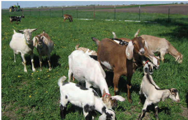
چرای دام در مرتع

■ تخریب محیط‌زیست: دامپروری گسترده اغلب باعث تخریب محیط‌زیست می‌شود و در دامپروری متراکم حیوانات را در شرایط نامطلوبی نگهداری می‌کنند. حیوانات مزرعه‌ای (اهلی) می‌توانند در مزرعه عملکرد زیادی داشته باشند اما همه مزارع برای نگهداری حیوانات مناسب نیستند.