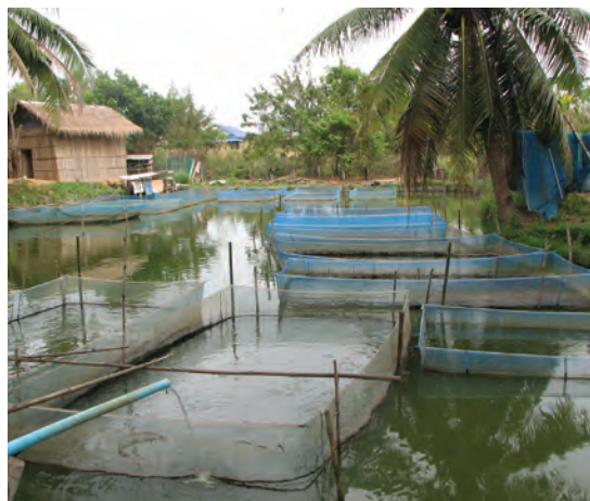
آبزی پروری ارگانیک

در شرایط بهداشتی و طبیعی تولید می‌شوند. بخش قابل توجهی از تولید آبزیان در بسیاری از کشورهای در حال توسعه در سطحی وسیع و بدون به کارگیری از موادی چون کودهای غیرآلی، غذاهای فرموله شده با مواد شیمیایی و سنتتیک، داروها و غیره تولید می‌شود که در نهایت بدون ایجاد هرگونه آسیب‌های زیست‌محیطی، محصول سالم به بازار عرضه می‌شود.