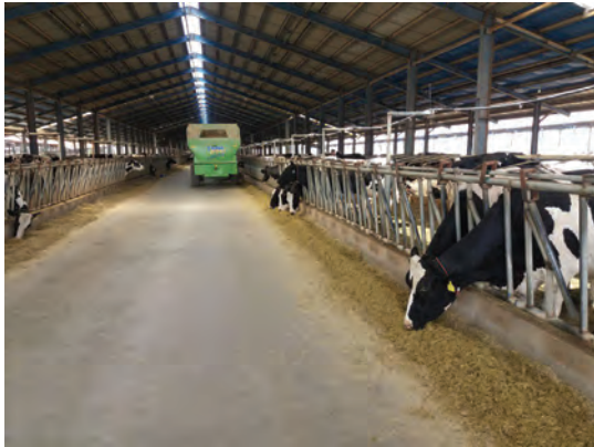
تغذیه دام در جایگاه

قابلیت دسترسی به علوفه اولین عامل محدودکننده در دامپروری ارگانیک است. اغلب تغذیه حیوانات در دامپروری ارگانیک بر پایه چرا در مرتع استوار است.