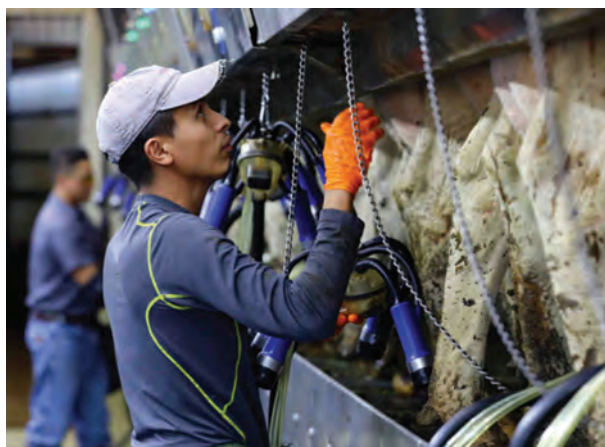
فعالیت کارگران در سالن شیردوشی

در دامپروری ارگانیک علاوه بر رعایت تمام مسائل مربوط به رفاه دام و همچنین حفظ طبیعت و محیط زیست، کارگران و افراد مرتبط با حیوان نیز باید دارای رفاه نسبی باشند؛ لذا در دامپروری ارگانیک، کارگران باید توسط سازمان های مربوط تأیید شده و دارای حقوق و مزایای مناسبی باشند.