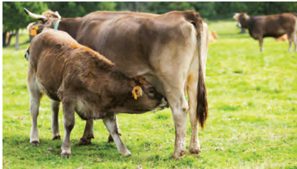
تغذیه گوساله از مادر

در دامپروری ارگانیک باید تا حد امکان سطح آسایش و سلامت را برای حیوان افزایش داد و این امر باعث