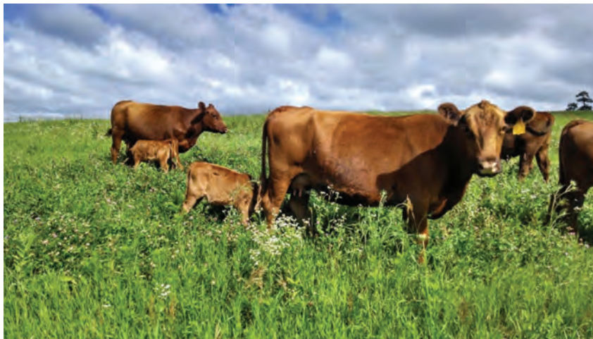
تغذیه ارگانیک دام‌ها در چراگاه

نکته قابل توجه اینکه در دامپروری ارگانیک به هیچ وجه نباید از آنتی‌بیوتیک‌ها استفاده کرد و برای تولید شیر ارگانیک ۱۲ ماه قبل از تولید شیر باید حیوانات از خوراک‌های ۱۰۰ درصد ارگانیک استفاده کنند. می‌توان از پری‌بیوتیک و پروبیوتیک در جیره جوجه‌های گوشتی استفاده نمود زیرا باعث کاهش کلسترول خون و گوشت شده که در نهایت منجر به کاهش بیماری‌های قلبی - عروقی در انسان می‌گردد.