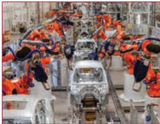
شکل ۱-۲- نقش رشته صنایع فلزی در صنایع خودروسازی