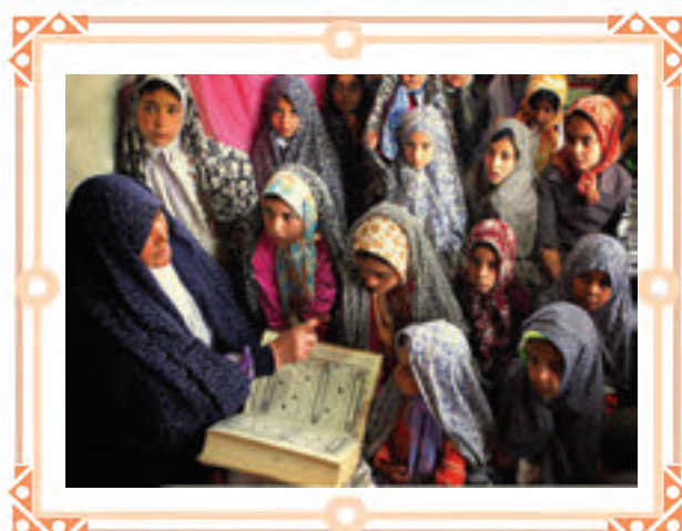
انس با قرآن کریم در یک «مدرسه‌ی قرآن»