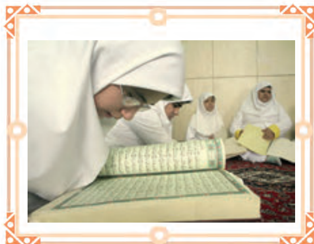
انس با قرآن کریم در مدارس استثنایی