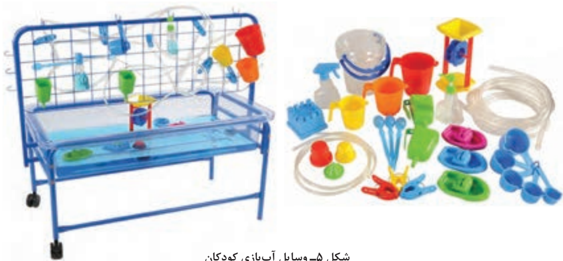
شکل ۵- وسایل آب بازی کودکان