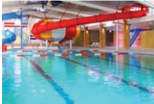
شکل ۱- استخر کودکان

فعالیت ۱: در گروه‌های کلاسی، با توجه به تصویر بالا، در موارد زیر گفت‌وگو کنید و نتیجه را در کلاس ارائه دهید.