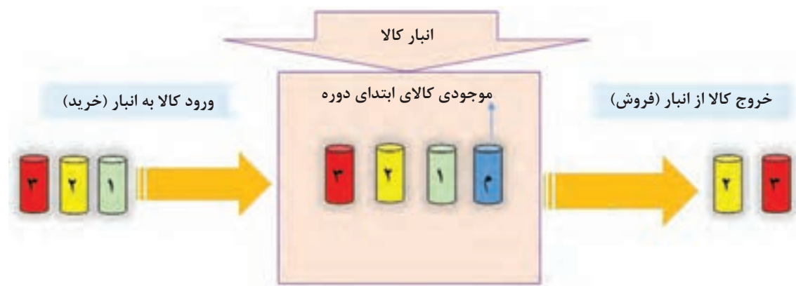
تصویر ۹-۳- جریان بهای تمام شده در روش اولین صادره از آخرین وارده

در این روش بر عکس روش FIFO، فرض بر این است که کالاها از محل آخرین خریدهایی که وارد انبار شده، خارج می‌شود و باقیمانده (موجودی پایان دوره) مربوط به قدیمی‌ترین خریدها (اولین خریدها) و موجودی ابتدای دوره می‌باشد. پس می‌توان نتیجه گرفت در این روش مبنای محاسبه بهای تمام شده کالاهای فروش رفته، قیمت آخرین خریدها و مبنای محاسبه بهای تمام شده موجودی کالای پایان دوره، می‌تواند قیمت خریدهای اول دوره و یا موجودی ابتدای دوره باشد. تصویر ۹-۳ به درک این مطلب کمک می‌کند.