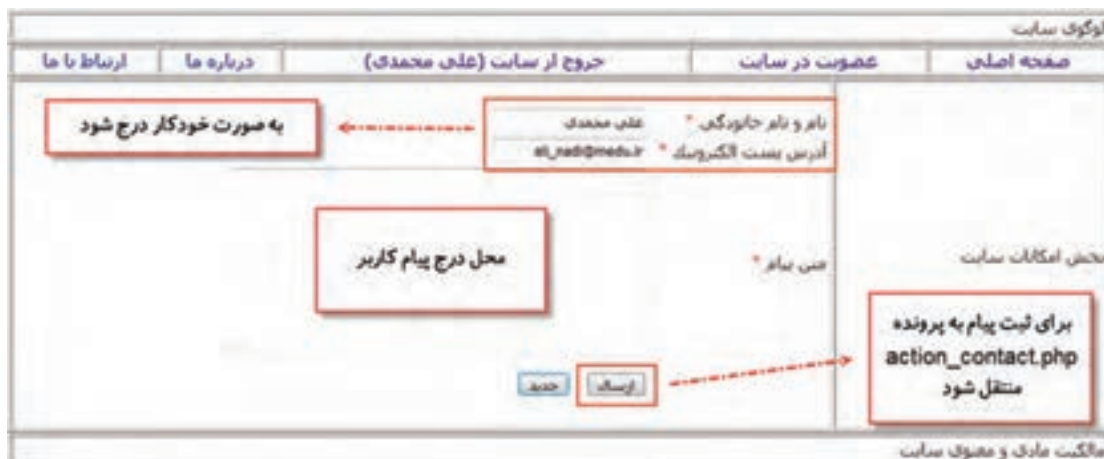
شکل ۱۵- صفحه وب ارتباط با ما