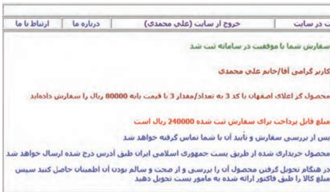
شکل ۱۱- گزارش ثبت سفارش به کاربر