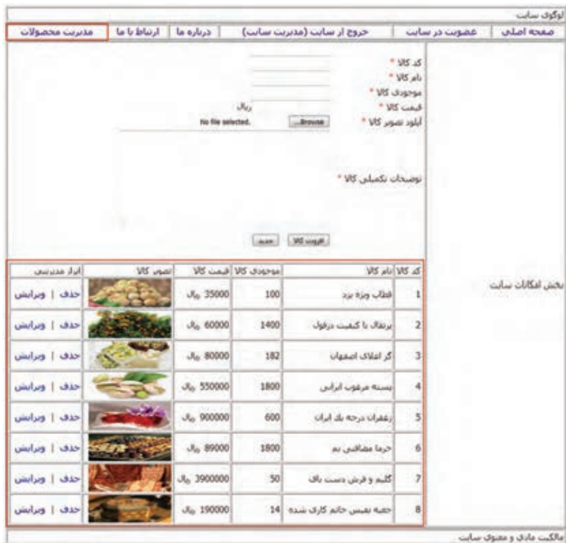
شکل ۱۳- صفحه مدیریت محصولات

۳ پرونده را ذخیره کنید و با حساب کاربری مدیر وارد سایت شده، خروجی را بررسی کنید.