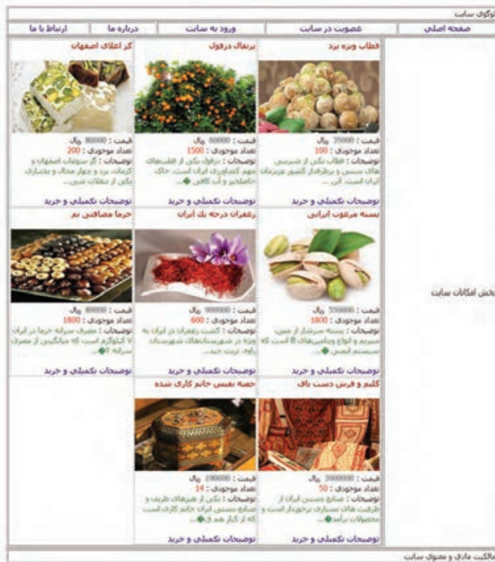
شکل ۵- فهرست محصولات