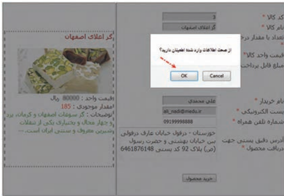
شکل ۱۰- دریافت تأیید کاربر برای صحت اطلاعات