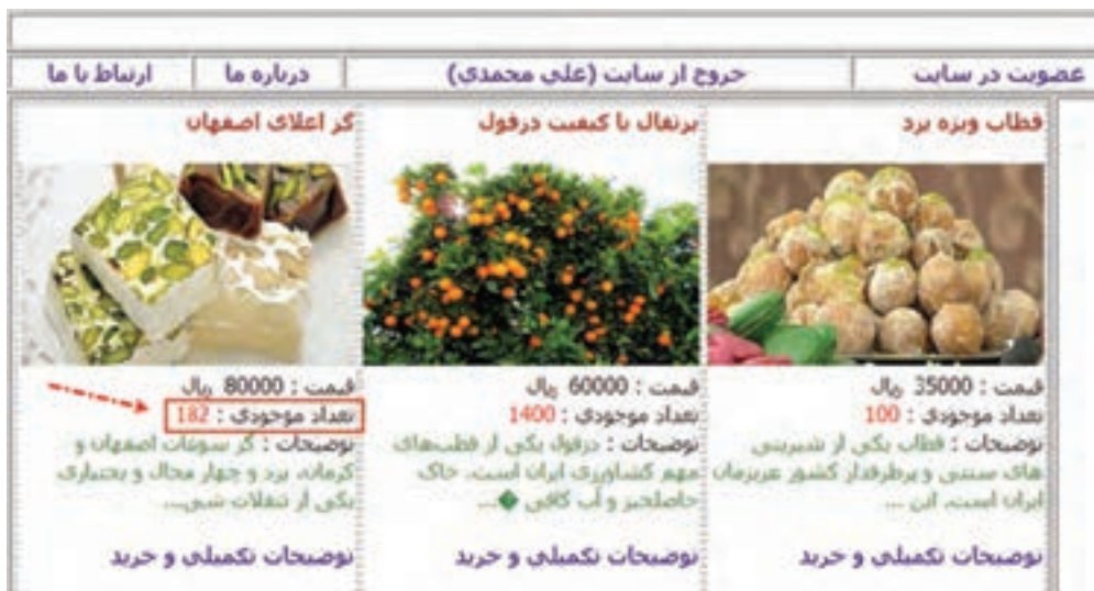
شکل ۱۲- تغییر موجودی انبار پس از خرید

در خرید (شکل ۱۱) با توجه به اینکه به مقدار ۳ کیلوگرم گز اعلای اصفهان خریداری شده است، باید از مجموع انبار کالا ۳ کیلوگرم کسر شود. قبل از خرید موجودی انبار ۱۸۵ کیلوگرم بود که پس از سفارش به مقدار ۱۸۲ کیلوگرم تغییر پیدا می‌کند (شکل ۱۲).