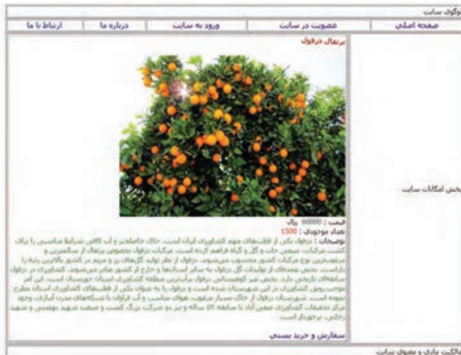
شکل ۶- جزئیات محصول انتخابی

در این کارگاه صفحه نمایش محصول با جزئیات کامل شامل قیمت، توضیحات و تعداد موجودی را ایجاد می‌کنیم (شکل ۶). صفحه‌ای که با کلیک روی محصول در فهرست محصولات به آن منتقل خواهیم شد. در این صفحه پیوند "سفارش و خرید پستی" برای کاربر وجود دارد که کاربر را به صفحه سفارش (order.php) برای خرید نهایی منتقل می‌کند.