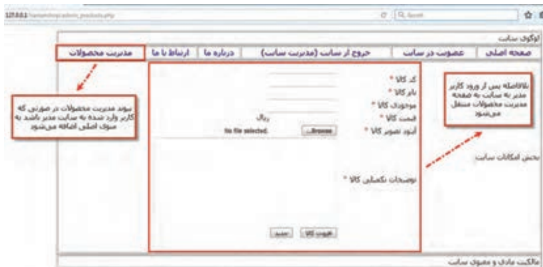
شکل ۴- صفحه ثبت محصولات

این نام و گذرواژه را در فعالیت‌های کارگاهی قبلی به عنوان یک کاربر مدیر ایجاد کرده‌اید. پس از ورود، به صفحه ثبت محصولات وارد می‌شوید (شکل ۴).