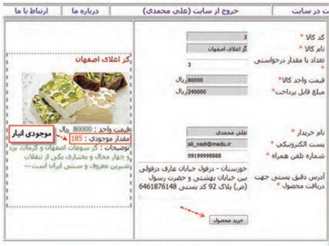
شکل ۹- فرم سفارش محصول

۷ تغییرات را ذخیره کنید و مراحل سفارش کالا را تا انتها طی کنید.