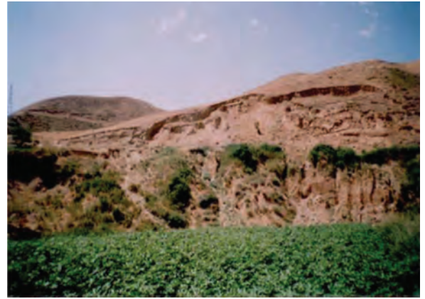
شکل ۷۰-۱ لغزش چرخشی در روستای اترآباد علیای بجنورد

سرمازدگی: به علت قرارگیری استان در مسیر اصلی ورود توده هوای سرد و خشک سیبری، در بعضی از سالها، تشدید فعالیت زبانه این توده هوا در اوایل پاییز (سرمازدگی زودرس) و اوایل بهار (سرمازدگی دیررس)، سبب سرمازدگی ناگهانی محصولات باغی و زراعی شده و خسارات زیادی را به کشاورزان استان وارد می کند.