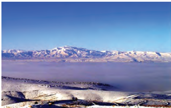
شکل ۷۴-۱ پدیده وارونگی دما در دشت بجنورد

جغرافیایی و محصور شدن برخی از شهرهای استان در میان کوه‌ها و پدیده وارونگی دما، باعث آلودگی هوای استان شده‌اند. در حال حاضر بیش از ۳۰۰ واحد صنعتی در استان مشغول فعالیت هستند. فعالیت این واحدها و شرایط طبیعی برخی از شهرهای استان سبب شده است این شهرها با مشکل آلودگی هوا مواجه شوند.