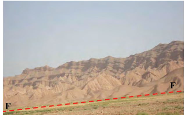
شکل ۱-۶۵- گسل امین آباد از گسل‌های فعال استان

سیل: بعد از زلزله، سیل مخرب‌ترین خطر طبیعی استان به حساب می‌آید. خراسان شمالی از نظر وقوع سیلاب در بین استان‌های کشور جایگاه دوم را دارد.