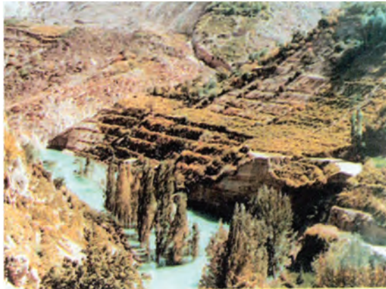
شکل ۷۱-۱ زمین لغزش در روستای اسطرخی شیروان