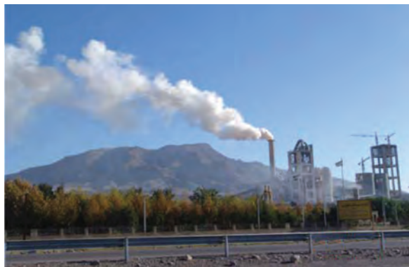
شکل ۷۳-۱ صنایع استان یکی از منابع آلودگی هوا

مسئولیت نظارت بر آلودگی هوا در استان بر عهده سازمان محیط زیست است. این سازمان جهت کاهش آلودگی هوا اقداماتی انجام داده است که از مهم‌ترین آنها می‌توان به موارد زیر اشاره نمود: