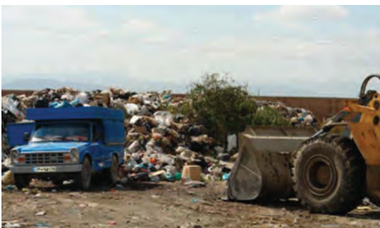
شکل ۷۶-۱- شیوه‌های نامناسب جمع‌آوری، انتقال و دفن زباله در استان