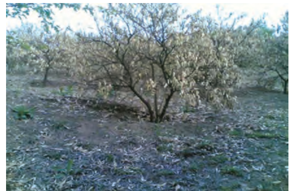
شکل ۷۲-۱ آثار سرمازدگی در باغات استان