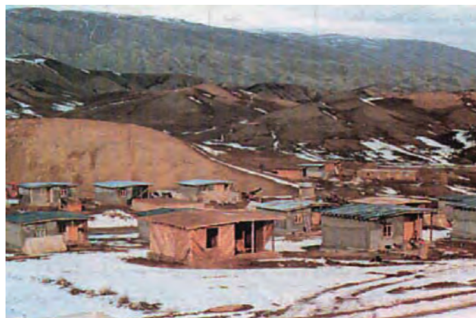
شکل ۱-۶۴- بازسازی روستای زلزله زده توب چنار شهرستان مانه و سملقان با استفاده از اسکلت زوگالی (چوبی)