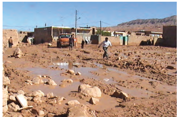
شکل ۱-۶۷- ورود سیلاب‌ها به مناطق مسکونی روستای فرتان اسفراین