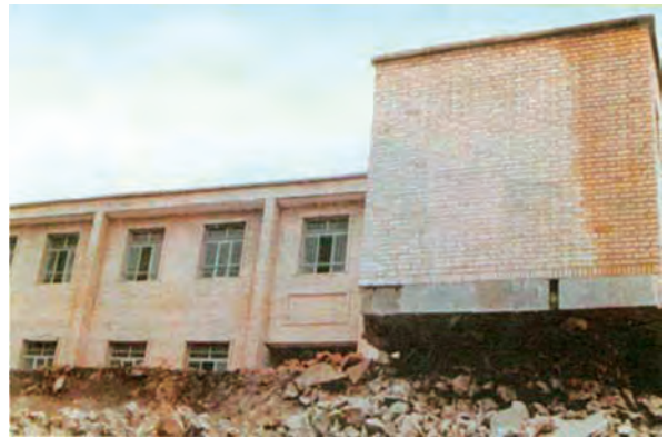
شکل ۱-۶۲- ساختمان دبستان روستای ناوه پس از زلزله