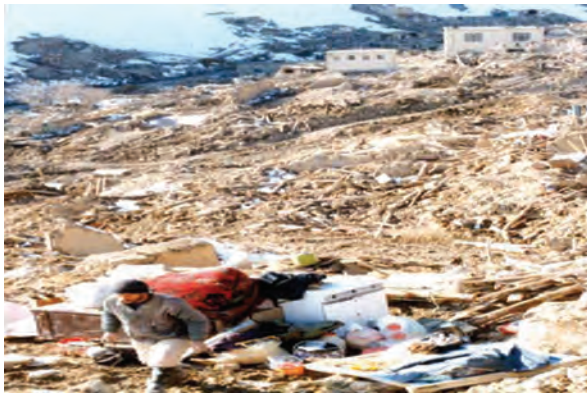
شکل ۱-۶۳- روستای ناوه پس از زلزله

زلزله: زلزله مخرب‌ترین پدیده طبیعی است که همه ساله خسارت‌های جانی و مالی زیادی به انسان‌ها وارد می‌کند. خراسان شمالی از استان‌های زلزله خیز کشور است. به علت فراوانی و طول زیاد گسل‌ها و جوان بودن چین‌خوردگی‌ها در استان، تاکنون زلزله‌های بسیاری در این استان به وقوع پیوسته است. از مخرب‌ترین آنها می‌توان به زمین لرزه‌های سال ۱۳۵۲ دهنّه اجاق در شهرستان اسفراین و زلزله ۱۹ بهمن سال ۱۳۷۵ روستای ناوه در شهرستان بجنورد اشاره نمود. هر چند، زلزله‌ها، سبب تخریب ساختمان‌ها می‌شوند ولی رعایت نکات ایمنی در ساختمان سازی می‌تواند تا حدودی از خسارات آن بکاهد. تأثیر این نکته را در مقایسه شکل‌های (۱-۶۲) و (۱-۶۳) می‌توانید به خوبی مشاهده کنید.