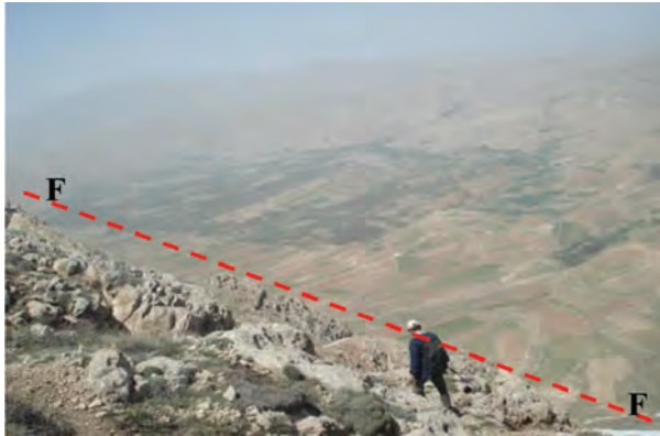
شکل ۱-۶۶- گسل سالوک از گسل‌های فعال استان

آخرین فعالیت گسل‌های استان مربوط به گسل امین آباد، در شمال غرب شهر اسفراین است که منجر به زمین لرزه‌ای با قدرت ۴/۵ درجه در مقیاس ریشتر شد. این زمین لرزه در نیمه شب جمعه ۱۸ آذرماه ۱۳۹۰ بر اثر فعال شدن قسمت شمال غربی این گسل رخ داد. این زلزله خسارات مالی و جانی نداشت ولی سبب ترس و وحشت مردم شد.