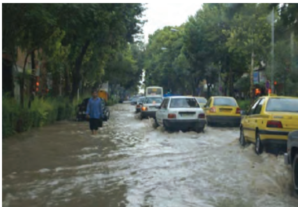
شکل ۱-۶۸- آب‌گرفتگی خیابان‌های شهر بجنورد در سیلاب سال ۱۳۸۷

علل وقوع سیلاب در استان منشأ طبیعی و انسانی دارد. از مهم‌ترین دلایل طبیعی آن می‌توان به ذوب ناگهانی برف و یخ در کوهستان‌ها، بارش‌های رگباری، کم شدن پوشش گیاهی و شیب زمین و از مهم‌ترین عوامل انسانی می‌توان به عدم اعمال مدیریت صحیح در حوضه‌های آبخیز، برداشت غیر اصولی مصالح رودخانه‌ای، تجاوز به حریم رودخانه‌ها، توسعه شهرها و روستاها در عرصه‌های سیل‌گیر اشاره نمود.