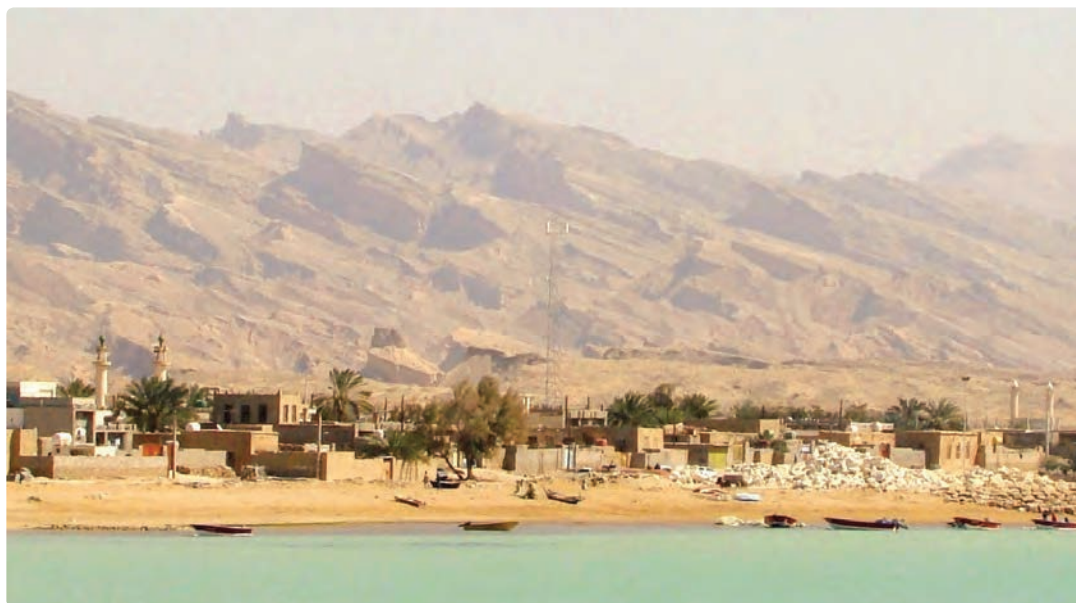
شکل ۶-۷- تصویری از روستای ساحلی خورشهاب

— راه ارتباطی : بیشتر روستاها به موازات شبکه خطوط ارتباطی اصلی در سطح استان شکل گرفته‌اند، به طوری که حیات روستاهای جاده‌ای به رفت و آمد در راه‌های ارتباطی موجود وابسته‌اند و فعالیت‌های خدماتی نقش اساسی در توسعه و رونق این روستاها دارد.