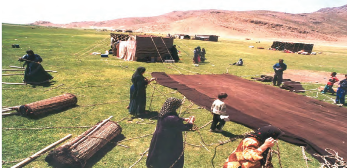
شکل ۴-۷- سیاه جادر از صنایع دستی عشایر قشقایی