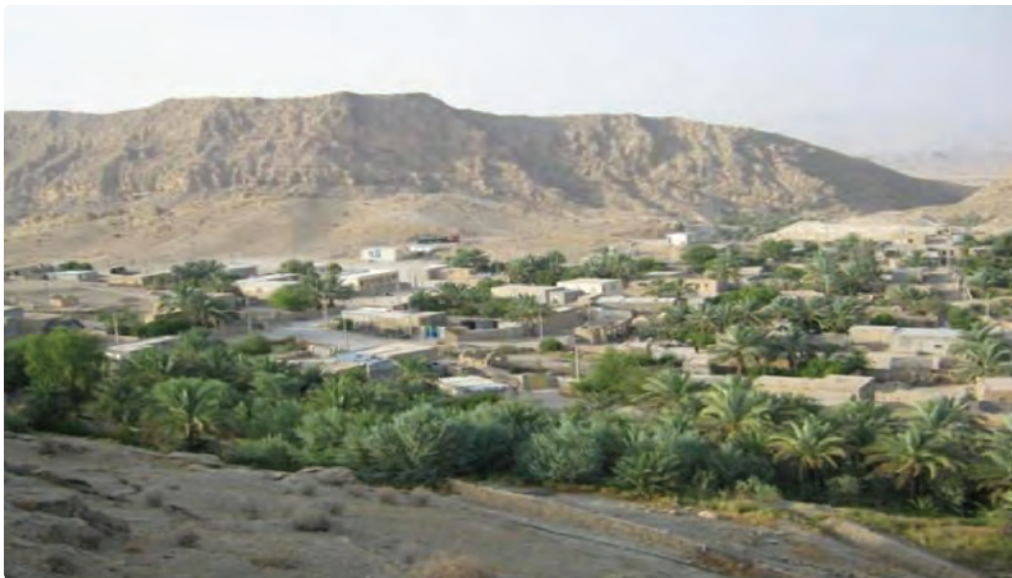
شکل ۵-۷- روستای کوهستانی سرمک

— خاک : وجود خاک‌های شور در بیشتر نقاط استان مانع جدی در استقرار روستاهای استان بوده است. دشت‌های دامنه‌ای به دلیل نداشتن محدودیت‌های خاک نواحی کوهستانی و دشت‌های پست از شرایط مساعد و مناسب طبیعی برخوردار و امکان استقرار جمعیت را فراهم آورده‌اند.