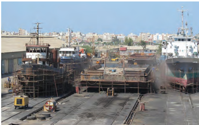
شکل ۷-۷- نمایی از بندر بوشهر

قدیمی ترین نشانه‌های به دست آمده از سکونت انسان در سرزمین بوشهر به دوران حکومت ایلامی ها و تمدن بین النهرین بر می گردد. منطقه تجاری بوشهر در آن زمان دهکده ای به نام لیان بود. از دوره هخامنشیان نیز آثار با ارزشی در شهرستان دشتستان کشف شده است. در زمان اردشیر بابکان شهر رام اردشیر در دو فرسنگی شهر بوشهر بنا گذاشته شد که اکنون به نام ریشهر معروف است. نحوه شکل گیری مراکز شهری استان بیانگر استقرار جمعیت و فعالیت های اقتصادی وابسته به منابع آب و فعالیت های مرتبط با دریا در ساحل می باشد. شکل گیری این مراکز از شمالی ترین نقطه استان تا جنوبی ترین آن که عمدتاً بر روی نوار ساحلی، دشت ها و کوهپایه ها بوده که نشانگر توزیع مناسب آنها از نظر استقرار و فاصله بین این مراکز است. شهر بوشهر به عنوان مرکز استان و دیگر شهرهای ساحلی از دیر باز مراکز تجارت و فعالیت های بندری بوده اند.