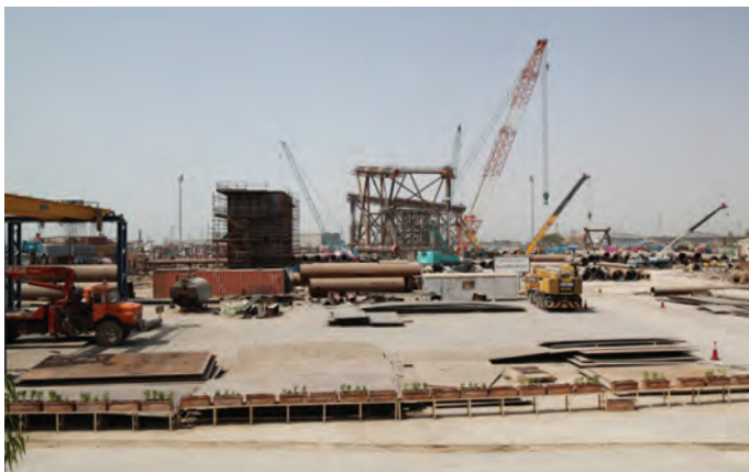
شکل ۷-۸- نمایی از بندر دیر

بندر بوشهر: بوشهر بندری است شبه جزیره ای در بخش مرکزی شهرستان بوشهر که از سمت شمال غرب و جنوب به خلیج فارس محدود شده است. این بندر در منطقه ساحلی خلیج فارس واقع شده و به خاطر عواملی مانند صیادی، وجود نیروگاه اتمی، کشتی سازی و صادرات رونق اقتصادی دارد.