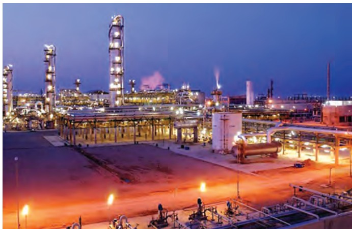
شکل ۹-۷- نمای از بندر عسلویه

بندر عسلویه : این بندر مرکز شهرستان عسلویه می‌باشد. عسلویه یک منطقه عظیم صنعتی از توابع استان بوشهر در جنوب ایران است و مهم‌ترین پایگاه اقتصادی ایران و بزرگ‌ترین منطقه تولید انرژی جهان است. از دیگر بنادر استان بوشهر به کنگان و منطقه گناوه و دیلم می‌توان اشاره نمود.