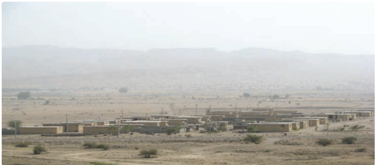
شکل ۳-۷- اسکان عشایر در ایل شهر بوشکان

شغل اصلی عشایر علاوه بر دامداری، تولید صنایع دستی، زراعت و باغداری می‌باشد. مناطق استقرار عشایر در استان به ترتیب جمعیت، شهرستان‌های دشتستان - دشتی - تنگستان - دیروجم را در بر می‌گیرد. مناطق بیلاقی عشایر استان بوشهر در استان فارس شهرستان‌های اقلید، صغاد، بهمن، مرودشت و شیراز، در استان اصفهان سمیرم و شهرضا و در استان چهارمحال و بختیاری بروجن و بلداجی است.