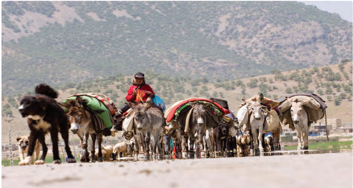
شکل ۲-۷- کوچ عشایر استان

شغل اصلی عشایر علاوه بر دامداری، تولید صنایع دستی، زراعت و باغداری می‌باشد. مناطق استقرار عشایر در استان به ترتیب جمعیت، شهرستان‌های دشتستان - دشتی - تنگستان - دیروجم را در بر می‌گیرد. مناطق بیلاقی عشایر استان بوشهر در استان فارس شهرستان‌های اقلید، صغاد، بهمن، مرودشت و شیراز، در استان اصفهان سمیرم و شهرضا و در استان چهارمحال و بختیاری بروجن و بلداجی است.