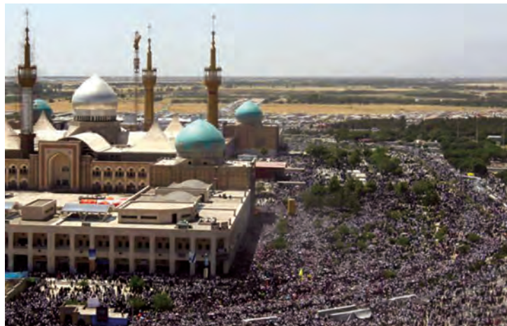
شکل ۱۷-۴- حرم مطهر امام خمینی (قُدَس سِرُّه)

اکنون نیز جای آن دارد که با پاس داشتن خون شهدای گرانقدر، حفظ دستاوردهای رشادت‌های آن عزیزان و ادامه راه آن‌ها، رضایت خداوند بزرگ را نیز فراهم آوریم.