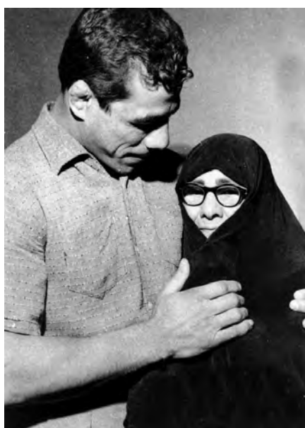
شکل ۱۵-۴- جهان پهلوان تختی

از روحانیان ممتاز می‌توان از مرحوم آیت‌الله طالقانی یاد کرد. او شکنجه‌های بسیاری در زندان طاغوت کشید و از یاران امام خمینی (ره) و اولین امام جمعه تهران پس از انقلاب بود. آیت‌الله طالقانی شاگردان بسیاری برای مبارزه با رژیم ستم‌شاهی تربیت کرد که شهید چمران یکی از کسانی بود که در مجالس درس ایشان شرکت می‌کرد.