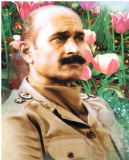
شکل ۱۰-۴- شهید فلاهی

از دیگر کمک‌های مردمی به رزمندگان علاوه بر اهدای کالا، می‌توان به اهدای خون نیز اشاره کرد. مردم هر وقت احساس می‌کردند به خون آن‌ها نیاز است، دریغ نمی‌کردند. همچنین، آنان با شرکت فعال در راهپیمایی‌ها به مناسبت‌های مختلف، به رغم بمب‌گذاری‌ها و حملات هوایی دشمن، موجب تقویت روحیه رزمندگان می‌شدند و دشمنان را مأیوس می‌کردند.