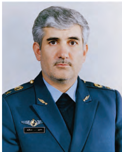
شکل ۹-۴- شهید ستاری