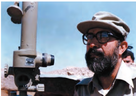
شکل ۱۱-۴- شهید دکتر مصطفی چمران