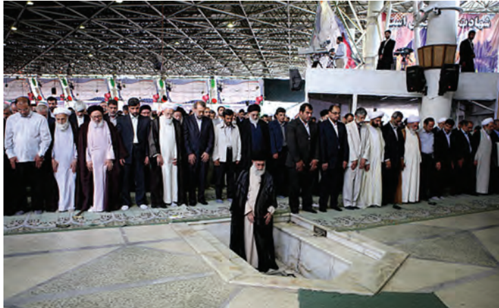
شکل ۱۶-۴- نماز جمعه تهران به امامت حضرت آیت الله خامنه‌ای رهبر معظم انقلاب اسلامی

مردم تهران نه تنها در صحنه دفاع حضور فعال داشتند بلکه با تشکیل ستاد معین بازسازی، همچنان حضور خود را در صحنه حفظ کردند و در زمینه آبادسازی مناطق آزاد شده به خصوص خرمشهر، به تلاش‌های خود ادامه دادند.