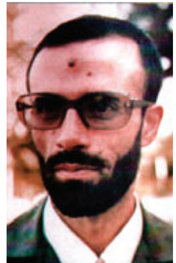
شکل ۸-۴- شهید کلاه‌دوز