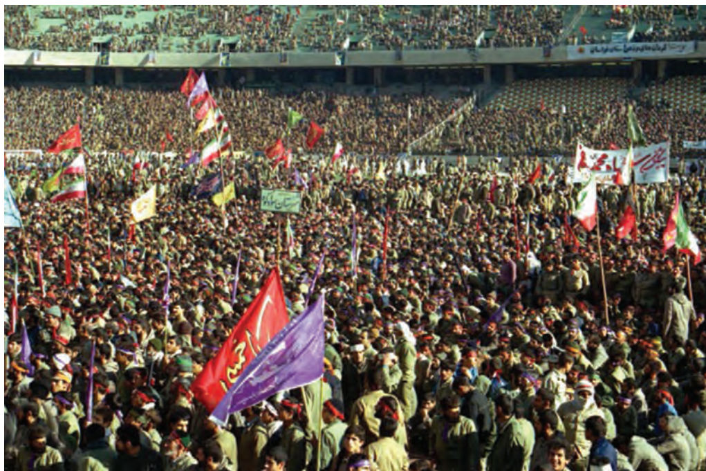
شکل ۷-۴- اعزام سراسری یکصد هزار نفری سپاه حضرت محمد (ص) از شهر تهران

شهر تهران به دلیل مرکزیت سیاسی، نقش بسیار ارزشمندی در دفاع از کیان اسلامی در دوران هشت سال دفاع مقدس بر عهده داشت. استان تهران اگرچه از نظر جغرافیایی دور از مرزها به سر می برد، ولی به واسطه پایتخت بودن و پشتیبانی خطوط جبهه، تقریباً مانند شهرهای مرزی مورد حملات هوایی قرار می گرفت. تهران به دلیل برخورداری از استعدادهایی در زمینه جذب و انتقال نیرو نسبت به سایر شهرها موقعیت ویژه ای داشت، به همین جهت، از اولین شهرهایی بود که در آغاز جنگ تحمیلی مورد حمله قرار گرفت. وجود پادگان های متعدد و فرودگاه های نظامی، خود استعداد بالقوه ای برای جذب نیروهایی شده بود که در بدو پیروزی انقلاب به دامن مردم پناه آورده بودند و پس از آغاز جنگ، عمده آن ها به پادگان ها برگشتند و به دفاع از سرزمین مقدس خود پرداختند. استان تهران با برخورداری از جمعیت کثیری نسبت به سایر استان ها و دارا بودن پادگان ها و مراکز دفاعی متعدد، به طور طبیعی نقش بسیار خطیری در دفاع از میهن اسلامی بر عهده داشت. با آغاز جنگ تحمیلی علیه جمهوری نوپای اسلامی، حضور داوطلبانه و فعال نیروهای مردمی، بسیاری از مشکلات را حل کرد. علاوه بر آن، حضور ارزشمند نیروهای مردمی در قالب نیروهای داوطلب، از پایگاه های بسیج ادارات و مساجد نیز شکوه دیگری از این عظمت را نشان داد که اوج آن را در اعزام سراسری یکصد هزار نفری سپاه حضرت محمد (ص) شاهد بودیم.