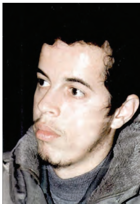
شکل ۱۲-۴- شهید حسن باقری

از روحانیان ممتاز می‌توان از مرحوم آیت‌الله طالقانی یاد کرد. او شکنجه‌های بسیاری در زندان طاغوت کشید و از یاران امام خمینی (ره) و اولین امام جمعه تهران پس از انقلاب بود. آیت‌الله طالقانی شاگردان بسیاری برای مبارزه با رژیم ستم‌شاهی تربیت کرد که شهید چمران یکی از کسانی بود که در مجالس درس ایشان شرکت می‌کرد.