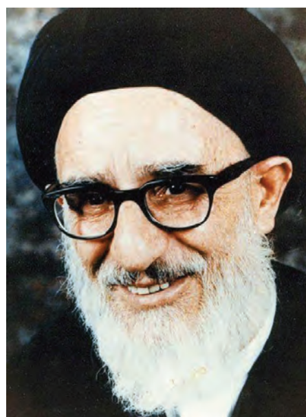
شکل ۱۴-۴- مرحوم آیت‌الله طالقانی