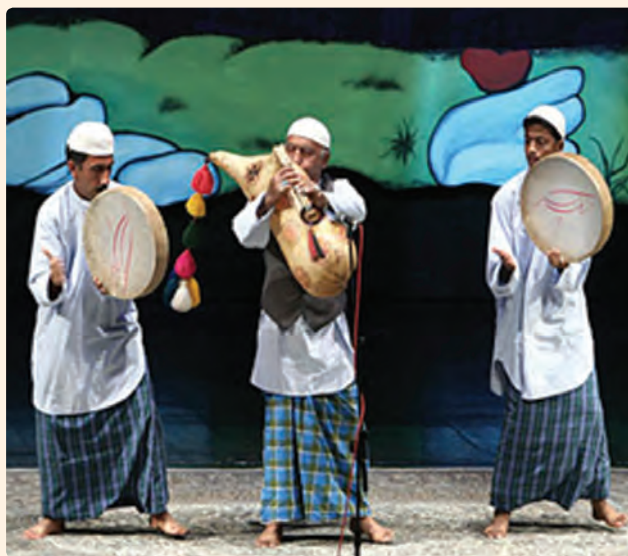
شکل ۱۶-۹- اجرای ساز نی امیان

البته موسیقی استان متقابلاً بر موسیقی ملی ایران تأثیر گذار بوده است، از جمله در ردیف موسیقی سنتی ایران، بسیاری از گوشه‌های آواز دشتی در ردیف سنتی متأثر از شروه و آوازهای رایج در منطقه دشتی، دشتستان و تنگستان و... می‌باشد.