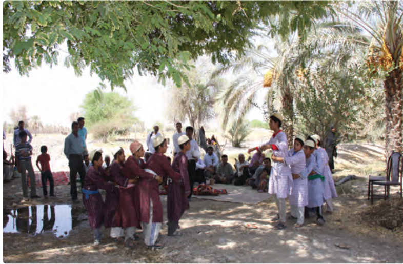
شکل ۱۴-۹- بازی هل هله گرگ چنبری