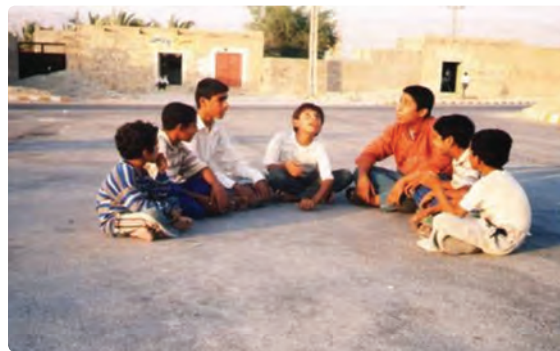
شکل ۱۳-۹- تصاویری از بازی‌های محلی در استان بوشهر