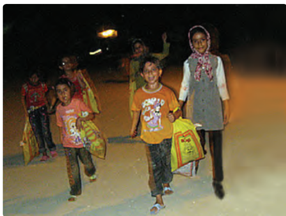
شکل ۱۱-۹- مراسم گره گشو در شهرستان دیر

به سبب آنکه این رسم در ماه مبارک رمضان صورت می‌گیرد می‌توان انجام آن را در اعتقادات مذهبی شیعیان جست و جو کرده و به روز تولد امام حسن مجتبی علیه السلام مربوط دانست.