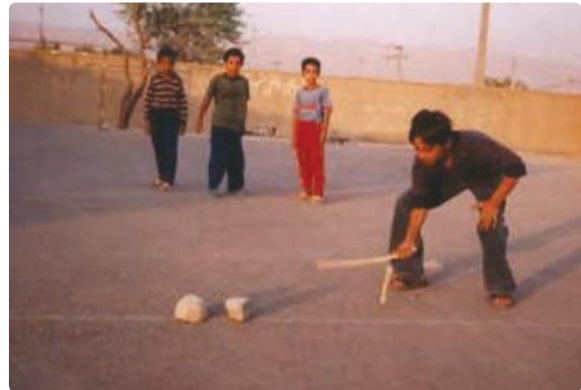
شکل ۱۵-۹- بازی چوکیلی