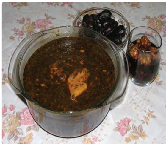
شکل ۹-۶ - قلیه ماهی

در استان بوشهر به دلیل نزدیکی به دریا اکثر غذاهای سنتی از آبریان تهیه می‌شود و مردم منطقه کوهستانی و دشت نشین از غذاهایی استفاده می‌نمایند که بیشتر در آنها گندم، لبنیات و خرما به کار رفته است. قلیه ماهی و میگو، تنداز ماهی، گمنه(للك)، رشته، لخ لاخ، عدس، مرغ شکم گرفته، ماهی شور، شکرپلو، قیمه، پهتی، برنجوش، دال عدس، کشکنه و... از انواع غذاهای استان است و رنگینک، حلوا خرمایی و... به عنوان پیش غذا در میان مردم استان رایج است.