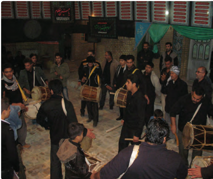
شکل ۹-۹- مراسم دمام زنی

جشن ها و آیین های استان بوشهر به جشن های مذهبی و ملی تقسیم می شوند. جشن های بزرگ مذهبی شامل جشن میلاد حضرت محمد (ص)، میلاد حضرت علی (ع)، میلاد حضرت امام زمان (عج)، عید فطر، عید قربان از جمله اعیاد مذهبی هستند که باشکوه خاصی برگزار می شوند. مراسم عید نوروز به عنوان جشن ملی مانند دیگر استان های کشور در استان بوشهر اجرا می شود. مراسم سنج و دمام زنی: استفاده از سنج، دمام و بوق که هم زمان در مراسم عزاداری نواخته می شود، ابتدا برای خبر کردن از آن استفاده می شد که بعدها جزئی از مراسم عزاداری گردیده است.