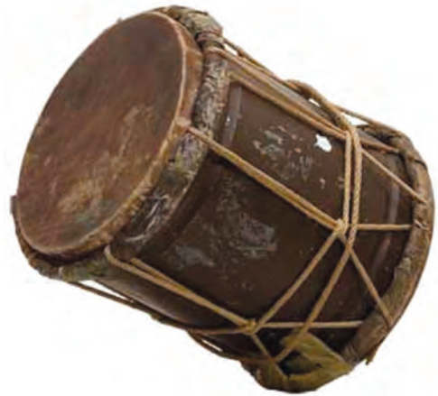
شکل ۸-۹- دمام

مراسم سینه زنی: این مراسم مذهبی با نوحه خوانی شخصی که به عنوان پیش خوان یا سرخوان شناخته شده آغاز می شود. در ابتدای مراسم، نوجوانان، جوانان و دست اندرکاران مسجد، گرد پیش خوان حلقه ای دایره ای شکل تشکیل می دهند که به آن «بر(Bor)» می گویند. سینه زنی در تعزیت پیشوایان دینی و مذهبی در شهرها و روستاهای استان برگزار می گردد.