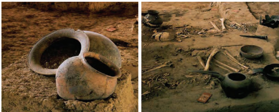
شکل ۱-۴- نمونه هایی از آثار به دست آمده در گوهر تپه

در سراسر جلگه های مازندران تپه های باستانی وجود دارند که برخی از آنها با نام های عمومی و محلی «دین» شناخته می شوند. برخی از آنها توسط باستان شناسان مورد کاوش قرار گرفته اند. یکی از این تپه های معروف «گوهر تپه»، در شهرستان بهشهر است. در حفاری های گوهر تپه شواهدی از ساختارهای معماری با دیوارهای خشتی و سنگی، تدفین مردگان به شکل ساده و قرار دادن اشیاء در کنار آنها، سفال، پیکرک انسانی و حیوانی، صنایع سنگی از جمله مهر و اشیایی از جنس مفرغ و آهن از جمله خنجر، لوازم آرایشی و دوک نخ رسی به دست آمده است.