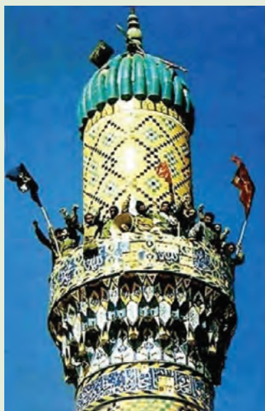
شکل ۹-۴- سلحشوران مازندرانی بر فراز مسجد شهر فاو

تیم ده نفره کربلا در خرمشهر، بعدها به گروهان و در عملیات ثامن الائمه به دو گردان و در عملیات طریق القدس به تیپ ۲۵ کربلا و پس از عملیات محرم به لشکر ویژه ۲۵ کربلا ارتقا یافت و تنها لشکر ویژه سپاه بود. حضور فعال و چشمگیر در ۲۲ عملیات، به ویژه فتح حماسی و غرورآفرین فاو در عملیات والفجر ۸، شاهکار رزمندگان و شهدای این لشکر بود که موجب تعجب و تحسین کارشناسان نظامی دنیا قرار گرفت.