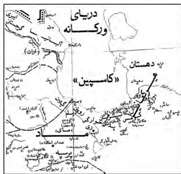
شکل ۲-۴- مازندران در دوره ساسانیان