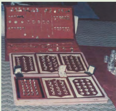
شکل ۱۱-۴- بخشی از زیورآلات اهدایی مردم مازندران به جبهه

- احداث جاده‌ها، پل‌ها، خاکریزها، سنگرها، حفر کانال‌ها و تثبیت خطوط عملیاتی در مناطق جنگی توسط