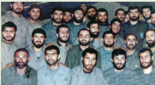
شکل ۱۰-۴- تصویر برخی از علمداران لشکر ۲۵ کربلا

از ارتش جمهوری اسلامی ایران به طور خاص و سایر یگان‌های ارتش در سطح ملی از توانایی‌های امیران و رزمندگان مازندران بهره‌مند بودند.