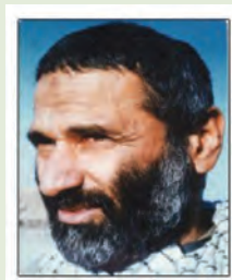
شهید حاج حسین جان بصیر

در شب عاشورای سال ۱۳۲۲ در فریدونکنار چشم به جهان گشود. کودکی و نوجوانی او با فعالیت‌های مذهبی و مداحی برای اهل بیت (ع) طی شد. در سال ۱۳۴۲ با اینکه سرباز بود، در سخنرانی معروف امام حاضر شد و بعدها نیز با استمرار مبارزات خود به‌ویژه در برپایی راهپیمایی‌ها نقش فعالی داشت. پس از پیروزی انقلاب اسلامی نیز مدتی برای مبارزه با شوروی و حکومت وابسته به آن در افغانستان، به این کشور سفر کرد. از نخستین روزهای شروع جنگ عازم جبهه‌ها شد و در واحدهای مختلف نظامی از خود