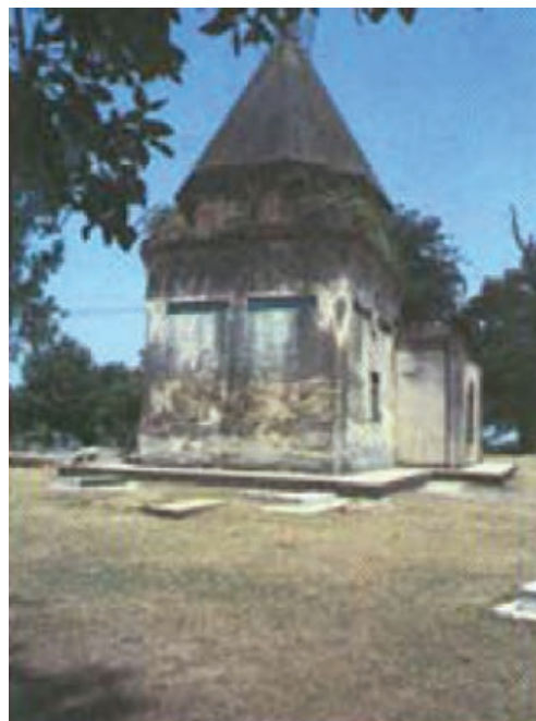
شکل ۴-۴- امامزاده زرین نوا- قائم شهر