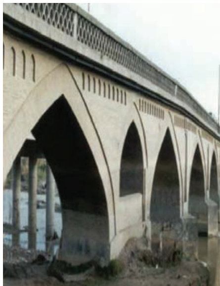
شکل ۷-۴- پل محمدحسن خان - بابل

در دوره قاجاریه، پس از انتخاب تهران به پایتختی ایران بر اهمیت مازندران افزوده شد. ناصرالدین شاه قاجار به مازندران سفر کرد و به آبادانی این منطقه همت گماشت. مازندران در دوره مشروطه نیز همانند شهرهای دیگر ایران در برپایی مشروطه نقش داشت و عده‌ای به حمایت از مشروطه پرداختند. در این دوره انجمن‌هایی در سطح شهرها تأسیس شد از جمله انجمن سعادت و انجمن حقیقت در ساری که در توسعه مرام مشروطه و افکار جدید می‌کوشیدند.