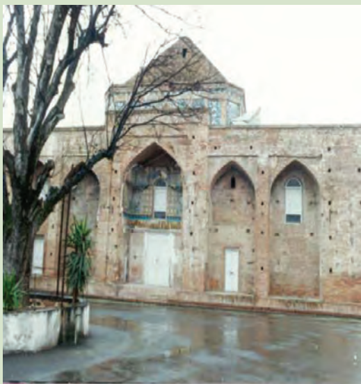
شکل ۴-۶- آرامگاه میرقوام الدین مرعشی - آمل

مرعشیان و حمله تیمور به مازندران: پس از فروپاشی ایلیخانان مغول، قلمرو ایلیخانان دچار آشفتگی شد و حکومت‌های محلی کوچک توسط سرداران مغول و خاندان‌های ایرانی تأسیس شد. یکی از این حکومت‌ها، حکومت سربداران خراسان بود که برای تصرف مازندران به این سرزمین لشکرکشی کردند ولی شکست سنگینی را متحمل شدند. این دوران پر آشوب و ناامن به اقتصاد مازندران به ویژه کشاورزی آسیب فراوان رساند. در این زمان که ستمگری شدت یافته بود مردم به سادات علوی روی آوردند و دو قیام در مازندران به رهبری سادات روی داد.