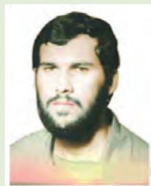
شهید محمدحسن قاسمی طوسی

علمدار لشکر ویژه ۲۵ کربلا، سردار سرلشکر شهید محمد حسن قاسمی طوسی :