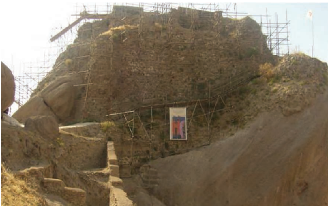
شکل ۲-۴- قلعه حسن صباح الموت، در حال مرمت