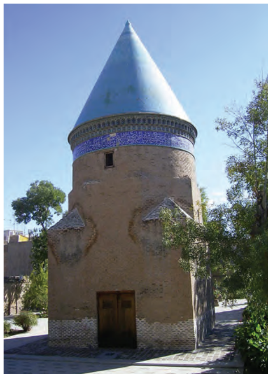
شکل ۶-۴- آرامگاه حمدالله مستوفی

حمدالله مستوفی : او نویسنده و مورخ و جغرافیدان معروف سده هشتم (تولد ۶۸۰هـ. و وفات ۷۵۰هـ.ق) و مؤلف تاریخ گزیده نزه القلوب و ظفرنامه، در دوره ایلخانان مغول می‌باشد. مستوفی در کارهای دیوانی و محاسباتی سرآمد بود. مزار او در محله ملک‌آباد قزوین واقع است.