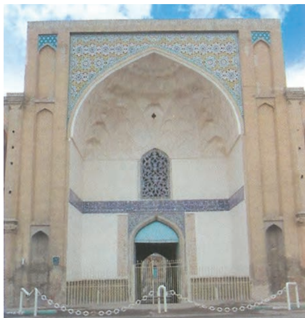
شکل ۳-۴- سردر عالی قابو از بناهای دوران صفویه

ورود سپاهیان مغول به ایران موجب ویرانی‌های بسیاری شد. با ورود آنان به شهر قزوین مردم شهر، تا سه روز با رشادت و شجاعت در مقابل مغولان مقاومت کردند، اما در نهایت سپاه مهاجم وارد شهر شد و خسارات فراوانی بر آن وارد کرد. پس از پایان حکومت مغولان و نبود حکومت قوی، صفویان توانستند دولتی نیرومند در ایران تأسیس نمایند و ثبات و نظم را به کشور بازگردانند. در زمان شاه تهماسب اول (۹۸۴-۹۳۰ ه.ق) قزوین به‌عنوان پایتخت ایران برگزیده شد و این موجب رونق و توسعه شهر گردید و واحدهای تجارتی جدیدی چون: کاروانسراها، بازارها و قیصریه‌ها در آن بنا شد. کالاها از نواحی مختلف به سوی آن سرازیر شد و راه‌های تجارتی توسعه و رونق یافت.