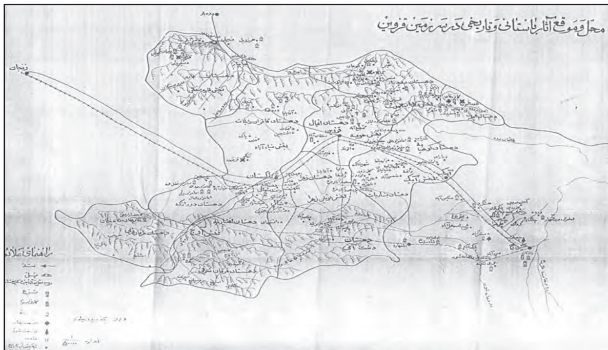
شکل ۱-۴ محل و موقع آثار باستانی و تاریخی در سرزمین قزوین