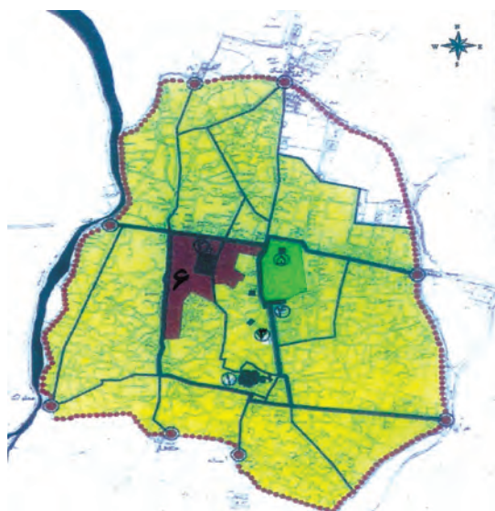
شکل ۴-۴- شهر قزوین در دوره قاجاریه

هـ. ق) پس از پیروزی بر افغان‌ها عازم قزوین شد. او به هنگام اقامت در قزوین تاجی را که بزرگان محلی در اختیارش نهاده بودند به سر نهاد و در داخل ارگ قزوین کوشکی بنا نهاد و تالاری برای پذیرایی پی افکند که به نام تالار نادری معروف شد. با مرگ نادر و درهم ریختگی اوضاع کشور، کریم خان زند (۱۱۹۳-۱۱۶۳ هـ. ق) بر تخت پادشاهی ایران نشست. قزوین در این دوره جزئی از حاکمیت این سلسله به‌شمار می‌رفت. با تأسیس سلسله قاجاریه، قزوین توسط حکام منصوب دربار قاجار یا نمایان آنان که بیشتر از شاهزادگان و وابستگان دربار بودند اداره می‌شد.