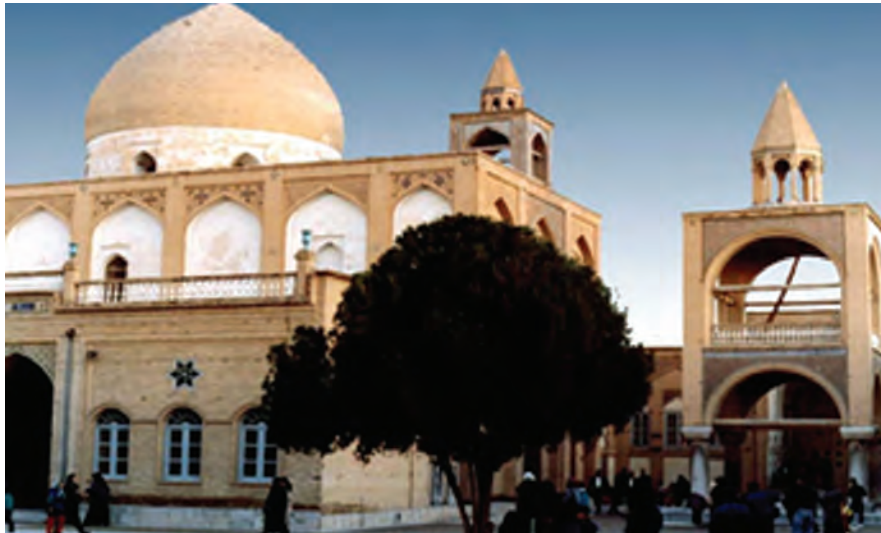
شکل ۹-۴- کلیسای وانک - اصفهان