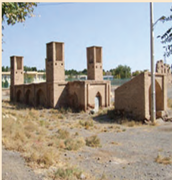
شکل ۳-۴- آب انباری در کوهپایه