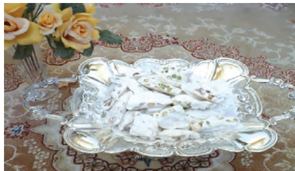
شکل ۱۰-۴- گز اصفهان

● فراوانی آثار تاریخی و فرهنگی در اصفهان موجب شده که آن را موزه شهر ایران بنامند و این شهر به عنوان پایتخت فرهنگی جهان اسلام در سال ۲۰۰۶ انتخاب شود.