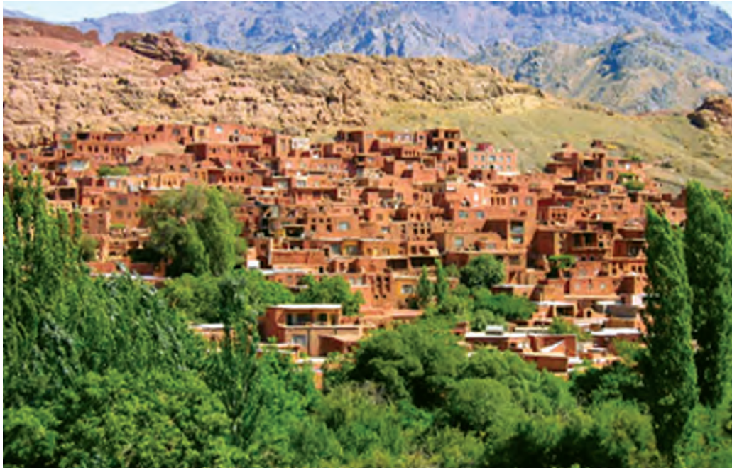
شکل ۷-۴- چشم اندازی از روستای گردشگری ایبانه