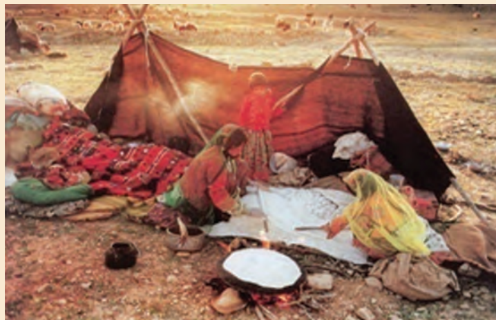
شکل ۴-۶- زندگی کوچ نشینان - گردشگری عشایری