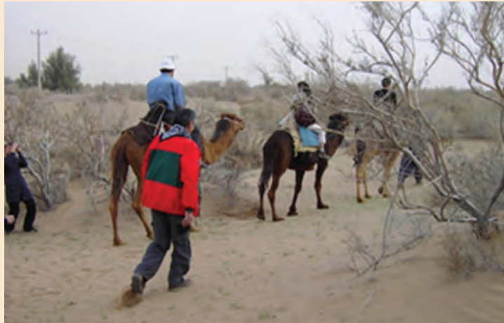
شکل ۴-۴- شترسواری در بیابان - روستای مصر