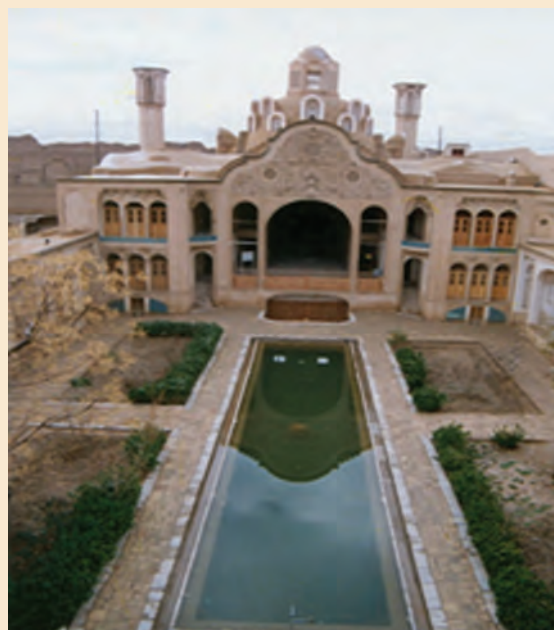
شکل ۲-۴- خانه‌ای قدیمی در کاشان