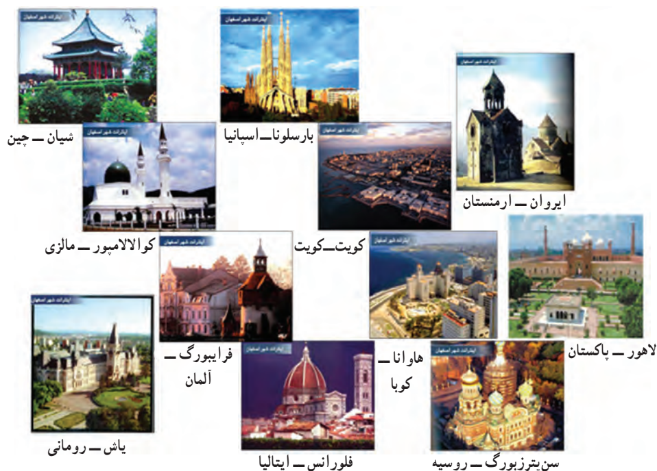
شکل ۸-۴- خواهر خوانده‌های شهر اصفهان

در این استان، شهر اصفهان با برخورداری از ویژگی‌های معماری اصیل ایرانی - اسلامی و حفظ بن‌مایه‌های هویت تاریخی در سنت شهرسازی و همچنین توسعه روابط بین فرهنگی در قالب عقد خواهر خواندگی با ۱۳ شهر از شهرهای بزرگ دنیا همواره گزینه‌ای مطلوب برای گردشگران داخلی و خارجی به‌شمار می‌رود.