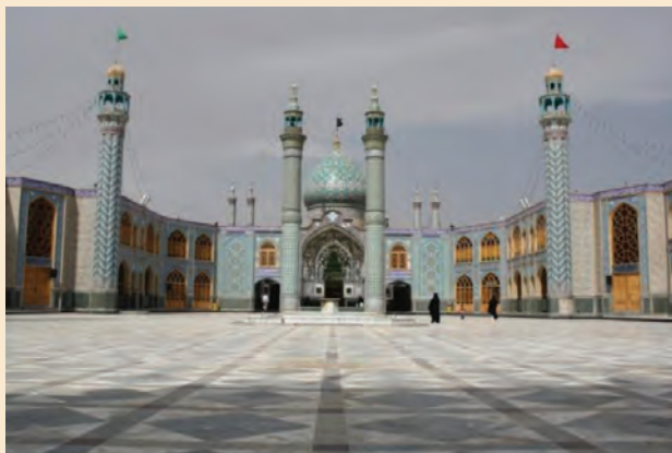
شکل ۱-۴- امامزاده هلال‌بن علی - آران و بیدگل