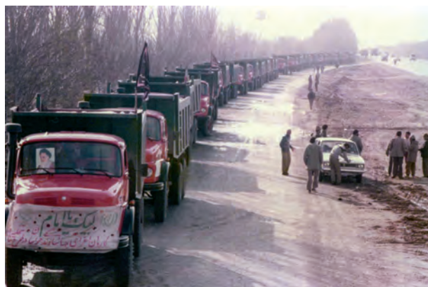
شکل ۱۶-۴- ارسال کمک‌های مردمی به جبهه توسط جهاد سازندگی خراسان