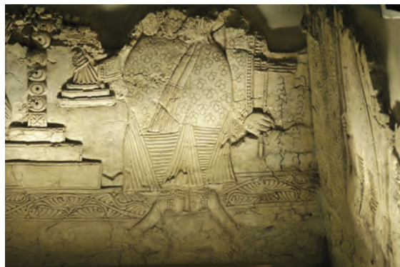
شکل ۴-۳ مجموعه آثار بندیان دوره ساسانیان — درگز