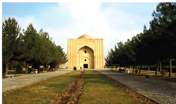
شکل ۴-۵ هارونیه — توس

خراسان پس از ورود اسلام به ایران : استقرار حاکمان اموی در خراسان و سخت گیری و ظلم آنان در منطقه خراسان و مهاجرت و فرار گروه های سیاسی — مذهبی مخالف حکومت اموی؛ خراسان را به کانون مبارزه علیه دولت بنی امیه تبدیل کرد. سرانجام از میان این مخالفین، سردار معروف خراسانی ابومسلم قد برافراشته و حکومت بنی امیه را از بین برد و قدرت به عباسیان رسید.