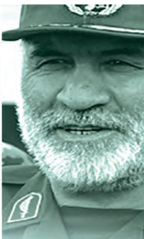
شهید نورعلی شوشتری - جانشین نیروی زمینی سپاه