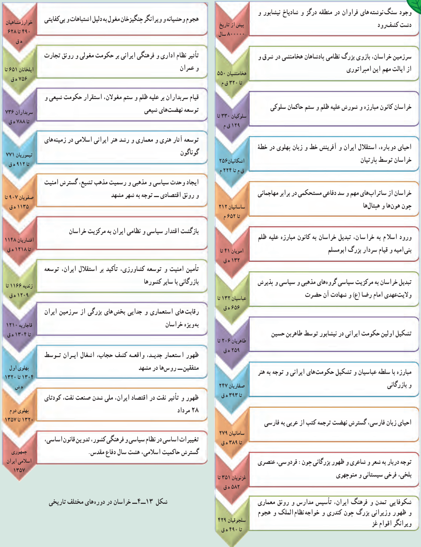
شکل ۱۳-۴ خراسان در دوره‌های مختلف تاریخی