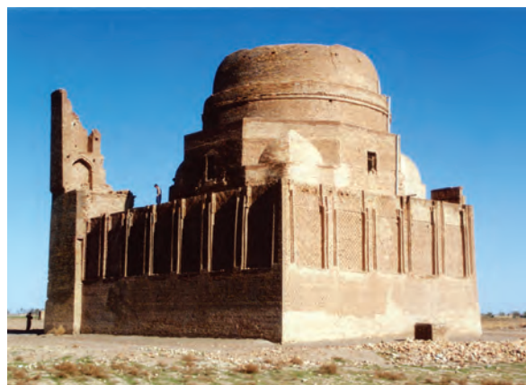
شکل ۶-۴- مقبره بابا لقمان - سرخس