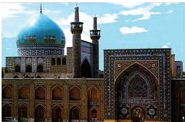
شکل ۹-۴ — مسجد جامع گوهر شاد — مشهد

سربداران: در سال ۷۳۷ ه.ق امیر عبدالرزاق از مردان ظلم‌ستیز منطقه سبزوار، در قریه باشتین علیه حکام مغولی قیامی را آغاز کرد و موفق به تشکیل دولت شیعی مذهب به نام سربداران در سبزوار و بخشی از خراسان گردیدند. پس از سقوط دولت سربداران روند نفوذ و گسترش مذهب شیعه در بخش‌هایی از خراسان همچنان تداوم یافت. پس از مدتی در سال ۷۸۱ ه.ق خراسان بار دیگر مورد حملات ویرانگر تیمور واقع شد، اما نوادگان او تسلیم فرهنگ اسلامی-ایرانی شده و با تأسیس دولت تیموریان (به ویژه در خراسان) عامل ایجاد آثار هنری و معماری ماندگاری شدند.