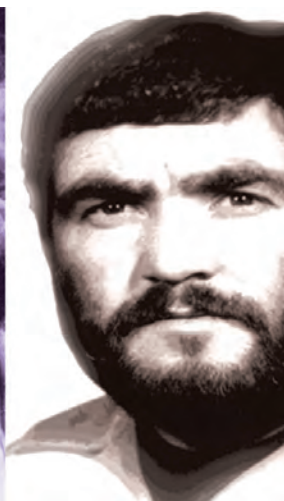
شهید محمد بابارستمی - مسئول عملیات سپاه خراسان