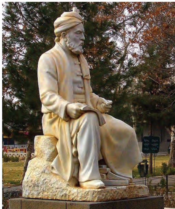
شکل ۱-۴- فردوسی شاعر حماسه سرای ایران

اگر ادبیات و زبان باستانی در ایران مورد بررسی قرار گیرد، بی شک بخش عمده آن ریشه در خراسان بزرگ دارد. خط و زبان پهلوی متعلق به عصر اشکانیان و آنان نیز منتسب به خراسان هستند. از اواخر دوره ساسانی و سده های پس از اسلام، خراسان محل ظهور زبان دری گردید. امروزه هرگاه از فارسی دری سخنی به میان می آید، منظور زبان مردم خراسان است. خراسان در گستره فرهنگ و تمدن ایران اسلامی پرچم دار انتقال فرهنگ و تمدن بین شرق و غرب بوده است. وجود فِرَق و اندیشه های مختلف در خراسان، زمینه پیدایش علوم اسلامی و گسترش مراکز علمی و دینی را به وجود آورد.