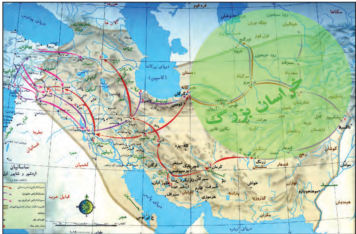
شکل ۲-۴ حدود پارتیا (خراسان بزرگ) در دوران باستان