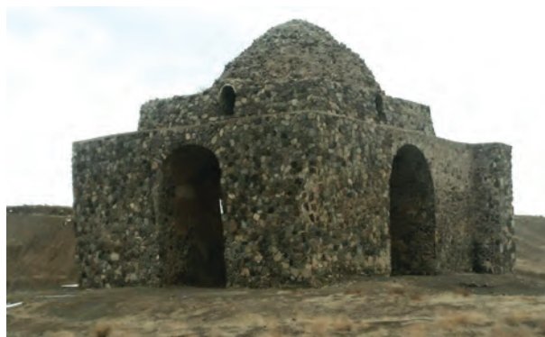
شکل ۴-۴ چهار طاقی بازه هور در دوره ساسانیان