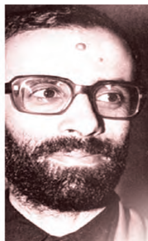
شهید یوسف کلاهدوز - جانشین فرماندهی کل سپاه