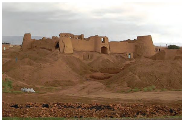
شکل ۸-۴ — قلعه سربداران — باشتین سبزوار