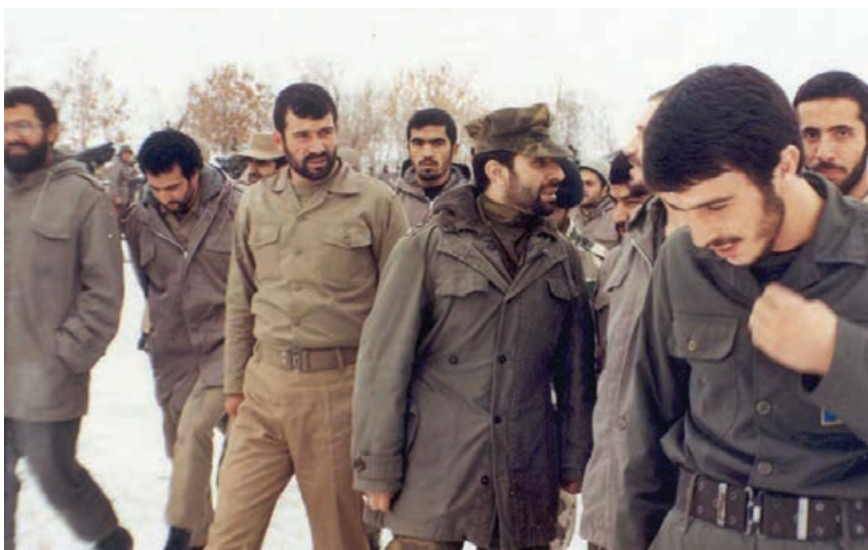
شکل ۱۴-۴: سردار سرلشکر شهید محمود کاوه و امیر شهید سپهبد علی صیاد شیرازی در مناطق عملیاتی

لشکر پنج نصر، لشکر ویژه شهدا، تیپ ۲۱ امام رضا (علیه السلام) از مهم‌ترین یگان‌های سپاه پاسداران انقلاب اسلامی بودند که در عملیات‌های متعددی چون طریق القدس، کربلای ۵، والفجر ۸ و جزابه و... رشادت‌های زیادی نشان دادند. و سند افتخار مقاومت مردم ایران در برابر هجمه همه جانبه دشمن بعثی را رقم زدند.