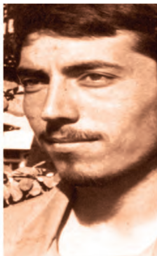
شهید ولی اله چراغچی مسجدی - جانشین لشکر ۵ نصر