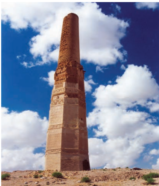
شکل ۷-۴- برج کرات - تایباد

در این دوران تجارت رونق گرفت، جاده ابریشم احیا شد و شهرهایی همانند سرخس، توس، قوچان، سبزوار و به ویژه نیشابور تبدیل به مراکز مهم علمی، تجاری و فرهنگی شدند. تأسیس مدارس نظامیه در شهرهای نیشابور، بغداد، خرگرد (خواف) توسط خواجه نظام الملک، امپراتوری سلجوقی را به اوج اقتدار و عظمت رسانید. از این دوران آثار معماری و هنری زیادی در گوشه و کنار خراسان به یادگار مانده است.