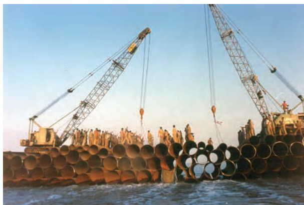
شکل ۱۵-۴- پل بعثت در داخل اروند رود «سند افتخار نیروهای مهندسی رزمی جهاد سازندگی خراسان»