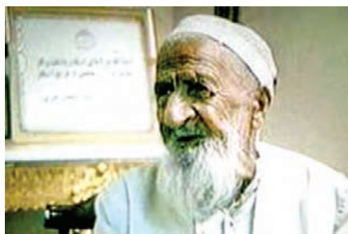
شیخ بهلول گنابادی

با تشکیل دولت صفویه و رسمیت دادن به مذهب شیعه آنها به خراسان و مشهد توجه خاصی نشان دادند. دولت صفویه در تاریخ به دلیل برقراری امنیت، توسعه اقتصادی و وحدت سیاسی در ایران از جایگاه خاصی برخوردار است. پس از سقوط صفویه توسط محمود افغان، نادر شاه افشار از خراسان (منطقه درگز و ابیورد) قیام کرد و با شکست دادن افغان ها یک بار دیگر اقتدار ایران را بازگرداند. نادر مدتی مشهد را به عنوان پایتخت خود برگزید. در دوره زندیه مشهد و خراسان همچنان در دست نوادگان نادر باقی ماند و سرانجام آقا محمدخان قاجار بساط دولت نادری را در مشهد برچید. در دوره قاجاریه بخش های مهمی از خراسان بزرگ از ایران جدا شد.