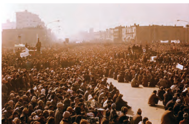
شکل ۱۲-۴ تظاهرات مردم مشهد در سال ۱۳۵۷

مردم مسلمان و انقلابی این استان در دوره حکومت پهلوی در کنار روحانیت و دیگر انقلابیون به مخالفت با اقدامات استبدادی و ضد مذهبی رژیم پرداختند. مبارزات مردم مشهد در دوره رضاشاه و واقعه کشف حجاب زیاتر د همگان است.