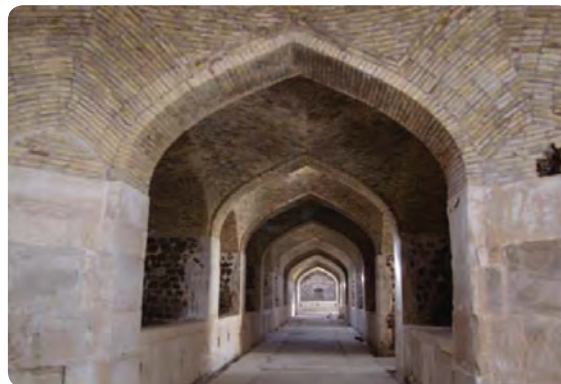
شکل ۱۳-۵- قصر بهرام در شهرستان گرمسار

پ) جاذبه‌های اقتصادی - معیشتی : این نوع جاذبه‌ها به فعالیت‌هایی گفته می‌شود که انسان با ساخت بناها و اشیای خاص ضمن تأمین معاش خود، موجب جلب توجه هر بیننده‌ای نیز می‌شود.