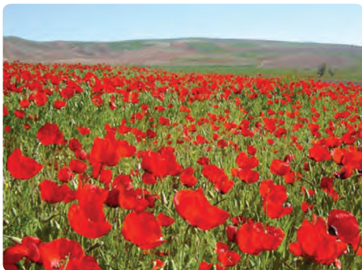
شکل ۱-۵ دشت شقایق حسین آباد کالپوش در شهرستان میامی

۵- تعدد جاذبه‌های طبیعی، فرهنگی و اقتصادی - معیشتی.