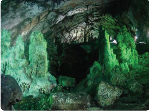
شکل ۳-۵ - تالار و ستون‌های سنگی زیبای غار دربند در شهرستان مهدی شهر

۲- غارها : غار دق کشکولی (زندان افغان) در شهرستان گرمسار، دربند در شهرستان مهدی شهر، شیربند در شهرستان دامغان، غارهای ناروان و یخان در شهرستان میامی، خواجه قنبر و مُلحدو در شهرستان شاهرود، غار دیو چاه و مَغارا' اختر در شهرستان سرخه.