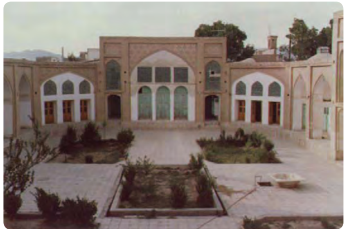
شکل ۱۷-۵- مدرسه موسویه شهر دامغان