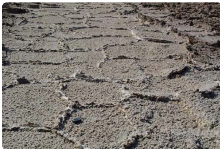
شکل ۷-۵ - کویر نمک

۸- دریاچه مسیله در جنوب غربی استان سمنان