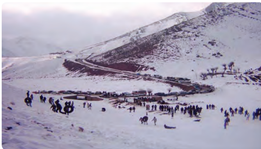
شکل ۲-۵ منظره زمستانی با پوشش برفی شه‌میرزاد در شهرستان مهدی شهر

۱- تنوع آب و هوایی و وجود مناطق بیلابقی البرز: استفاده از هوای معتدل تابستان و چشم‌اندازهای برفی زمستان مناطقی مانند بنه کوه در شهرستان گرمسار، شه‌میرزاد در شهرستان مهدی شهر، چشمه علی و کلاته رودبار و تویه دروار در شهرستان دامغان، بسطام در شهرستان شاهرود، کالپوش در شهرستان میامی، امامزاده عبدالله و اروانه در شهرستان سرخه.