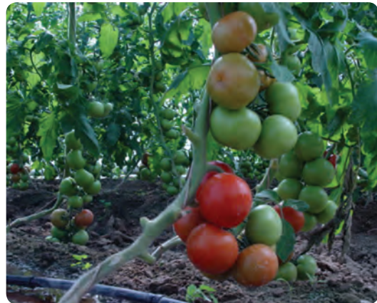
شکل ۲۰-۵- گوجه از محصولات گلخانه ای استان