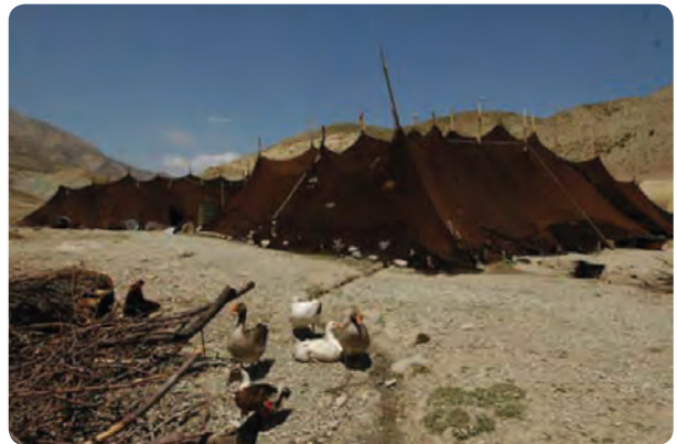
شکل ۱۵-۵- زندگی عشایری در استان