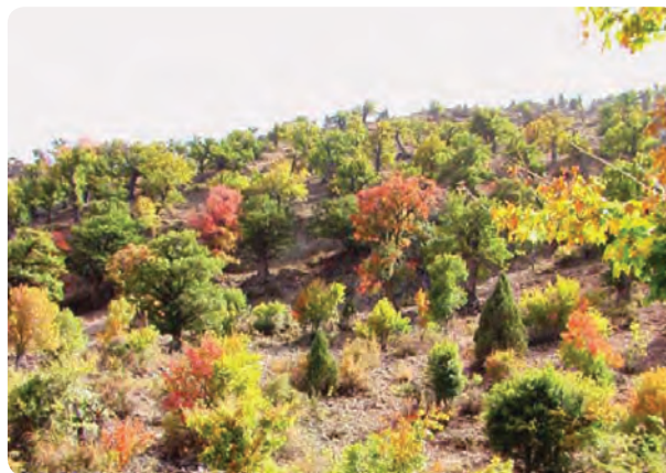
شکل ۹-۵- جنگل بادله کوه در شهرستان دامغان

۱۰- پوشش گیاهی و مرتعی مطلوب در برخی از مناطق شمالی استان مانند: جنگل فینسک و رودبارک در شهرستان مهدی شهر، جنگل سیاه خانی، بادله کوه و اسپيرو در شهرستان دامغان، جنگل کالپوش در شهرستان میامی، ابر و اولنگ در شهرستان شاهرود.