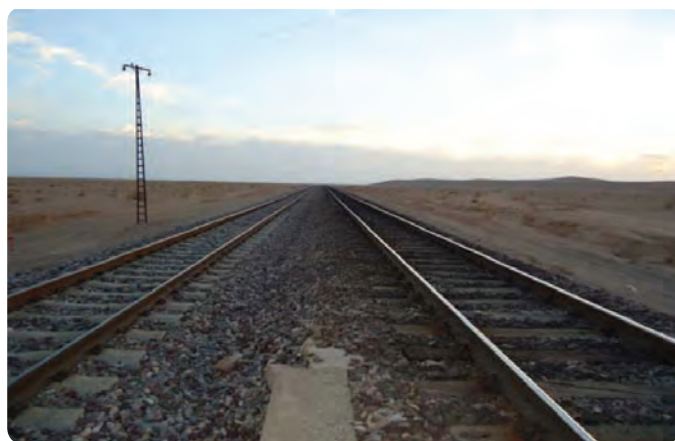
شکل ۲۸-۵- راه آهن دوخطی تهران - مشهد در استان سمنان

الف) عبور راه اصلی آسفالتی دوباندهٔ مواصلاتی آسیای مرکزی - اروپا از استان سمنان