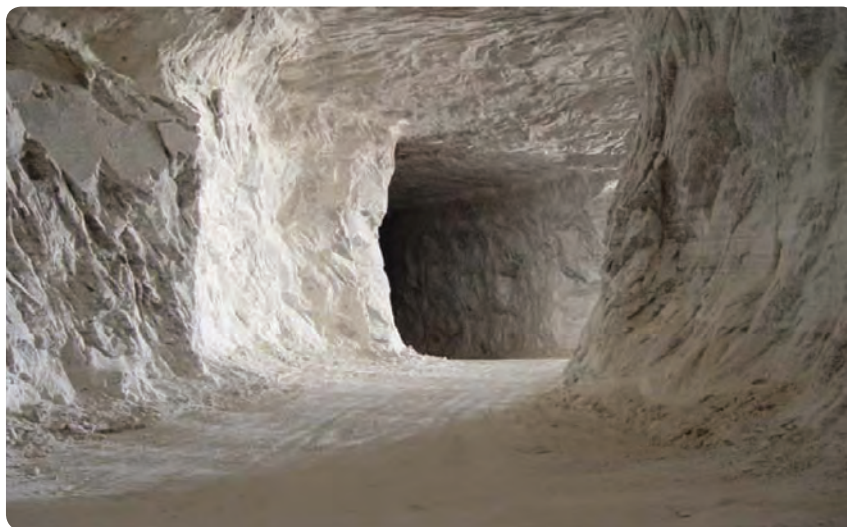
شکل ۲۷-۵- معدن نمک در شهرستان گرمسار

استان سمنان تأمین کنندهٔ ۵۰ درصد نمک، ۴۰ درصد گچ، ۸۵ درصد زئولیت، ۱۰۰ درصد سلسیتین، ۸ درصد سولفات سدیم و ۲۰ درصد کرومیت کشور است.