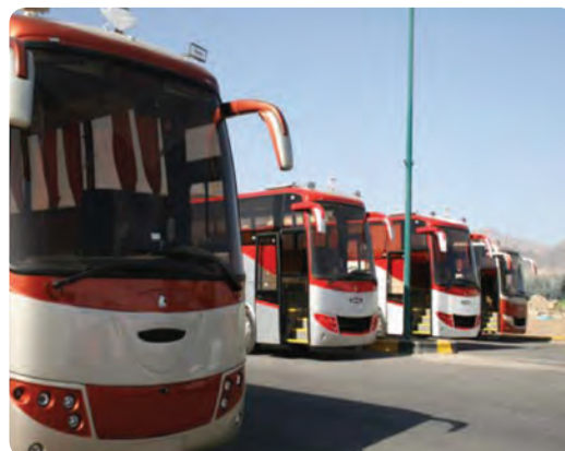
شکل ۲۵-۵- نمونه‌هایی از واحدهای تولیدی - صنعتی استان سمنان