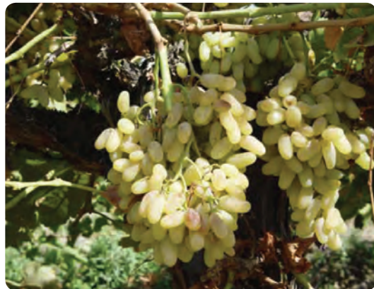
شکل ۲۲-۵- انگور از محصولات باغی شهرستان شاهرود

۳) پرورش دام و طیور : با توجه به گستردگی، تنوع ناهمواری و آب و هوا، استان سمنان یکی از قطب های پرورش دام و طیور در کشور به شمار می رود. بر این اساس اشکال مختلف پرورش دام و طیور در سطح استان به شرح زیر است: * پرورش دام سبک شامل: گوسفند، بز و دام سنگین شامل: گاو، شتر، گاو میش و اسب * پرورش طیور شامل انواع مرغ های گوشتی، تخم گذار، بوقلمون، شتر مرغ، بلدرچین و کبک