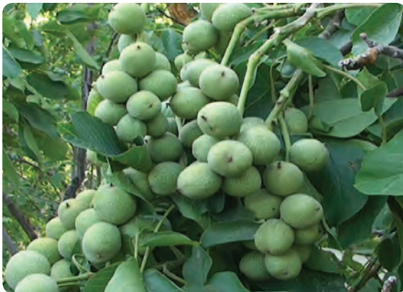
شکل ۲۳-۵- گردو از محصولات باغی شه میرزاد، در شهرستان مهدی شهر و مناطق شمالی دامغان