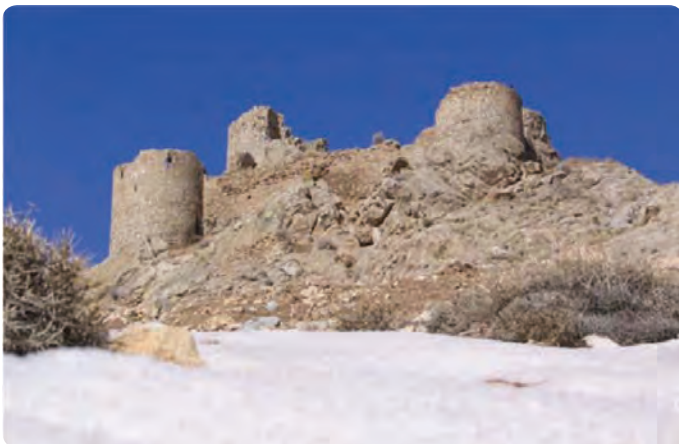
شکل ۱۸-۵- شیر قلعه شه میرزاد در شهرستان مهدی شهر