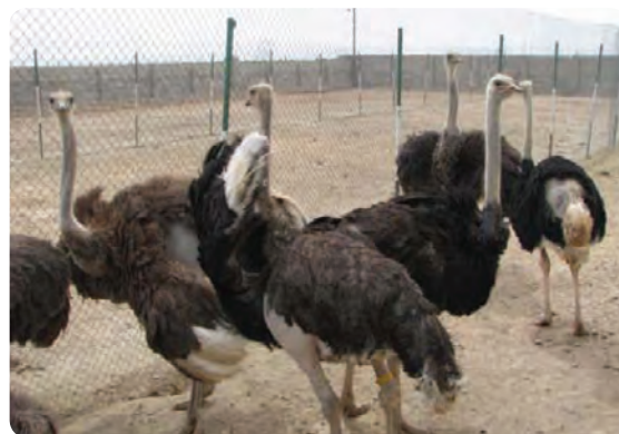
شکل ۲۴-۵- پرورش مرغ و شتر مرغ در استان

توانمندی‌های بخش صنعت و معدن استان: صنعت از بخش‌های عمده و حساس هر منطقه به‌شمار می‌رود که اهمیت این بخش ناشی از نقش بالا و روزافزون آن در جهت رفع نیاز جامعه به کالاهای ضروری صنعتی، کمک به رشد و توسعه سایر بخش‌های تولیدی و زیربنایی و در نهایت تحقق استقلال اقتصادی را به دنبال دارد.