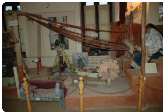
شکل ۱۱-۵- موزه مردم شناسی در شهر شاهرود