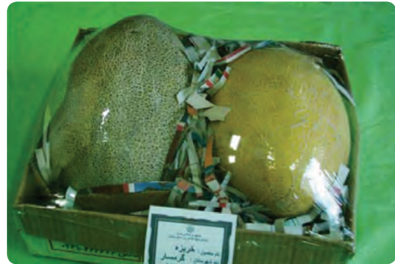
شکل ۲۹-۵- دو نمونه از محصولات کشاورزی صادراتی استان