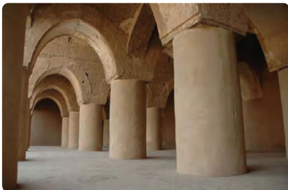
شکل ۱۴-۵- مسجد تاریخانه در شهر دامغان