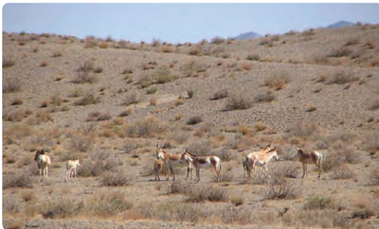
شکل ۸-۵- گور خر آسیایی زیست کره توران در شهرستان شاهرود

۱۰- پوشش گیاهی و مرتعی مطلوب در برخی از مناطق شمالی استان مانند: جنگل فینسک و رودبارک در شهرستان مهدی شهر، جنگل سیاه خانی، بادله کوه و اسپيرو در شهرستان دامغان، جنگل کالپوش در شهرستان میامی، ابر و اولنگ در شهرستان شاهرود.