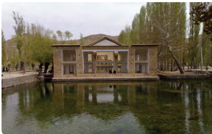
شکل ۶-۵ - چشمه علی در شهرستان دامغان

۵- چشمه‌های آب شیرین: نزدیک به 35^{\circ} چشمه در استان جریان دارد که مناظر بدیع و زیبایی را به وجود آورده‌اند؛ مانند چشمه علی دامغان