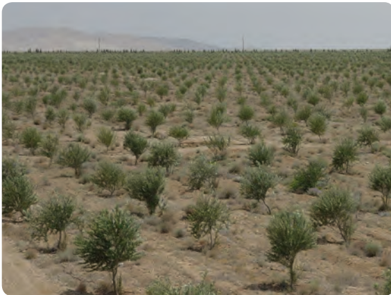
شکل ۲۱-۵- زیتون از محصولات باغی استان

۲) باغداري : با توجه به تنوع شرایط آب و هوایی در استان سمنان محصولات باغی را می توان در دو گروه طبقه بندی کرد: * میوه های گرمسیری و نیمه گرمسیری مانند: زیتون، پسته، انار، انجیر، خرما و ... * میوه های معتدل و سردسیری مانند: انگور، گردو، زردآلو، آلبالو، بادام، آلو، گیلاس، سیب و ... از سویی دیگر نزدیک بودن استان سمنان به مرکز جمعیتی ایران زمینه را برای توسعه کشت های گلخانه ای فراهم نموده است.