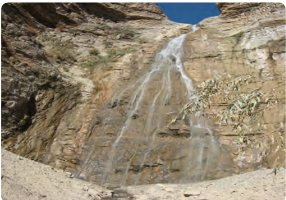
شکل ۵-۵ - آبشار رامه در شهرستان آرادان

۴- آبشار : آبشار روزیه در روستای چاشم از شهرستان مهدی شهر، آبشارهای نام نیک کالپوش در شهرستان میامی و تنگه داستان مجن در شهرستان شاهرود، آبشار نِسروای دیباج در شهرستان دامغان، آبشار رامه در شهرستان آرادان و آبشار جوین در شهرستان سرخه.