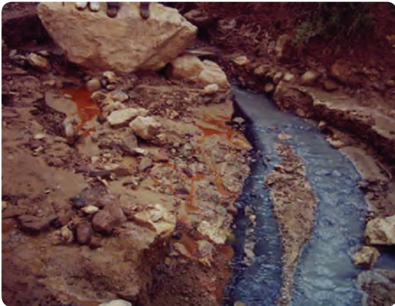
شکل ۴-۵ - چشمه هفت رنگ مجن در شهرستان شاهرود

۳- آب‌های معدنی و درمانی : چشمه شاه و عین‌الرشید در جنوب شهرستان گرمسار، تلخاب لاسجرد و آب گرم در شهرستان سرخه، آب معدنی دیباج در شهرستان دامغان و چشمه هفت‌رنگ مجن در شهرستان شاهرود.