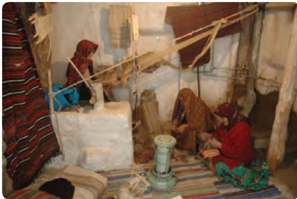
شکل ۱۶-۵- کارگاه تولیدی گلیم و جاجیم در استان