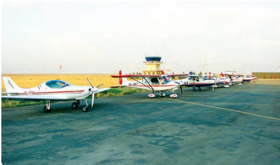
شکل ۱۱-۱۴- فرودگاه آزادی - نظرآباد

✳️ فرودگاه آزادی: این مجتمع فرودگاهی سال ۱۳۷۹ در شرق روستای صالحیه شهرستان نظرآباد افتتاح شد. مهم‌ترین اهداف احداث این فرودگاه تربیت نیروی انسانی در زمینه طراحی و ساخت هواپیماهای کوچک و آموزش هوانوردی است.