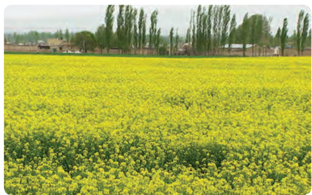
شکل ۱۴-۱- تغییر شیوه‌های سنتی و تبدیل آن به کشت‌های جدید