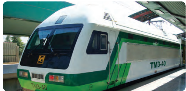
شکل ۸-۱۴- نمونه‌هایی از فعالیت‌های ساخت و ساز در مترو