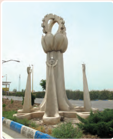
شکل ۳-۱۴- ورودی شهرک صنعتی اشتهارد

شهرک صنعتی اشتهارد: این شهرک به علت دسترسی به راه‌های ارتباطی و زمین‌های بایر و وسیع در مسیر جاده اشتهارد- بومین زهرا مکان‌یابی شد و در حال حاضر با داشتن ۵۲۵ واحد صنعتی فعال (فلزی - غذایی - شیمیایی و...) از اصلی‌ترین مناطق صنعتی کشور محسوب می‌شود.