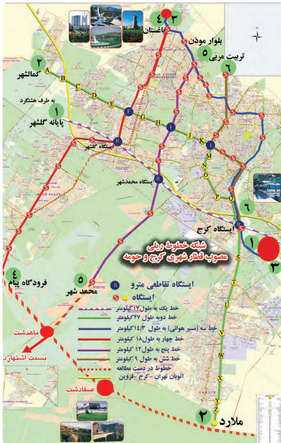
شکل ۹-۱۴ نقشه خطوط مترو کرج و حومه