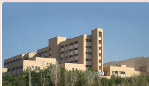
شکل ۱۶-۱۴- بیمارستان تخصصی البرز