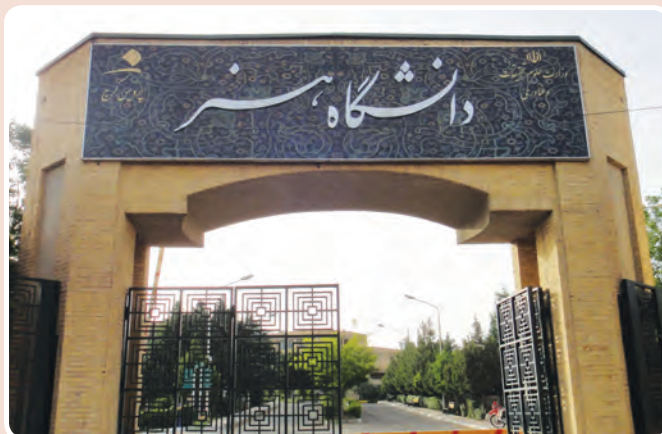
شکل ۱۴-۱۴- دانشگاه هنر - کرج