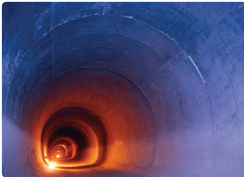
شکل ۲- ۱۵- توسعه مترو راه حلی برای ترافیک و حمل و نقل عمومی

برای کنترل و ساماندهی مهاجرت به استان و افزایش اشتغال، چه اقداماتی می‌توان انجام داد؟