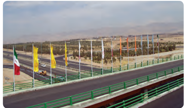
شکل ۷-۱۴- راه‌های استان