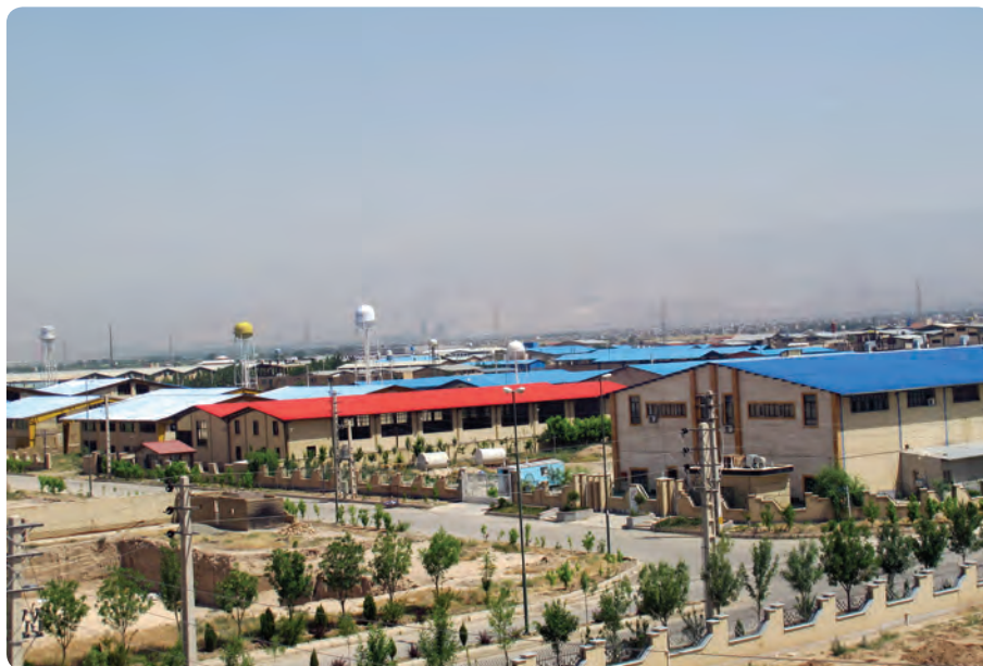
شکل ۲-۱۴- شهر صنعتی نظرآباد

در سال‌های اخیر به دنبال ممنوعیت تأسیس کارگاه‌های صنعتی در تهران، بخش‌هایی از استان برای احداث شهرک‌های صنعتی مورد توجه قرار گرفت که بسیاری از آن‌ها به مرحله بهره‌برداری رسیده است و تعدادی دیگر در حال تکمیل است. اشتغال‌زایی و افزایش تولیدات داخلی از نتایج ایجاد این شهرک‌های صنعتی می‌باشد.