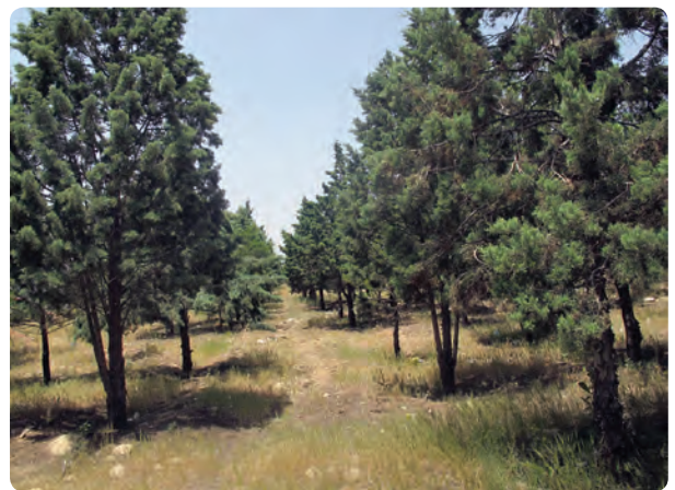
شکل ۱۹-۱۴ مهار آب‌های سطحی و جنگل‌های دست کاشت