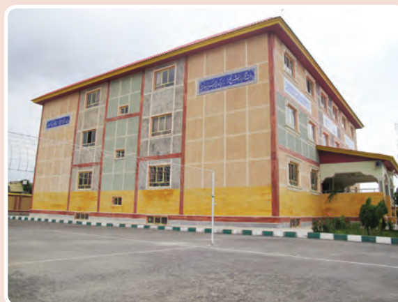
شکل ۱۲-۱۴- مدارس

جدول ۱۳-۱۴- تعداد دانش‌آموزان و کارکنان آموزشی کلیه مقاطع تحصیلی ۹۲-۱۳۹۱