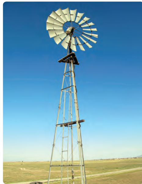
شکل ۱۸-۱۴ استفاده از انرژی‌های نو