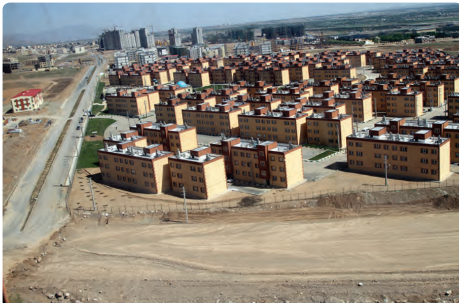
شکل ۱- ۱۵- مسکن مهر