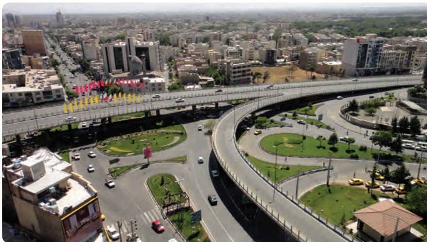
شکل ۴-۱۴- بل‌های روگذر آزادگان نمونه‌ای از فعالیت‌های عمرانی استان

فعالیت‌های عمرانی استان به سه بخش تقسیم می‌شوند: ۱- عمران شهری ۲- عمران روستایی ۳- راه و ترابری و حمل و نقل. ۱- عمران شهری: فعالیت‌ها و دستاوردهای عمرانی بسیاری (در زمینه تهیه طرح‌های تفضیلی و هادی، خدمات شهری، افزایش و اصلاح راه‌های ارتباط درون شهری و سایر تأسیسات زیربنایی) موجب پیشرفت و توسعه شهرهای استان شده است.