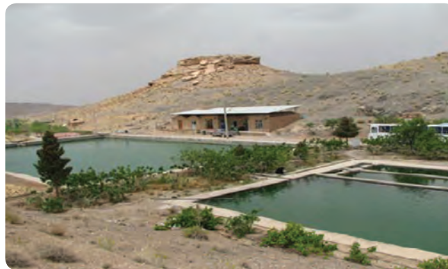
شکل ۳-۶- استخر پرورش ماهی