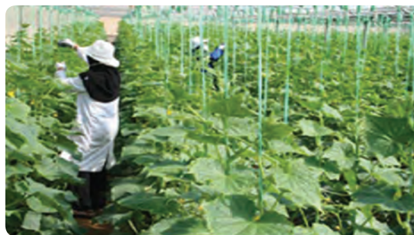
گلخانه تولید خیار