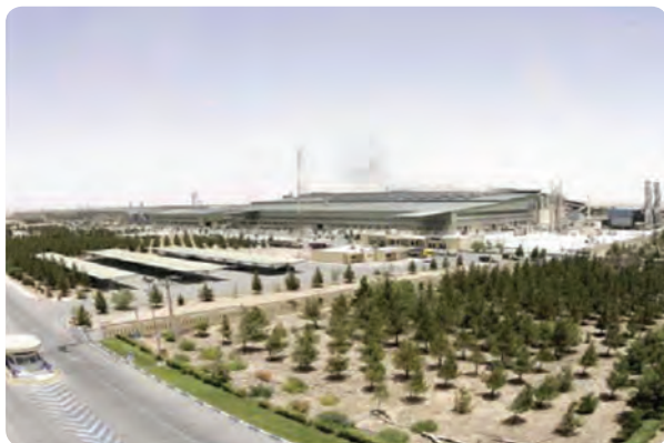
شکل ۹-۶- شرکت فولاد آلبازی اشکذر