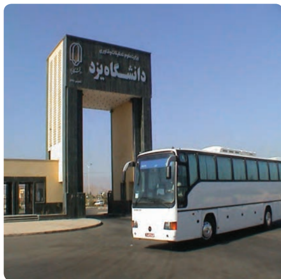
شکل ۱۱-۶- دانشگاه یزد

مراکز دانشگاهی: دانشگاه یزد، دانشگاه علوم پزشکی شهید صدوقی، دانشگاه آزاد اسلامی یزد و میبد و دانشگاه‌های پیام نور تفت،