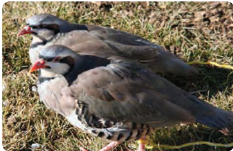
پرورش کبک - میبد