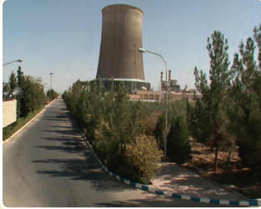
شکل ۱۰-۶- نیروگاه سیکل ترکیبی

۶- ثبت ۳۹ اختراع از سال ۱۳۸۴ تاکنون توسط واحدها و شرکت‌های مستقر در پارک یزد ۷- کسب ۷ مقام کشوری در حوزه رباتیک توسط تیم رباتیک پارک علم و فناوری یزد انرژی: بررسی شاخص‌های صنعت برق نشان می‌دهد، بیشترین سهم مصرف برق استان به ترتیب متعلق به بخش صنعت با ۵۷ درصد و بخش خانگی با ۱۸ درصد است.