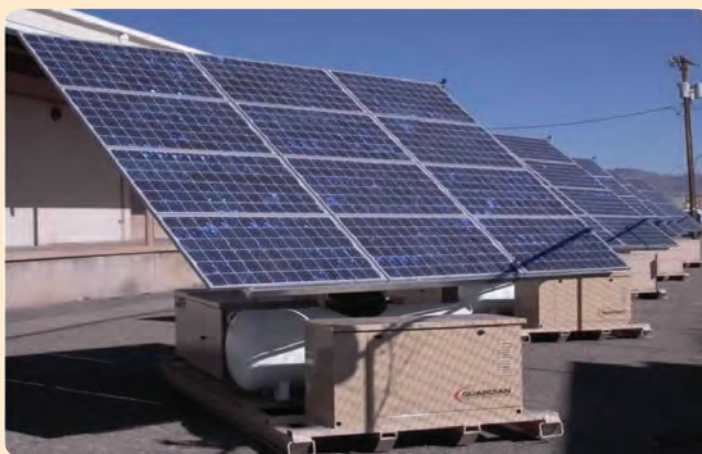
شکل ۱۴-۶- انرژی خورشیدی

در استان یزد به دلیل پتانسیل بالای تابش خورشید، نیروگاه خورشیدی - حرارتی در زمینی به مساحت ۹ کیلومترمربع در اشکذر در حال احداث است. به منظور ساخت این نیروگاه مشاوران آلمانی و ایرانی (پژوهشگاه وزارت نیرو) ضمن امکان‌سنجی و ارزیابی مناطق مناسب برای نصب نیروگاه، با توجه به مواردی چون: میزان تابش خورشید، تولید، تقاضا و مصرف برق، دسترسی به خطوط انتقال و شبکه دسترسی به سوخت و آب، مسائل زیست محیطی و هزینه زمین مورد استفاده، ناحیه‌ای در شمال غربی استان یزد را به عنوان مناسب‌ترین محل در ایران جهت احداث این نیروگاه انتخاب کرده‌اند.