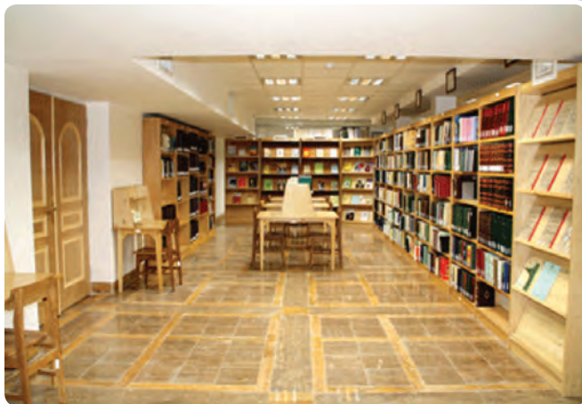
شکل ۱۳-۶- سالن کتابخانه وزیری یزد