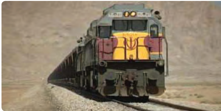
شکل ۱۹-۶- راه آهن استان

با توجه به قرارگیری استان در مرکز کشور و بر سر راه دالان‌های بین‌المللی شمال - جنوب و شرق - غرب و شبکه بزرگراه‌های آسیایی و محل تلاقی مهم‌ترین راه‌های مواصلاتی کشور و همچنین قرارگیری استان در مسیر راه بارهای ترانزیتی از بندرعباس و بندر چابهار و مرزهای شرقی کشور به سمت پایتخت و مناطق شمالی - شمال غرب و غرب کشور، بخش حمل و نقل مورد توجه ویژه‌ای قرار دارد.