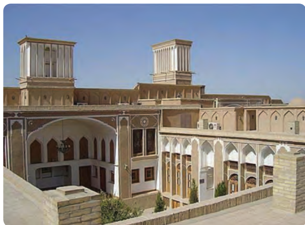
شکل ۱۸-۶- هتل به سبک سنتی در یزد

ایجاد واحدهای اقامتی سنتی و پذیرایی در بافت قدیمی شهرها