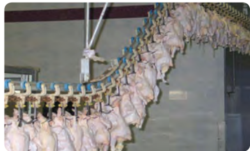
تولید مرغ - میبد