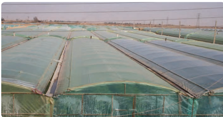
شکل ۱۷-۶- کشت گلخانه‌ای در مهریز