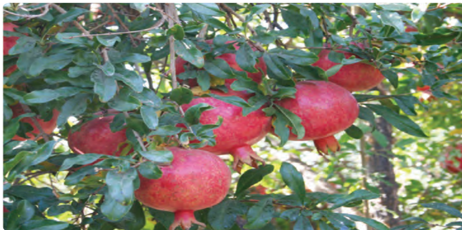
شکل ۱۶-۶- محصول انار

چشم‌انداز توسعه کشاورزی استان: بخش کشاورزی استان، بخشی توسعه یافته و پایدار، مبتنی بر دانش فنی و تجربه بالای بهره‌برداران و نیروی انسانی سخت‌کوش و توانمند است که لازم بوده تا در ارتباط با سایر بخش‌ها و محدودیت‌های موجود در منابع، جایگاه برتر را در تولید و صدور محصولات کشاورزی، تولید بذر اصلاح شده و تولید قلمه و نهال در سطح کشور کسب کند.