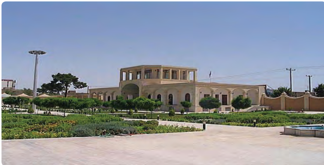
شکل ۲۱-۶- پارک علم و فناوری یزد

محورهای اصلی توسعه بخش زیربنایی، عمران شهری و مسکن اجرای پروژه‌های انتقال آب از خارج حوزه به استان به‌ویژه طرح عظیم خط دوم انتقال آب از سرشاخه‌های کارون بازسازی بافت‌های فرسوده احداث مخازن آب شهری اجرای طرح توسعه دوچرخه‌سواری در شهرها (احیای فرهنگ دوچرخه‌سواری) سرمایه‌گذاری مشترک در جهت احداث پارک‌های عمومی شهری و احداث باغ‌شهرها با اولویت باغ‌شهر یزد تأمین مسکن به‌ویژه برای طبقات محروم و اقشار کم‌درآمد، با استفاده از مصالح و فناوری‌های جدید و روز دنیا رئوس محورهای سند جامع توسعه IT و ICT ایجاد بانک اطلاعات شهری و ارائه خدمات الکترونیک توسط شهرداری‌ها توسعه فروشگاه‌ها و بازارهای اینترنتی توسعه بانکداری الکترونیک توسعه مشاوره و خدمات پزشکی از راه دور توسعه سیستم‌های الکترونیک در سطح مراکز بهداشتی درمانی و دارویی