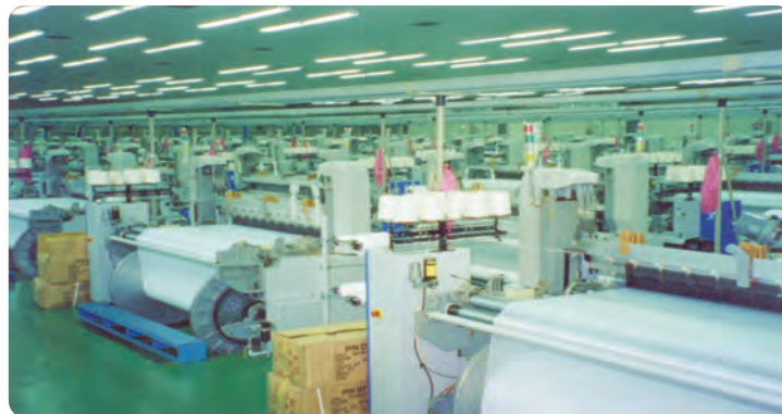
شکل ۶-۷ نمونه ای از صنایع نساجی استان

به موارد فوق می توان محصولات نوین در حال ظهور دارای تکنولوژی بالا با ترکیبات نانو را افزود.