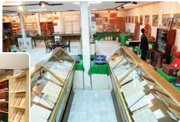
شکل ۱۲-۶- موزه کتابخانه وزیری یزد

فرهنگ و هنر: در سال‌های ۱۳۸۵-۱۳۵۷ تعداد کتابخانه‌های عمومی استان نزدیک به پنج برابر و تعداد کتاب‌های موجود در این کتابخانه بیش از ۹ برابر افزایش داشته است. تعداد سالن‌های سینما از سه سالن به پنج سالن افزایش یافته است. تعداد چاپخانه‌ها نیز چهار برابر و نشریات محلی از سه عنوان به ۶۲ عنوان رسیده است. توسعه و گسترش کانون‌های پرورش فکری کودکان و نوجوانان و کانون‌های فرهنگی و هنری از جمله دیگر فعالیت‌های فرهنگی انجام گرفته بعد از پیروزی انقلاب است. همزمان با گسترش شبکه‌های سراسری صدا و سیما شبکه استانی صدا و سیما نیز افتتاح گردیده است.