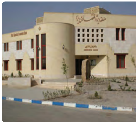
شکل ۵-۶- منطقه ویژه اقتصادی یزد