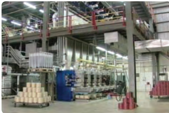
شکل ۸-۶- کابل‌های نوری شهید قندی در یزد