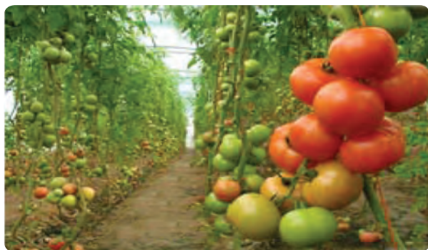
گلخانه تولید گوجه‌فرنگی