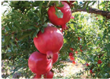
تولید انار - تفت - مهریز