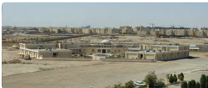
شکل ۲۰-۶- احداث درمانگاه تخصصی و فوق تخصصی بیمارستان شهید صدوقی

ایجاد مراکز مشاوره خدمات پیشگیری آسیب‌های اجتماعی و سلامت