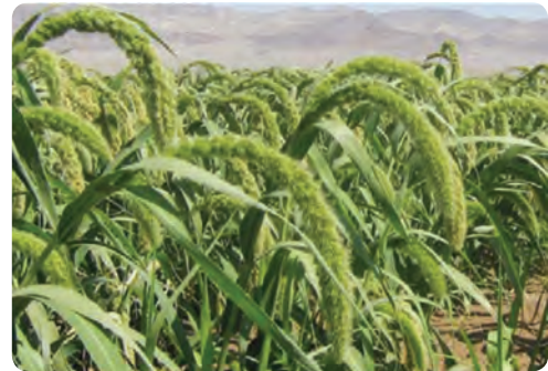
تولید ذرت - خاتم