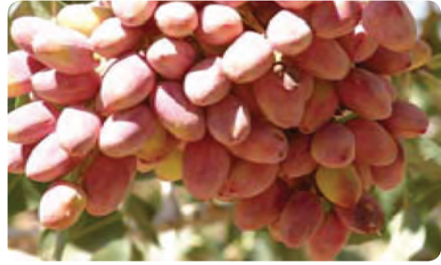
تولید پسته - اردکان