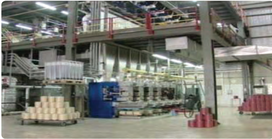
شکل ۱۵-۶- کارخانه کابل نوری یزد