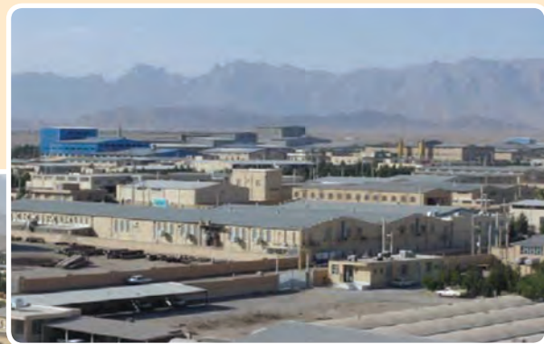
شکل ۴-۶- شهرک صنعتی خضرآباد یزد