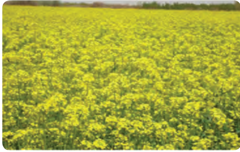
تولید کلزا - ابرکوه