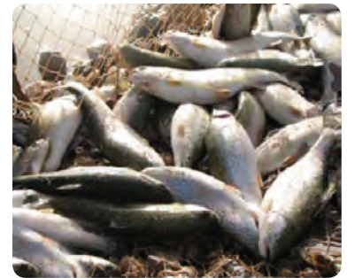
شکل ۱-۶- نمونه‌ای از تولیدات در زمینه کشاورزی استان یزد